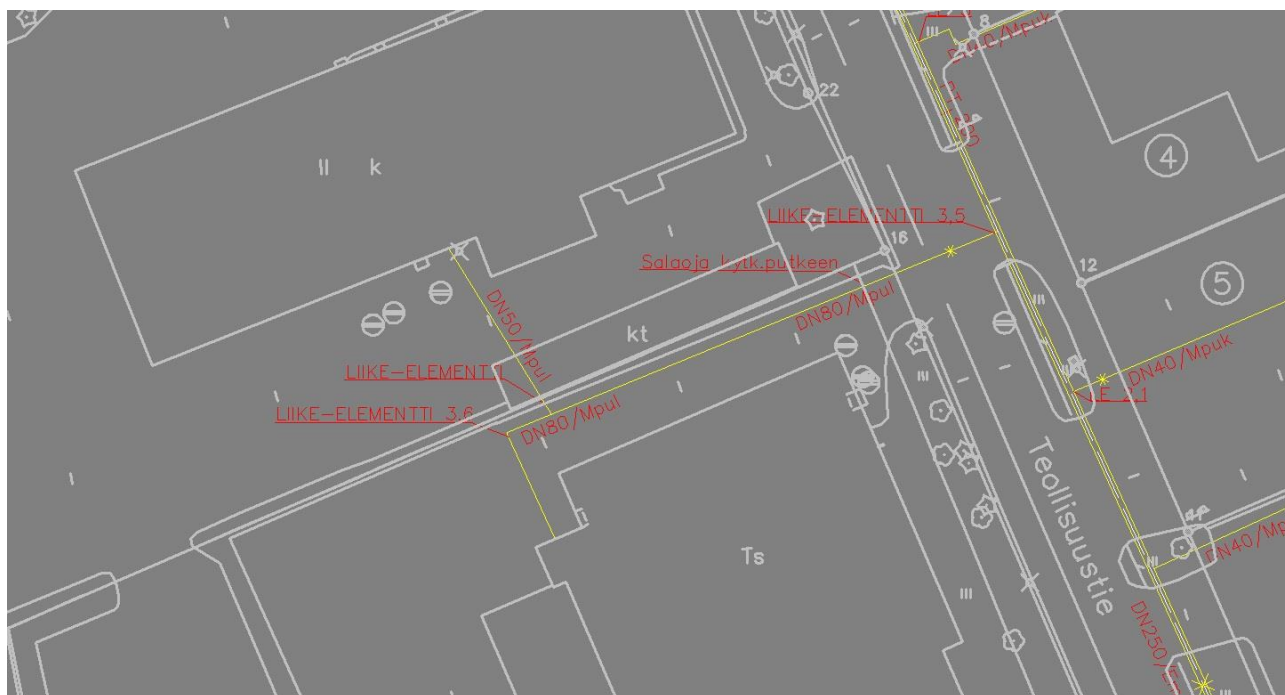
Bild 4: En klarare bild hur den ser ut närmareifrån. Gula linjerna är fjärrvärmeröret och de röda texterna är information. Bilden är självtagen ur min arbetsdator.