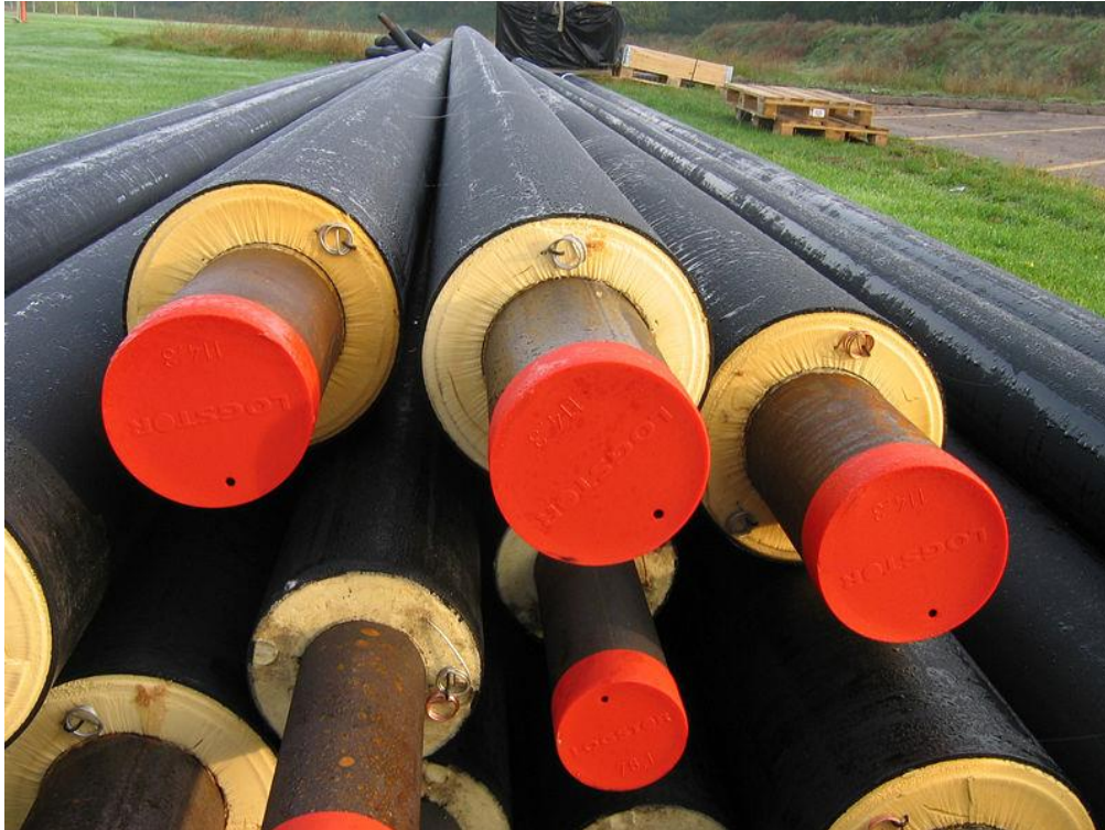
Bild 2: Fjärrvärmerör av olika storlekar.

Dessa rör är 2Mpuk det vill säga ett stålrör i varje plaströr. Mpuk är två stycken, oftast mycket mindre stålrör i ett större plaströr.