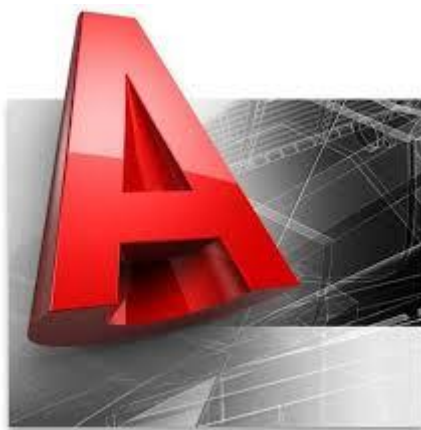
Bild7: AutoCADs logo. (Themech 2014)

AutoCAD anmälde sig också intresserade av att fylla våra behov och berättade att det är möjligt att planera fjärrvärme med deras mjukvara. Tyvärr tyckte vi att deras mjukvara var för ung för att tas seriöst då vi misstänkte att det skulle uppstå en del problem eftersom deras fjärrvärmemjukvara var rätt så ny.