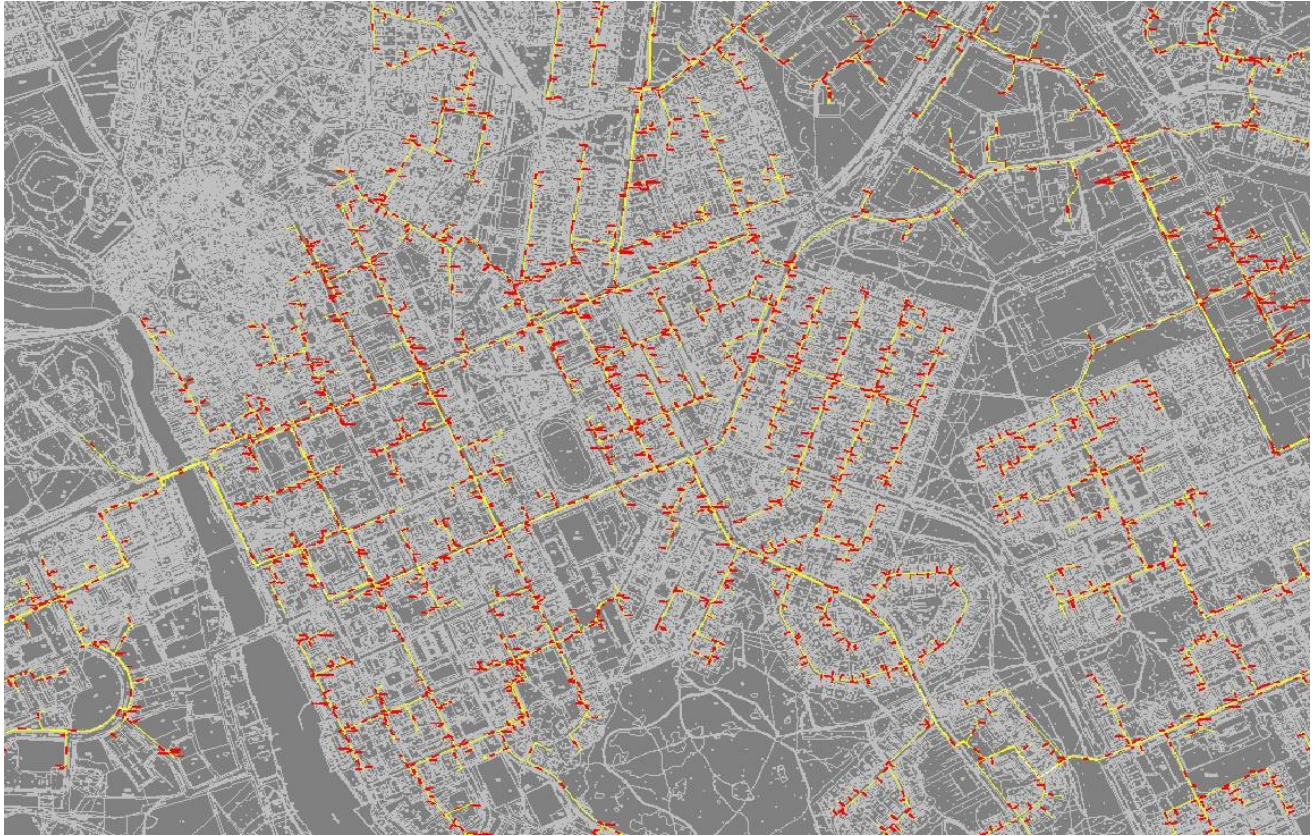
Bild 3: Borgå Centrums fjärrvärmenäte 2013. De gula linjerna är fjärrvärme rör och de röda är texter med information. Bilden är självtagen från min arbetsdator.

På denna bild kan man se att det finns mycket information att få fram från denna bild. Oftast är vi bara intresserade av rörtyper, rörstorleken och var brunnarna ligger. Dessa viktigaste sakerna kommer endast att synas i Tekla och resten av informationen kommer att vara gömd.