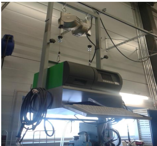
Kuva 6. Bosch BEA250 -pakokaasuanalysaattori

Rinta-Joupin Autoliikkeellä on Turun toimipisteessä käytettävissä kaksi pakokaasuanalysaattoria ja olemme tarjonneet jo aikaisemmin virallisia pakokaasumittauksia. Toinen pakokaasumittari on merkiltään Stargas Global Diagnosti Systems 989 (Kuva 7) ja tällä voidaan mitata bensiini- ja dieselkäyttöisen päästöt sekä suorittaa OBD-mittaus. Toinen on Bosch BEA250 (Kuva 6) ja tällä voidaan suorittaa ainoastaan bensiinikäyttöisen pakokaasu- ja OBD-mittaus.