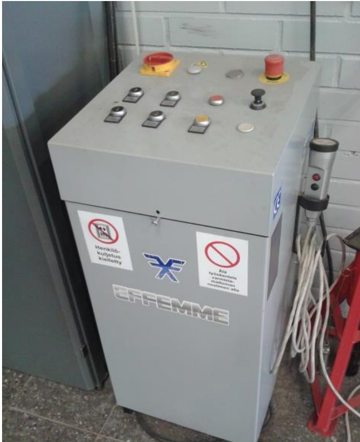
Kuva 9. Nostimen käyttöpaneeli.

Suuntausnosturin oikealla puolella on nosturin käyttöpaneeli (Kuva 9) ja tämän oikealla sivustalla roikkuu ohjainkapula, jolla liikutetaan välilyöntitestauslaitteen levyjä.