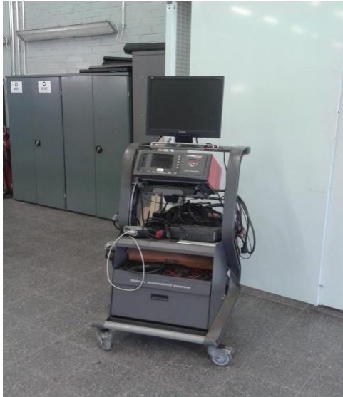
Kuva 7. Stargasin pakokaasuanalysaattori

Boschin pakokaasuanalysaattori on tullut uutena käyttöön remontin jälkeen eli hankittu vuonna 2011. Kalibrointi on tehty 12.9.2013.