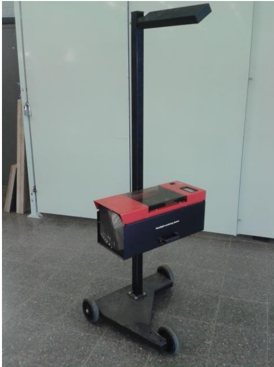
Kuva 11. Valojen suuntauslaite

Valojen suuntauksen tarkistukseen korjaamolla on käytössä jalustalla olevia Tecnotestin tarkistuslaitteita (Kuva 11), joissa on sisään rakennettu valotehon mittari.