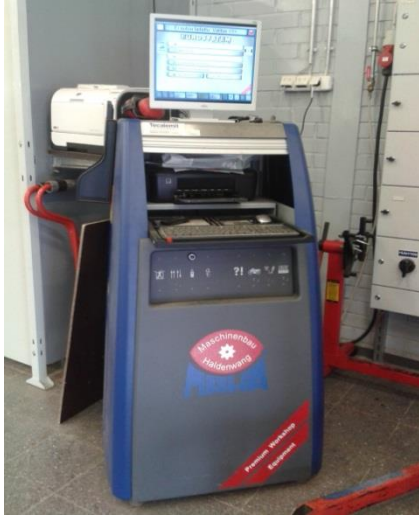
Kuva 5. Jarrudynamometrin, vaa'an ja heilahduksenvaimentimien testauslaitteen käyttöpääte.