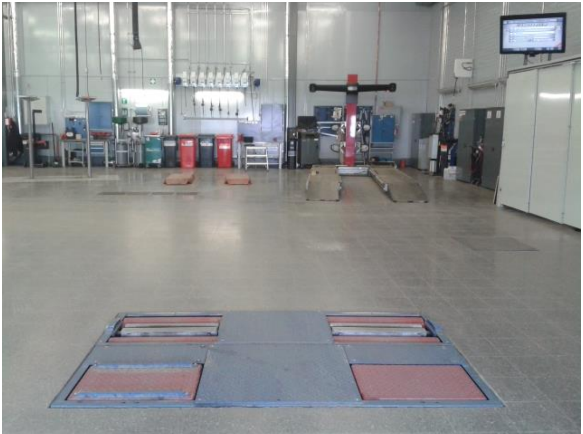
Kuva 3. Hallinäkymä

Jarrutestauksen jälkeen siirrytään kuvassa oikealla puolella näkyvälle siltanosturille jatkotarkastuksia varten.