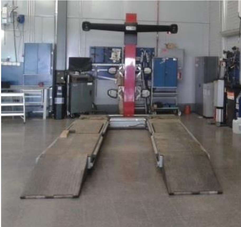
Kuva 8. Siltanosturi ajorampeineen ja välyksentestauslaitteineen.

Siltanosturi tarkastetaan vuosittain ja viimeisin tarkastus on tehty 6.9.2013. Siltanosturin pituus ilman rampeja on 5,2 m ja ajosiltojen minimi leveys 0,92 m sekä maksimi 2,3 m. Nosturin nostokyky 4500 kg ja keventimen 2600 kg. Kevennin on merkiltään Rotary ja malliltaan RJ-X26,