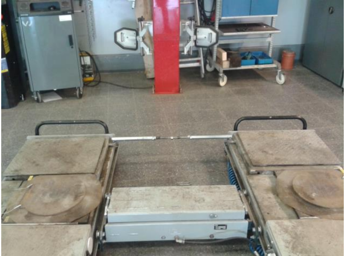
Kuva 10. Kevennin ja välystentestauslaitteen sivuttain liikkuvat levyt.

Kuvassa 10 on esitetty suuntausnosturin päädyssä, ennen mustia pysäytin rautoja oleva välystentestauslaite eli ravistin. Ajourampin keskeltä löytyy kevennin.