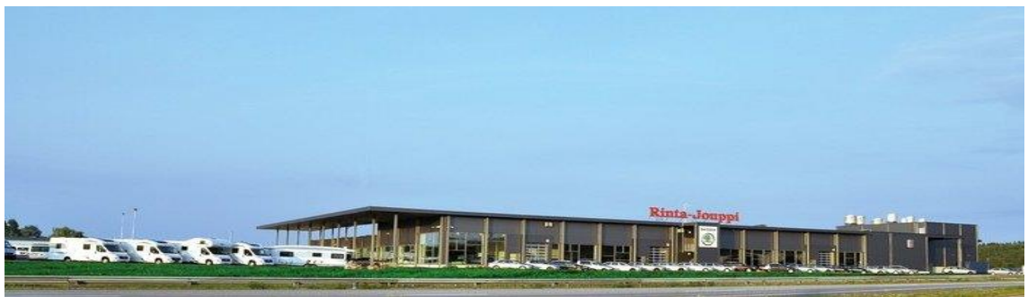
Kuva 1. Rinta-Joupin Autoliike Oy Turku

Turun toimipisteen laajennus valmistui 2011 ja on tiloiltaan yksi uusimmista Rinta-Joupin Autoliike Oy:n pisteistä (Kuva 1). Toimipisteessä työskentelee kaksi varaosamyymäjä, kaksi henkilöautokorjaamon työnjohtajaa, yksi matkailuautokorjaamon työnjohtaja ja yhteensä 14 asentajaa.