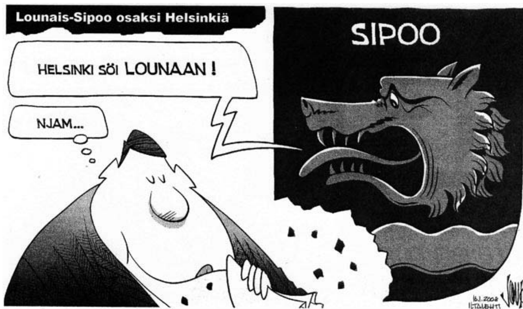
Kuva 1. Lounais-Sipoon siirtyminen Helsingille sai paljon julkisuutta korkeimman hallinto-oikeuden annettua päätöksensä rajasiirron laillisuudesta.

Tässä opinnäytetyössä tarkastellaan tiedotteen vaikutusta eri medioissa ilmestyneeseen uutisointiin. Tarkasteluun on valittu korkeimman hallinto-oikeuden laatima Helsingin, Sipoon ja Vantaan kuntarajan muutosta käsittelevä tiedote. Tammikuussa 2008 julkaistussa tiedotteessa kerrottiin oikeuden päätöksestä hylätä kiistelystä rajamuutoksesta tehdyt valitukset. Käytännössä päätös sinetöi Sipoon lounaisosien siirtämisen Helsingin haltuun.