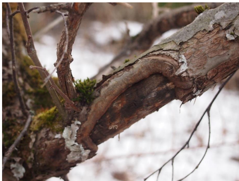
Figur 3. Bild av ett äppelträd angripet av fruktträdskräfta.