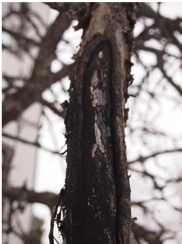
Figur 4. Bild av ett äppelträd angripet av fruktträdkräfta.

Informationsbladet är en sammanfattning av litteraturstudien jag gjort. Jag tog med de viktigaste sakerna som jag anser att människor behöver veta och har nytta av för att kunna ta hand om sina äppelträd för att undvika att deras äppelträd blir angripna av fruktträdkräfta samt att den sprider sig vidare. Först kommer ett stycke där det är beskrivet allmänt om sjukdomen. Sedan kommer en ruta där jag har tagit upp de viktigaste sakerna man skall tänka på vid plantering, såsom vad man bör tänka på när man väljer platsen för sitt äppelträd samt tekniska saker vid själva planteringen. En annan ruta innehåller de saker man skall tänka på vid beskärningen. Där beskrivs hur och när beskärningen skall göras för att undvika angrepp. Under nästa rubrik har jag beskrivit sjukdomens utseende samt en bild på hur sjukdomen kan se ut. Tillslut finns det råd om vad man bör göra om trädet visar symptom på sjukdomen. (se bilaga1).