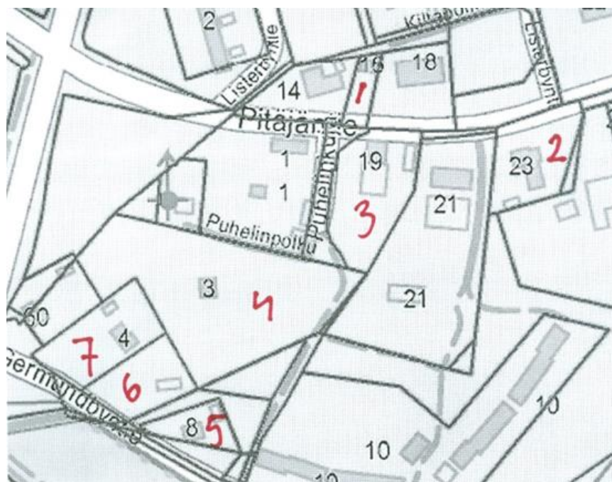
Figur 1. Bild över området där undersökningen gjordes på 7 gårdar.

Resultatet av undersökningen blev att av de träd som var unga hade inga symptom på sjukdomen (se tabell 1 och 2). Av de gamla träden var dock 32 stycken angripna, endast 4 var friska från fruktträdskräfta. Sammanlagt av de 47 träden var 68% angripna av fruktträdskräfta (se tabell 2). Av de gamla träden var 89 % angripna medan 0 % av de unga träden var angripna (se figur 2).