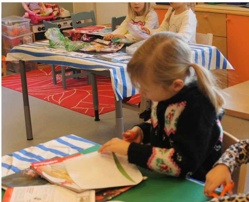
KUVA 4. Lapset askartelemassa

Haastattelussa lapset toivoivat paljon askartelua ja tähän vaiheeseen olin varautunut kartongeilla ja lasten lajittelemilla roskilla. Lisäksi olin tuonut joitakin kuvalehtiä, joista lapset saivat leikata tarvittavia kuvia. Jokaisella oli pöydässään liimaa ja sakset, jotta materiaalin etsimiseen ei kuluisi liikaa aikaa. Lapset jaettiin pareiksi ja jokainen pari pääsi työstämään yhtä kartonkia. Kaikki lapset yhtä lukuun ottamatta, lähtivät innokkaasti työstämään omaa kartonkia (kuva 4). Pienen motivoinnin jälkeen viimeinenkin lapsi lähti innokkaasti työstämään kartonkia parinsa kanssa. Tähän vaiheeseen olin varannut aikaa runsaasti, ettei askartelua tarvitse suorittaa kiireessä. Askartelun lomassa lapset innostuivat juttelemaan omia juttujaan, kuten tulevista syntymäpäiväjuhlista. Lopputuloksena oli hyvin taiteellisia näkemyksiä jätteastioiden sisällöstä (kuva 5). Lapset olivat erittäin tyytyväisiä lopputulokseen.