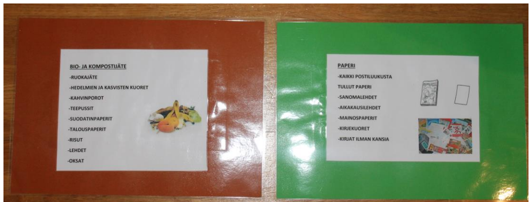
KUVA 2. Jätteenlajittelu tauluja takaa

Toimintapäivän aluksi kokosin lapset heidän päiväaloituspaikoilleen, jonne olin asetellut ensimmäisen pisteen. Alun perin lapsia piti toimintapäivänä olla 13, mutta sairastelujen ja lomien vuoksi ryhmä oli supistunut kahdeksaan lapseen. Juttelimme alussa jätteistä yleisesti ja lähdimme sitten tutkimaan jätteenlajittelutauluja yksi kerrallaan (kuva 1 ja kuva 2). Lapset motivoituivat hyvin tehtävästä ja he osasivat pienien vinkkien avulla kertoa, minkälaisia jätteitä