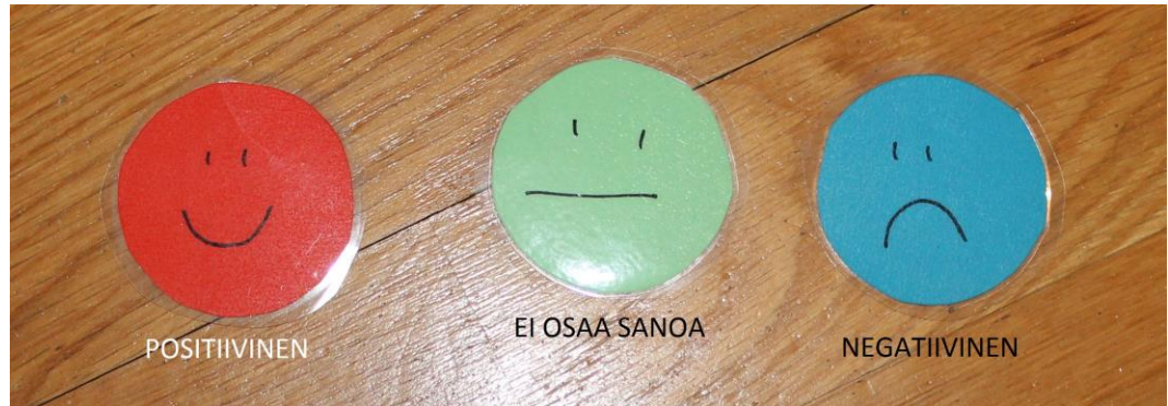
KUVA 5. Hymy naamat lasten palautetta varten