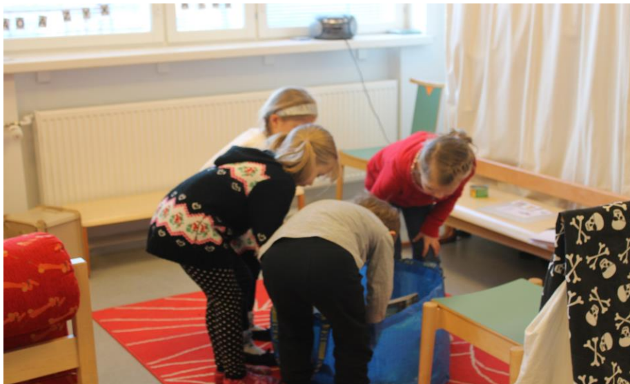
KUVA 3. Lapset lajittelemassa roskia

Jätteenvälttämisleikistä siirryimme lajittelemaan oikeita roskia, joita olin tuonut suuren kassillisen ryhmään (kuva 3). Lasten tehtävänä oli kuljettaa jätteet oikeille jättepisteille ja ongelmatilanteissa sai kysyä apua aikuiselta tai toiselta lapselta. Lapset suorastaan ryntäsivät kassin luokse, kun annoin heille luvan lähteä lajittelemaan roskia. Lapset tulivat rohkeasti kysymään apua, jos olivat epävarmoja roskan sijoituskohteesta. Kun jätteet oli lajiteltu, kävimme yhdessä roskakasat läpi ja mietimme, olivatko ne lajiteltu oikein. Vain muutama roska vaihtoi jäteastiaa ja pääsimme siirtymään seuraavaan puuhaan.