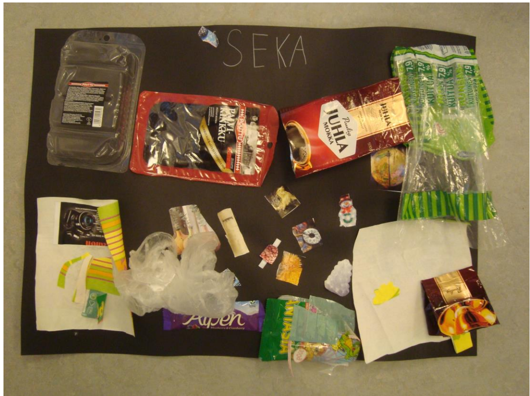
KUVA 5. Askartelun lopputulos

bioroskikseen. Samankaltaisella nimeämisellä leikki jatkui muutaman minuutin. Lapset olivat innokkaina mukana leikissä ja lapsille olikin pieni pettymys, kun oli aika lopettaa leikit. Viimeisen ohjeen mukaisesti lapset siirtyivät jälleen kokoontumispaikalle ja kiitin heitä hienosta osallistumisesta. Annoin heille myös mahdollisuuden antaa palautetta päivästä hymynaamojen avulla (kuva 5). Palautteesta kerron lisää luvussa 6.4.