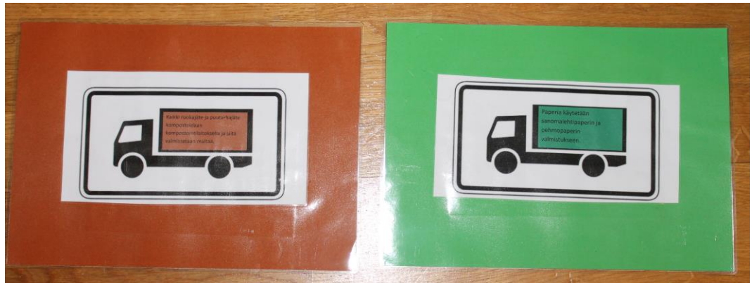
KUVA 1. Jätteenlajittelu tauluja edestä

(kuva 1), joiden lavalle oli kirjoitettu tietoa jätteiden loppusijoittumisesta. Taulujen taakse (kuva 2) olin koonnut tietoa sekä kuvia tietyn väriseen jäteautoon kuuluvista jätteistä. Tiedot tauluihin keräsin HSY:n sivuilta löytyvistä jätteenlajitteluoppaista (Kierrätys ja jätteiden lajittelu 2013). Jättekuvat ja jäteauton mallit on hankittu google kuvahauulla. Taulut käytetään hyväksi jätteenlajitteluoppaassa ja niitä voi käyttää hyväksi lasten kanssa myöhemminkin jätetasioista puhuttaessa.