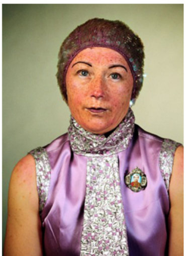
Cindy Shermanin monet kasvot.