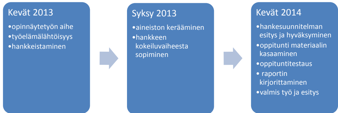
KUVIO 2. Opinnäytehankkeen aikataulu.