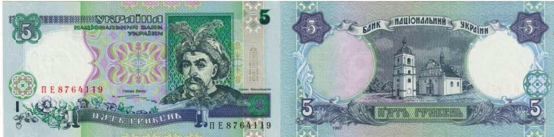
Kuva 5. 5 grivnan seteli mallia 1997. Tämä seteli on nykyisin vedetty pois kierrosta.

Vuonna 1997 painettiin erä 5 grivnan seteleitä vuosiluvulla 1997 ja ne laskettiin liikkeelle 1. syyskuuta 1998. Seteli on vuosilukua MILTEI identtinen mallin 1995 setelin (kuva 4) kanssa, mutta erojakin on; esimerkiksi turvanauha on leveämpi ja siinä on tekstiä sekä sarjanumeron kirjasintyyppi on erilainen.