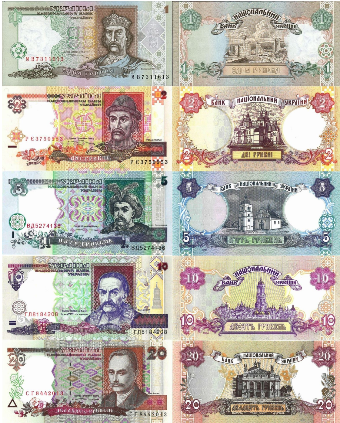
Kuva 4. 5 ja 10 grivnan setelit mallia 1994 sekä 1, 2 ja 20 grivnan setelit mallia 1995. Nämä setelit on nykyisin vedetty pois kierrosta.