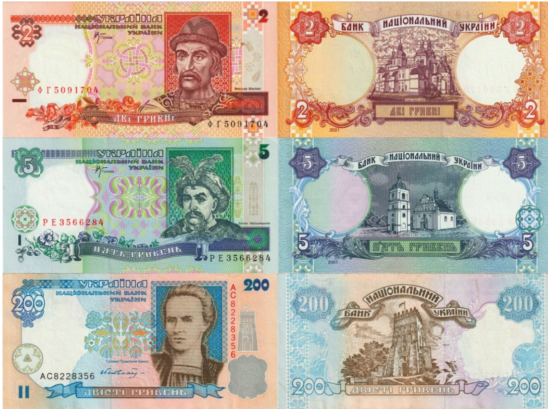
Kuva 7. 2, 5 ja 200 grivnan setelit mallia 2001. Nämä setelit on nykyisin vedetty pois kierrosta.