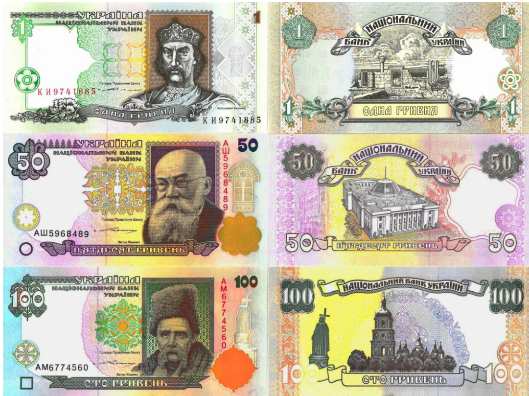
Kuva 3. 1 grivna mallia 1994 sekä 50 ja 100 grivnaa ilman vuosilukua. 1 grivnan setelit painettiin alkuvuonna 1994 ja 50 sekä 100 grivnan setelit vuonna 1992. Nämä setelit on nykyisin vedetty pois kierrosta.

Maaliskuussa 1994 aloitti toimintansa Ukrainan valtion rahapaja, jossa aloitettiin myös setelien painaminen yhteistyössä Thomas De La Rue'n kanssa. Uudet mallin 1994 5 ja 10 grivnan setelit painettiin vuonna 1994 ja 2 sekä 20 grivnan setelit painettiin vuonna 1995. Kaikkien seteleiden koko on 133 mm * 66 mm ja ne laskettiin liikkeelle 1. päivä syyskuuta 1997.