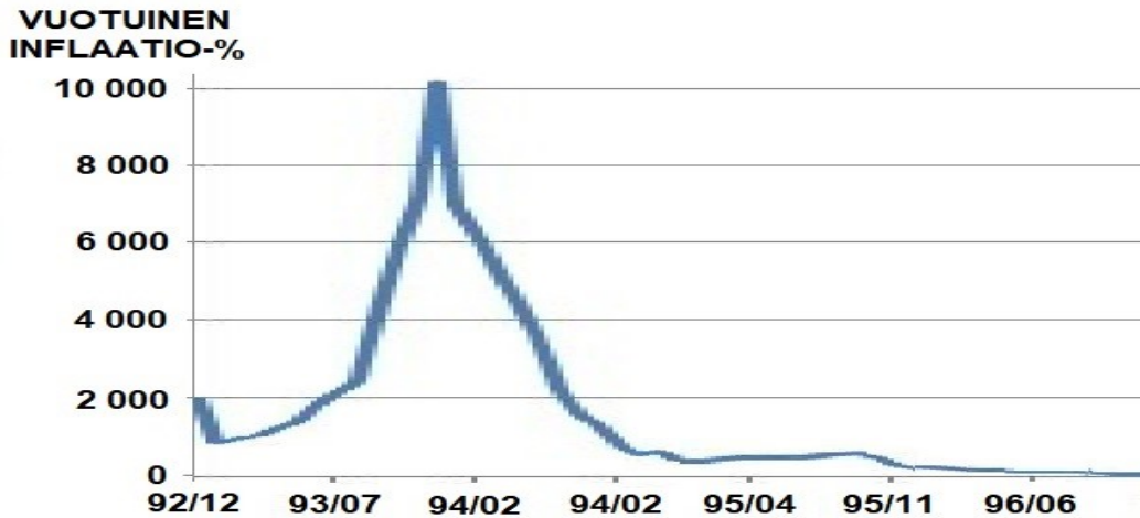
Kaavio 1. Ukrainan inflaatioprosentti 1992 – 1996.

Ukrainan vuosien 1991 – 1996 inflaatiokasvu on oppikirjaesimerkki monetaarisesta inflaatiosta, mikä on siis inflaatiota, joka johtuu suhteettoman suuresta rahan liikkeellelaskusta, jonka vuoksi hyödykkeiden määrään suhteutettu rahamäärä kasvaa voimakkaasti. Kehitystä kuvaa hyvin seuraava kaavio 1.