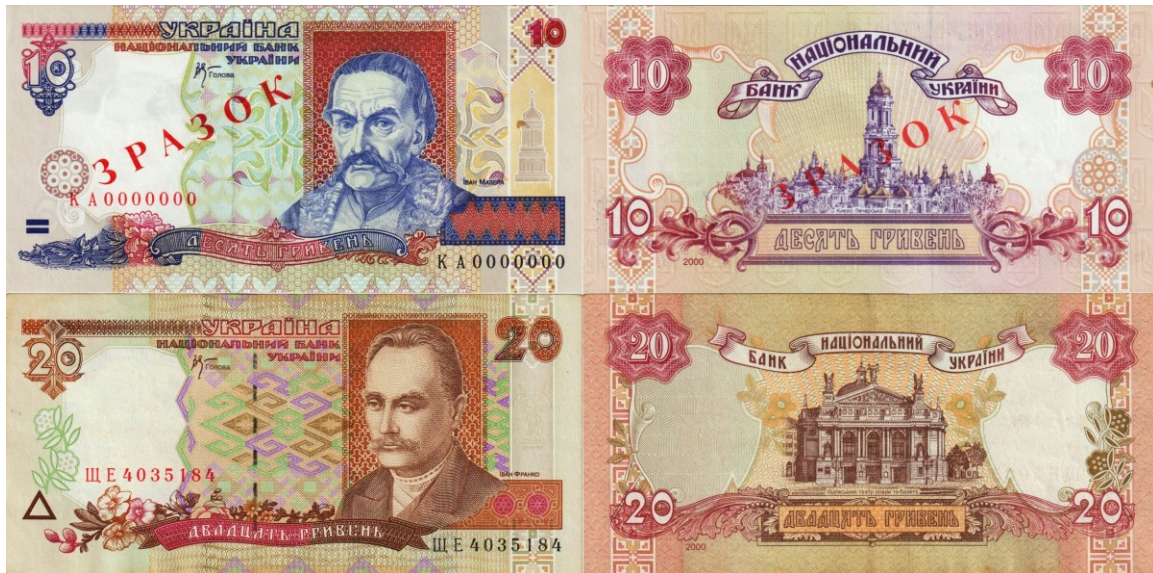
Kuva 6. 10 ja 20 grivnan setelit mallia 2000. Nämä setelit on nykyisin vedetty pois kierrosta.

Heti seuraavana vuonna 2001 tehtiin jälleen 2 ja 5 grivnan setelimalleihin pieniä muutoksia ja sarjaan lisättiin grivnan arvon heikkenemisen takia kokonaan uusi nimellisarvo 200 grivnaa. Kuriositeettina mainittakoon, että uuteen 200 grivnan seteliin ei ole merkitty painovuotta, kuten ei aiempiin mallin 1994 50 ja 100 grivnan seteleihinkään.