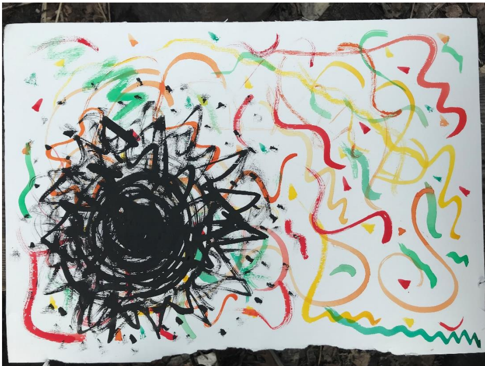
Kuva 4. Erään osallistujan akvarellimaalaus aiheesta "Muuttolintu"

Ohjaaja oli varannut mukaan akvarellimaalausvälineet, ja tehtävänä oli maalata aiheesta "muuttolintu". Maalaamisen jälkeen kirjoitettiin vielä samasta aiheesta lyhyt teksti vapaassa muodossa.