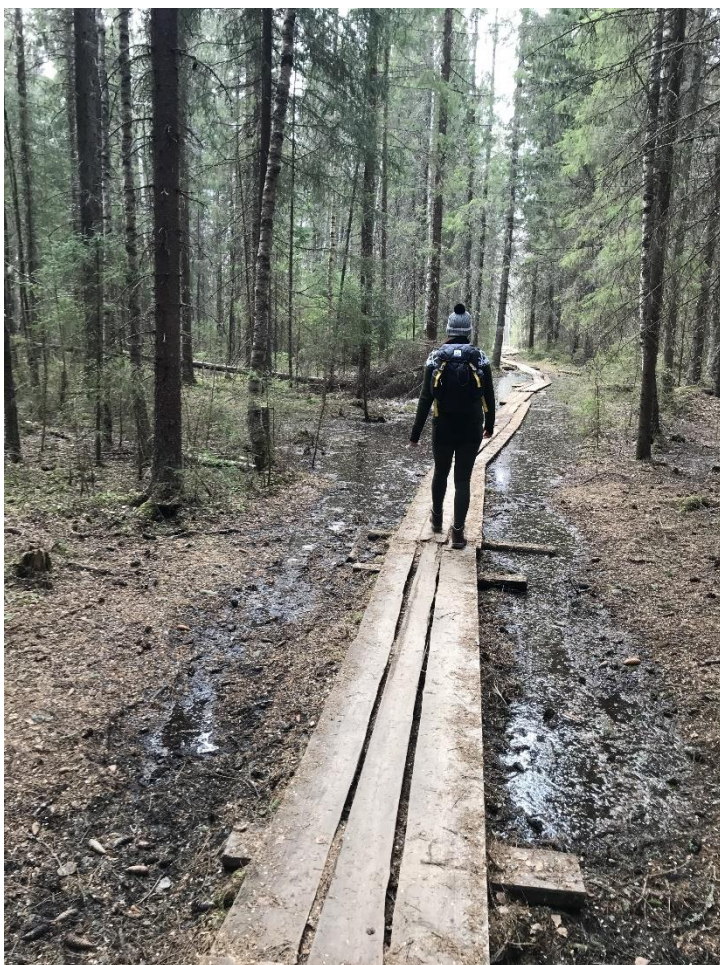
Kuva 3. Risö

Neljäs tapaaminen oli 5.5.2022 Vaasan Eteläisellä kaupunginselällä (vaasa.fi). Kävelimme Risön pitkospuureittiä Ryövärintarhan lintutornille. Osallistujia oli paikalla kolme, ja yksi heistä oli ottanut kiikarit ja kaukoputken mukaan. Aloitimme tarkkailemalla lintuja lintutornista. Alueella liikkui kolme merikotkaa, sekä monia muita lintulajeja.