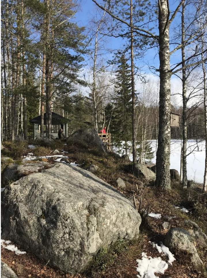
Kuva 2. Kråknäs

Tapaamiskerrasta annettiin seuraavanlaiset arvosanat: