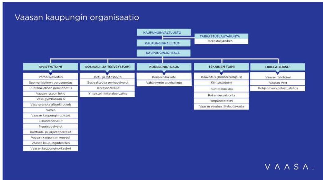
Taulukko 2. Vaasan kaupungin organisaatio

Kuten yllä olevasta organisaatiokaaviosta näkyy, sivistystoimi kattaa opetuksen aina varhaiskasvatuksesta toisen asteen koulutukseen, sekä kansalaisopiston. Myös liikunta- ja nuorisopalvelut, museot, teatteri ja orkesteri kuuluvat tämän toimen alle. Kulttuuri- ja kirjastopalveluilla on siis hyvät verkostot järjestää monialaista toimintaa yhteistyössä muiden toimijoiden kanssa. Toisaalta yhteistyö sujuu myös yli organisaatorajojen, mistä hyvänä esimerkkinä toimii vaikkapa Kaikukortti, joka mahdollistaa kulttuuriin osallistumisen varallisuudesta riippumatta. Vaasan Kaikukortin kulttuuri- ja liikuntakohteet on listattu kulttuuripalveluiden internet-sivuilla, mutta kaikukorttia jakaa sosiaali- ja terveystoimen alaisuuteen kuuluva sosiaalityö- ja perhepalvelut, sekä lisäksi jotkin järjestöt, kuten esimerkiksi Setlementtiyhdistys. Toinen rajapinnalla toimiva hanke on kulttuurinen vanhustyö, jota kulttuuripalvelut tuottaa yhdessä ikäihmisten eri palveluiden kanssa. (vaasa.fi)