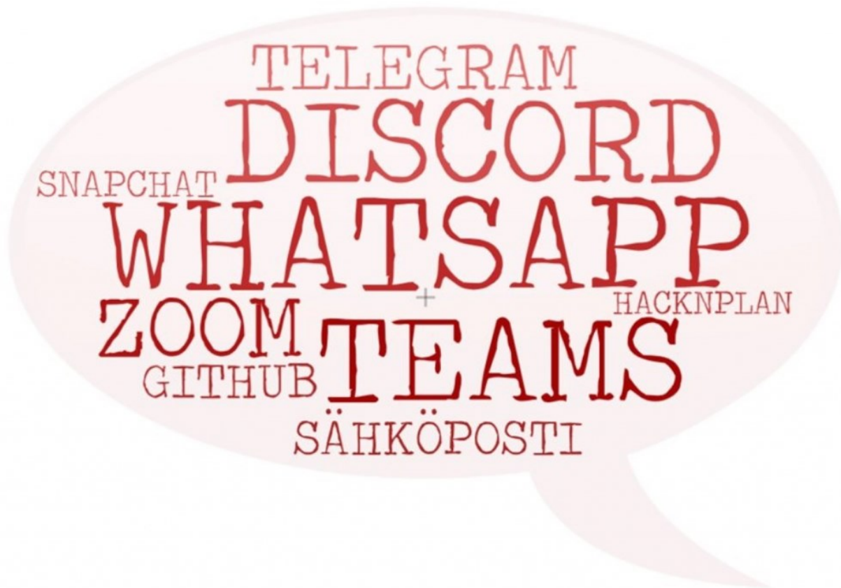
KUVIO 3. Yhteydenpidossa käytetyt sovellukset (kevään 2022 kysely).

Yhteydenpito on helppoa useiden tarjolla olevien sovellusten avulla. WhatsApp, Teams ja Discord olivat yleisimmät käytetyistä sovelluksista (kuvio 3). Jopa 80 prosenttia vastaajista kertoi saaneensa apua omalta ryhmältään opintoihin liittyvien tehtävien, esimerkiksi ohjelmointitehtävien, teossa.