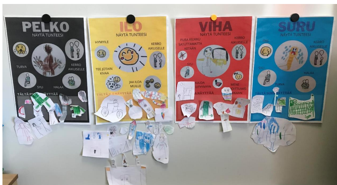
Kuva 6. Julisteet käytössä

Julisteeseen jätettiin tyhjää tilaa, jotta myös muut lapsiryhmät pystyvät hyödyntämään julisteiden käyttöä omassa arjessaan myöhemminkin. Julisteen yläosan on tarkoitus olla aina samanlainen ja alaosan tyhjä tila jää jokaisen lapsiryhmän itse hyödynnettäväksi. Lapsi piirtää kuvan, joka hänen mielestään kuvastaa esim. vihan tunnetta ja se kiinnitetään julisteeseen. Lasten itse tekemät kuvat julisteisiin auttavat heitä motivoitumaan tunteiden ilmaisemisen harjoitteluun ja julisteiden käyttämiseen.