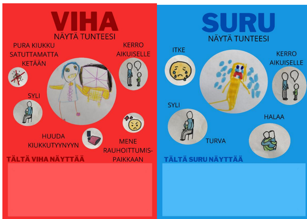
Kuva 4. Viha