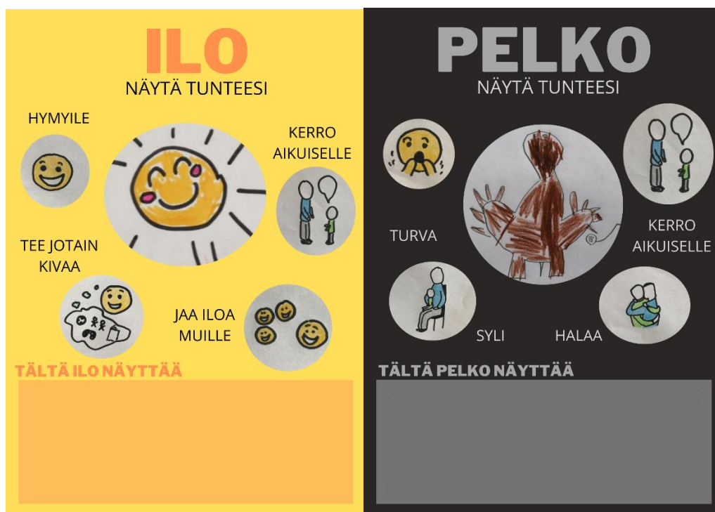
Kuva 2. Ilo

Lähetimme sähköpostilla kuvat valmiista julisteista varhaiskasvatuksen ryhmään ja heidän mielestään ne olivat juuri sellaiset kuin ajateltiin. He tulostivat julisteet siellä A3 kokoisiksi. Tuotosten valmistuttua pidimme ryhmälle tuokion, jossa esittelimme valmiit julisteet sekä kerroimme miten julisteita voi käyttää. Tuokiolla kävimme jokaisen julisteiden erikseen läpi siten, että lapset saivat kertoa ajatuksiaan julisteiden visuaalisesta ilmeestä ja työskentelystä. Keskustelimme tunteista ja siitä, miten niitä voidaan ilmaista hyödyntäen tunteijulisteita. Alla kuvat valmiista julisteista.