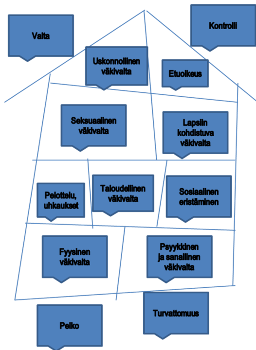
KUVIO 3. Turvaton talo – malli (Marttala 2011, 45)

Väkivaltaa kuvastaa turvaton talo (kuvio 3). Parisuhteen perusta on hiekkaa. Jokainen tietää, että hiekalle rakennettu talo ei ole turvallinen. Talo vajoaa, on vino ja hajoaa.