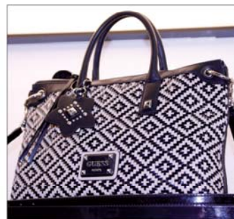
■ Mustavalkoisuus on yksi oma teemansa myös laukkumuodissa.

Laukun koko taas riippuu paljon käyttäjän tarpeesta, käyttötarjouksesta ja tilanteesta. Siinä missä toinen suosii näppärää pikkupussia, hehkuuttaa toinen ison aarrelaukkunsa perään.