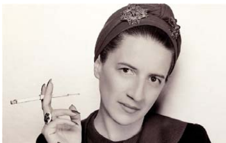
Kuva 1. Muotitoimittaja Diana Vreeland (Brown 2013)

Ranskalainen Diana Vreeland yhdisti muotia ja kirjoittamista 1930-luvulta lähtien. Tuon hänet esille, koska häntä kutsutaan maailman ensimmäiseksi muotitoimittajaksi. Hän loi loistokkaan uran aikamme tunnetuimmassa muotilehti-Vogueissa, joka yhä niittää mainettaan maailmalla. Vreeland työskenteli vuosina 1930–1960 Harper's Bazaarin muotitoimittajana (kuva 1). Tämän jälkeen hän työskenteli lähes kymmenen vuotta Vogueen, muodin raamatun, muotitoimittajana. Muotialasta tai kirjoittamisesta hänellä ei ollut kokemusta, mutta hänet löytänyt päätoimittaja Carmel Snow uskoi hänen kykyihinsä ja palkkasi hänet (Belverio, 2013).