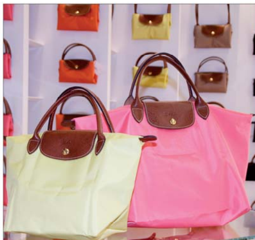
■ Rennomman tyyliiset ja värikkäät laukut näkyvät vahvasti kesän katukuvassa. Laukut Muutivaratalo Ratsulasta.

Pelkkä katseenkestävä laukku ei kuitenkaan riitä, sillä laukun pitää kestää myös me-