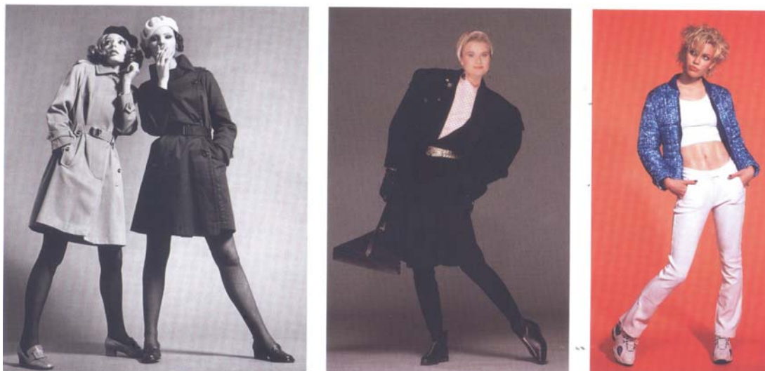
Kuva 5. Kuvassa vuosikymmeninen tunnetuimpia siluetteja. (Salo 2005)