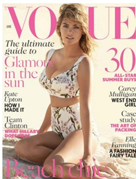
Kuva 3. Voguen kansi 2014 (Testino 2014)