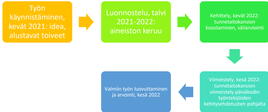
Kaavio 1. Tuotekehityksen eteneminen

Tuotekehittäminen alkoi työn käynnistämällä keväällä 2021. Päiväkoti Huiskilo esitti minulle idean tunnetaitokansiosta huhtikuussa 2021. Tässä vaiheessa keskustelimme alustavasti siitä, millainen tunnetaitokansion tulisi olla ja mitä sen tulisi sisältää. Päiväkoti Huiskilon toiveissa oli kansio, jossa olisi jo heiltä löytyviä tunnetaitomateriaaleja sekä uusia ideoita tunnetaitokasvatukseen. He toivoivat kansiota, jota he voisivat itse tulevaisuudessa kehittää ja johon heidän olisi helppo lisätä tunnetaitomateriaaleja.