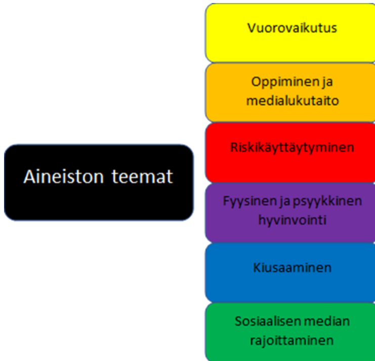
Kuva 2 Aineiston teemat.

esimerkiksi kommunikointiin muiden nuorten kanssa sekä ajanviettona. Lisäksi mainittiin yleisesti internetin erilaiset keskustelupalstat.