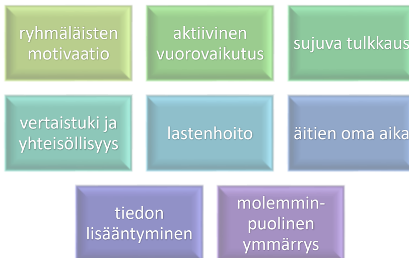
Kuva 2. Ryhmän vahvuudet

Ensimmäisellä rivillä ovat ryhmäläisten motivaatio, aktiivinen vuorovaikutus ja sujuva tulkkaus. Aineistosta kävi ilmi, että ryhmä on energinen ja keskusteleva. Osallistujat esittävät paljon kysymyksiä ja ovat kiinnostuneita suomalaisesta kulttuurista ja tavoista. Useissa vastauksissa kerrottiin ryhmän olevan aktiivinen ja että äidit toivat rohkeasti esiin ajatuksiaan ja uskalsivat esittää paljon kysymyksiä tapaamisen aikana. Vierailijat kokivat ryhmän äidit motivoituneina ja kiinnostuneina osallistumaan ja oppimaan suomalaisesta yhteiskunnasta.