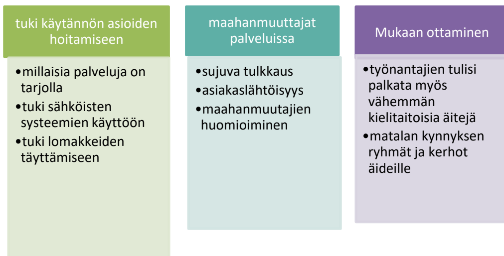
Kuva 4. Yhteiskunnan tuki äitien kotoutumiselle

Ensimmäisessä osiossa on otsikkona tuki käytännön asioiden hoitamiseen.