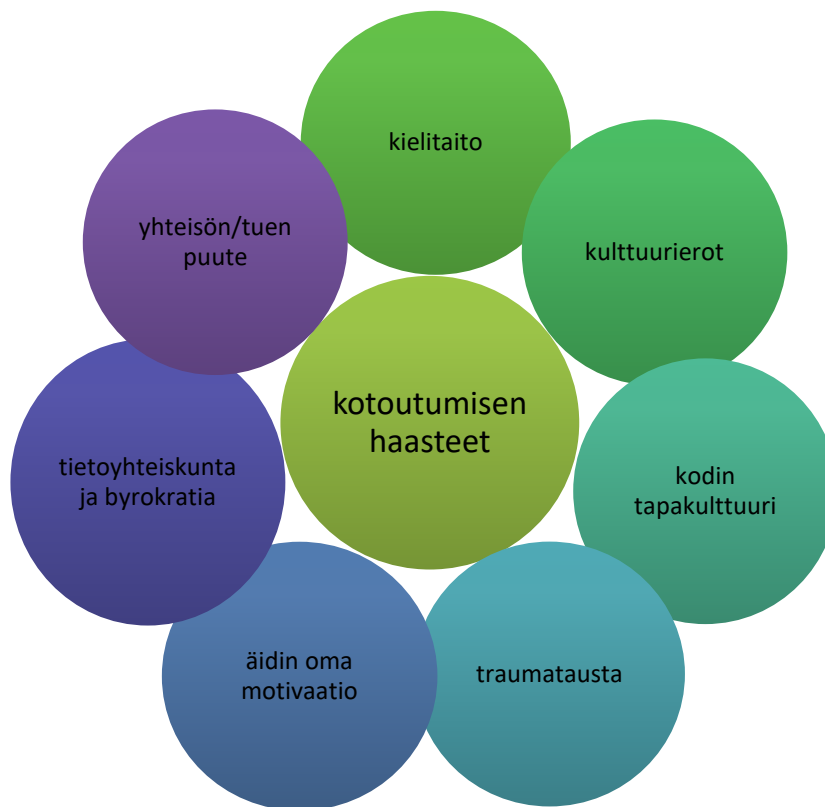
Kuva 1. Kotoutumisen haasteet

Aineistosta erottuu monia kotoutumista vaikeuttavia ja joskus estäviäkin asioita.