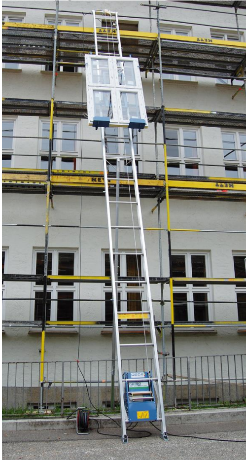
Kuva 6. GEDA Lift 250 Comfort -tikasnostin asennettuna telineeseen palvelemaan ikkuna-asennusta. [22].

koitettu ainoastaan materiaalin nostoon- ja siirtoon eikä niillä saa kuljettaa henkilöitä. Tikasnostinta ohjataan sen alku- tai loppupäässä sijaitsevasta kytkimestä. [14, s.160.]