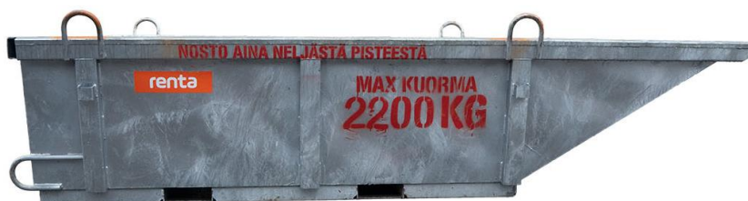
Kuva 7. Nostoastia, jota voidaan käyttää esim. torninosturissa siirtämään jätteitä roskalavoille [25].

Nostoapuvälineen rinnalla voidaan käyttää myös irrallisia nostotarvikkeita, joita on muun muassa kuorman kiinnittävää silmukkaruuvi tai -mutteri sekä sakkelit. [24, s.243.]