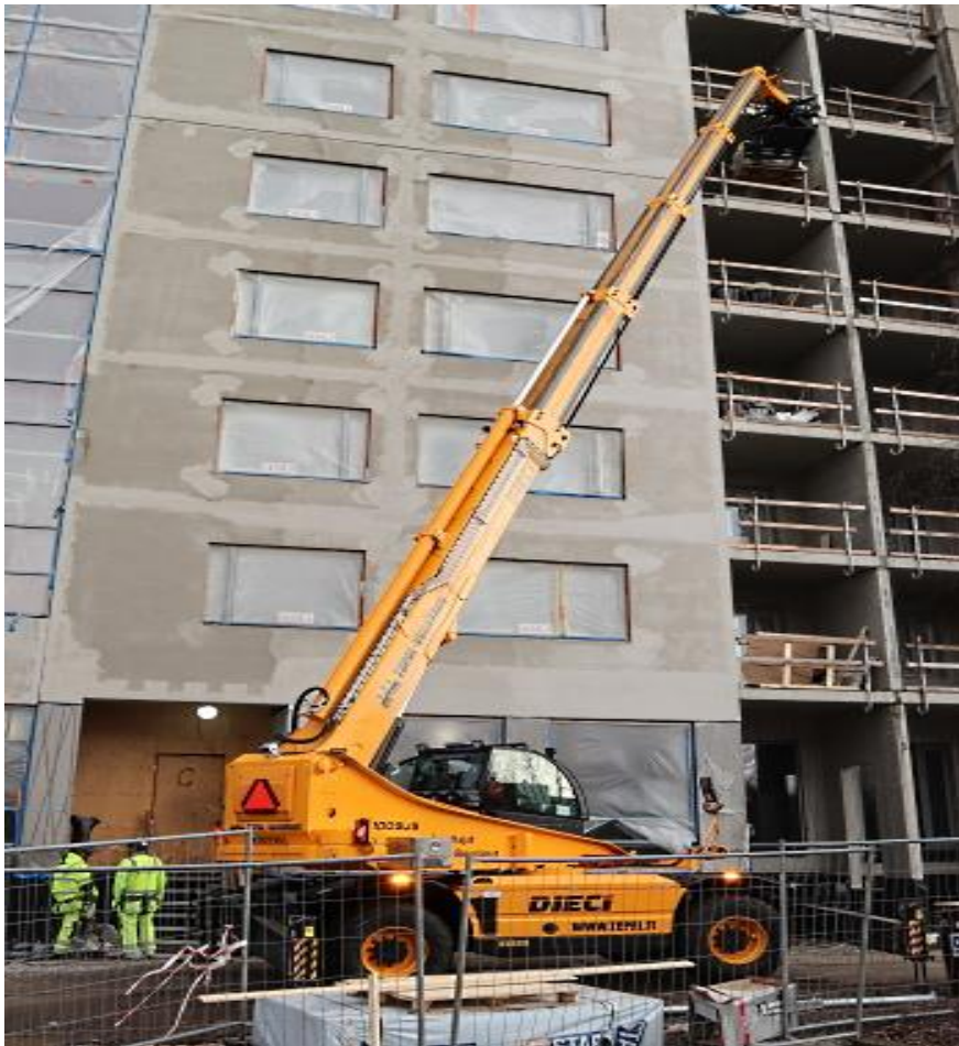
Kuva 4. Ympäripyörivä kurottaja Dieci Pegasus 45.30 työssään [15, kuva lehti- jutusta].