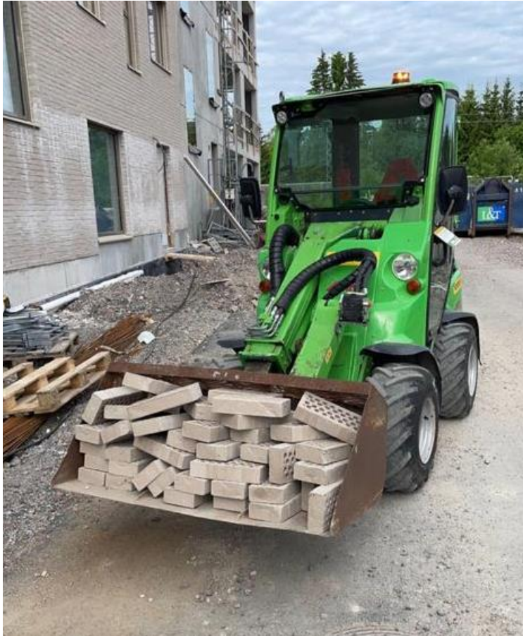
Kuva 5. Avant -pienkuormaaja raivaustyössä. [Kuvan ottanut Santtu Pönniö].

Pienkuormaajan koko, niiden määrä ja koneen suorituskyky pystytään arvioida ja määrittää perustus- ja sisätyövaiheen aikana siirrettävien materiaalien tyyppin ja määrän mukaan. [20, s. 9.]