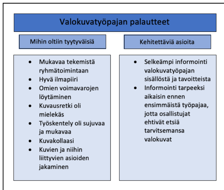
Kuvio 2: Palautekeskusteluiden tulokset

Palautteenannossa päädyttiin siihen, että palautekeskusteluita ei käydä kahden kesken osallistujien kanssa, vaan yhteisen palautekeskustelut ovat ryhmän yhteisiä keskusteluja. Palautteet kirjattiin ylös samalla, kun keskustelua käytiin osallistujien kanssa. Palautteita ei ole kirjattu yksilöidysti, vaan kaikki palautteet on kerätty yhteen koosteeksi.