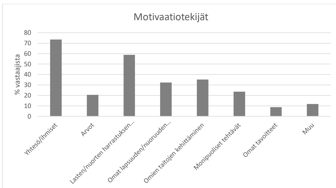
KUVIO 1. Motivaatiotekijät

Motivaatiotekijät jakoutuivat kaikkien kyselyyn vastanneiden kesken kuvio 1. mukaisesti. Kuviossa on kuvattu, kuinka suuri osa kaikista vastanneista valitsi kyseisen vaihtoehdon ja se on ilmaistu prosentteina. Selkeästi yhteisö/i ihmiset ja lasten/nuorten harrastuksen tukeminen ovat kaksi suosituinta vastausta. Yli 30 % vastaajista kokee, että omat lapsuuden ja nuoruuden kokemukset tai omien taitojen kehittäminen ovat motivaation taustalla. Arvot ja monipuoliset tekijät valitsi noin 20 % vastaajista, ja kaikista vähiten vastaajia motivoi partiotoiminnassa omat tavoitteet.