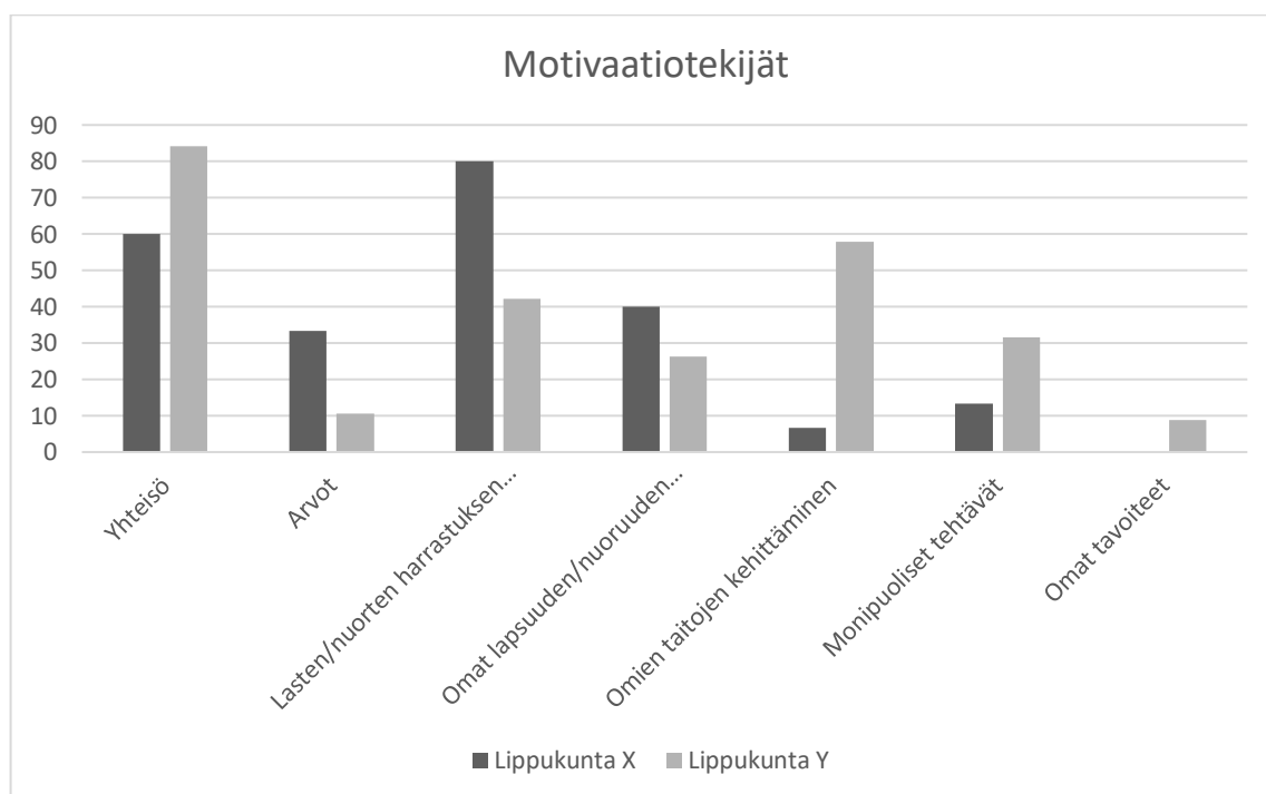
KUVIO 3. Motivaatiotekijät lippukunnittain

Vastauksia tutkittiin myös lippukuntakohtaisesti, jotta saataisiin tarkempaa tietoa molempien lippukuntien vapaaehtoisten motivaatiosta ja sen parantamisesta. Vaikka lippukunnat tekevät paljon yhteistä toimintaa, on heillä myös omia tapojaan ja kulttuuriaan, joilla on vaikutusta motivaatioon. Prosenttiosuudet ovat laskettu suhteessa kyseisen lippukunnan vastaajien määrään.