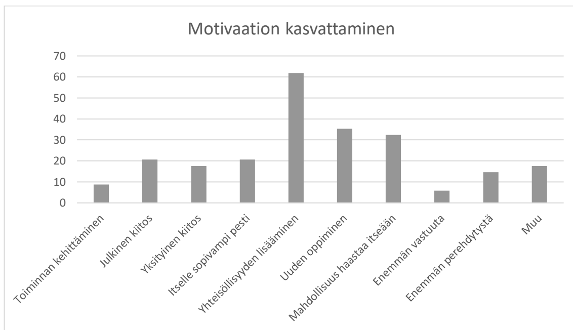
KUVIO 2. Motivaation kasvattaminen

Kyselyn toinen motivaatioon liittyvä kysymys oli, mitkä näistä auttaisivat vahvistamaan motivaatiotasi? (valitse 1–3 itselle sopivinta). Kyselyn vastaukset ovat havainnollistettu pylväsdiagrammeilla (Kuvio 2.).