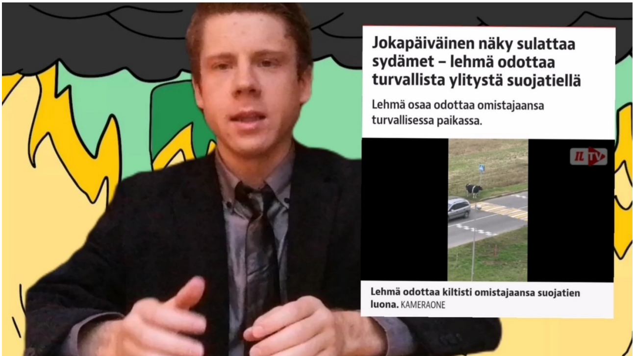
Kuva 6. Kuvakaappaus Maailmanlopun Uutisten pilottijaksosta (Maailmanlopun Uutiset).

Haastatteluista saatujen tietojen perusteella aloitin oman uutissatiirini, Maailmanlopun Uutisten teon. Satiirin pilottijaksolla oli Youtubessa 15. marraskuuta 55 näyttökertaa. Video kestää 4 minuuttia, 17 sekuntia ja sisältää yhdeksän vitsiä (Maailmanlopun Uutiset 7.11.2022a).