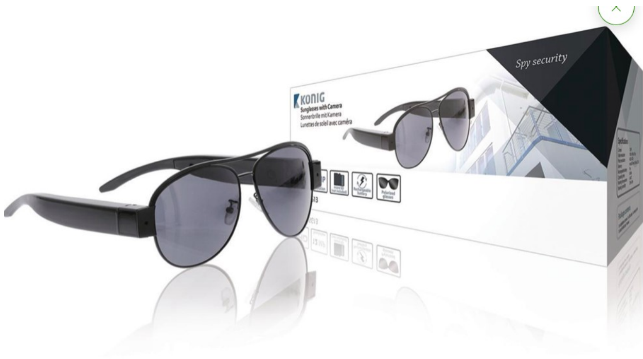
Kuva 4. Esimerkki piilokamerasta

ilmoittaessa puhelimeesi, kun liikettä tai ääntä havaitaan. Laitteessa on myös pimeänäkötila, joka mahdollistaa tapahtumien seuraamisen vuorokauden ajasta riippumatta. Reaaliaikaisen katsomisen lisäksi myös tallennehistorian katsominen on mahdollista. Valvontalaite on kehitetty tekemään kodin turvaamisesta vaivatonta ja helppoa. (Elisa Oyj 2022b.) Laitteen salaa asuntoon kätkemällä ja sitä väärinkäyttäen valvontakamera toimii digitaalisen väkivallan tekovälineenä.