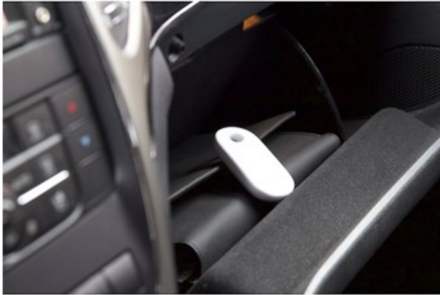
Kuva 3. GPS-paikannuslaite ajoneuvon hansikaslokerossa. Erilaisia GPS-paikantimia löytyy monta muutakin merkkiä ja mallia. Kuvassa yksi esimerkki.

GPS-paikannuslaitteita on suunniteltu ja kehitetty myös ihmisten (kuten vanhukset, pienet lapset) sekä esineiden (kuten avaimet) paikantamiseen. Paikanninlaitteet ovat hyvin pienikokoisia, joten ne on helppo kätkeä esimerkiksi autoon tai käsilaukuun. Paikantimen ansiosta toisen henkilön liikkeiden seuraaminen sekä reaaliaikaisesti että takautuvasti onnistuu vaivatta puhelimeen ladatun sovelluksen kautta. (Hakkarainen 2019, 110.) Kuvassa 3 olevassa Yepzon One 2.0 paikanninlaitteessa mainostetaan olevan pitkä akunkesto, korostetaan sen luotettavuutta ja helppokäyttöisyyttä sekä sijainnin tarkkuutta. Paikannin toimii maailmanlaajuisesti GSM-verkon kattamalla alueella. Laite on painikkeeton, joten sitä ei pysty sammuttamaan. Näin se antaa koko ajan sijaintitietoja matkapuhelimeen asennettuun sovellukseen. (Clas Ohlson 2022.)