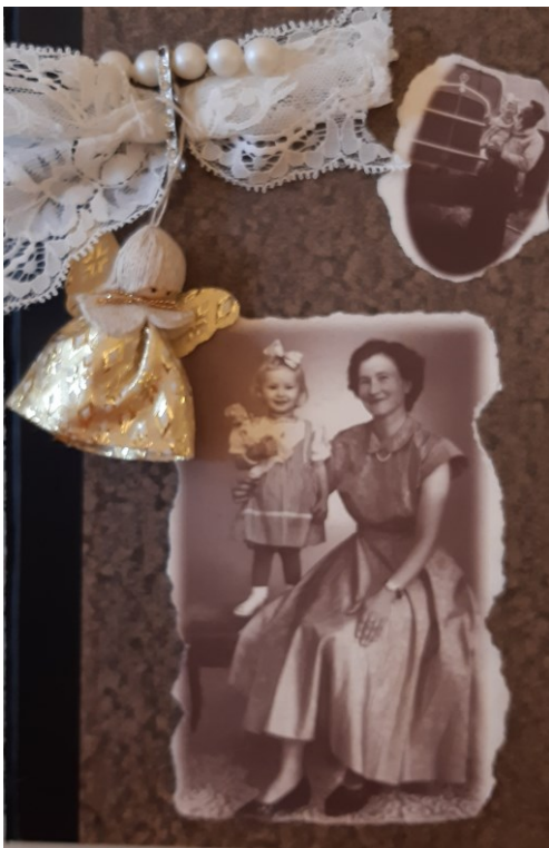
Kuva 1. Elämäntarinan tutuksi -ryhmän osallistujan elämäntarinaa kuvattuna kirjankansitaidena.

Kuvataiteellisia menetelmiä ovat esimerkiksi piirtäminen, maalaaminen, muovailu ja rakentelu tai ohjattu kuvien katselu. Kuvat herättävät keskustelua ja niihin voi peilata omia muistoja, kokemuksia, toiveita ja odotuksia. Kuvataiteelliset menetelmät ovat helposti lähestyttäviä. Ne voidaan nähdä jatkeena sille, että ihmiset tekevät päivittäin visuaalisia valintoja omien mieltymystensä perusteella esimerkiksi ottaessaan valokuvia tai järjestellessään kotiaan. Tärkeämpää kuin itse lopputulos on tekemisen prosessi. (Iivanainen 2019, 57–59.) Värit ja muodot voivat herättää iloa, haikeutta, levottomuutta tai uteliaisuutta. Kuvien avulla voi ilmaista asioita, joiden sanallistaminen on vaikeaa. (Iivanainen 2019, 62–63.) Myös esineiden avulla voi muistella omaa elämäntarinaansa ja jakaa yhteisiä sukupolvikokemuksia (Hohenthal-Antin 2009, 52). Muistorasioihin voi kerätä muisteltavan henkilön elämään liittyviä esineitä (Liikanen 2007, 80). Valokuvista ja pienistä esineistä voi myös tehdä esimerkiksi kirjankansitaidetta (kuva 1).