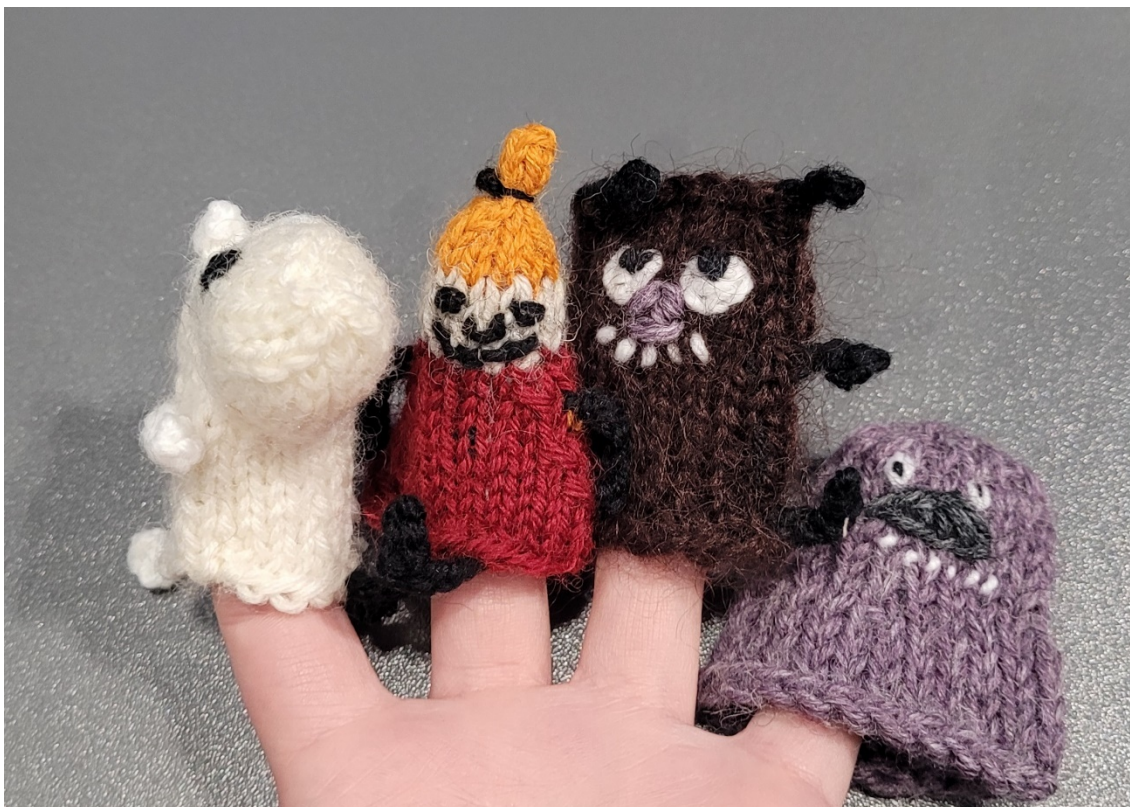
Kuva 1. Muumi-sorminuket (Heini Kallio).

Lapsi jaksaa keskittyä paremmin itse viulunsoittoon, kun tehdään muutakin kuin varsinaisia soittoharjoituksia. Aiemmin mainittu kivien poiminta on tehokas keino opettaa viulukäden sormien yksilöllistä toimintaa. Esimerkiksi tällä tavalla soittotunteihin saa lisää vaihtelevaa tekemistä niihin hetkiin, kun pidetään taukoa soittamisesta.