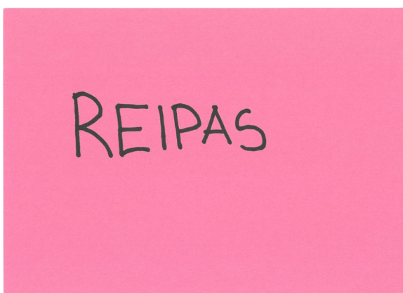
Kuva 3. Improvisaatiokortit: keltainen rytmikortti ja vaaleanpunainen sanakortti (Emilia Sohlberg).

Rytmikortit kattavat tasajakoiset rytmit kokonuotista (2/2) kuudestoistaosanuottiin (1/16). Rytmikortteja asetetaan nuottitelineelle riviin ja oppilas voi improvisoida niistä rytmisekvenssejä niin kehorytmein kuin instrumentin kanssa.