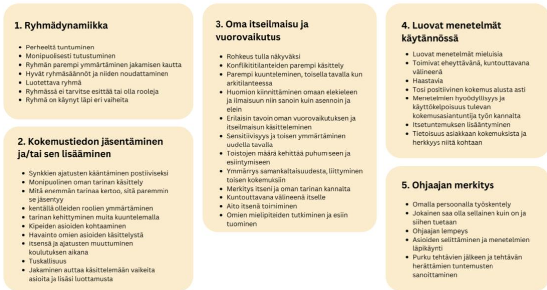
Taulukko 2: Haastattelujen teemat

Käydessäni läpi aineistoa rakentui se luontevasti haastattelurungossani esittämien teemojen alle. Käsittelin aineistoa siirtämällä haastatteluissa nostetut aiheet eri pääkategorioihin, jonka jälkeen ne muodostivat aiheista kaavamaisesti esiin teemahaastattelurunkoni teemat sekä lisänä yhtenä teemana muodostui ohjaajan merkitys. Teemoittelu jakaantui näin viiteen teemaan ryhmädynamiikka, kokemustiedon jäsentäminen ja/tai sen lisääminen, oma itseilmaisu ja vuorovaikutus, luovat menetelmät käytännössä ja ohjaajan merkitys.