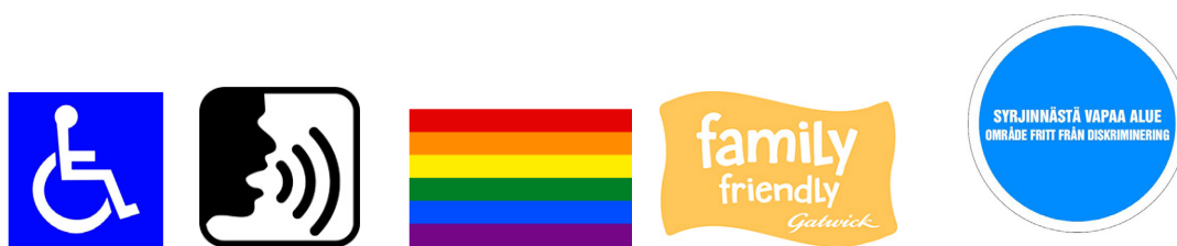
Kuva 1: Kansainvälisesti hyväksytty yleinen ISA-esteettömyysmerkki, kuvailutulkkauksen symboli, seksuaali- ja sukupuolivähemmistöjä huomioivat sateenkaarilippu, perhemyönteisyyden symboli sekä syrjinnän vastaisuudesta kertova symboli (Kulttuuria kaikille -palvelu 2022b; Alatalo 2019, 21; Gatwick Airport 2022; Oikeusministeriö 2022).

Tasa-arvon ja yhdenvertaisuuden aktiivinen ja näkyvä edistäminen näkyy useimmiten tapahtumaympäristössä. Hyvän vastuullisen toiminnan ansiosta tapahtumassa sekä työskentelee että vierailee taustaltaan erilaisia, eri-ikäisiä ja -näköisiä sekä eri väestöryhmistä ihmisiä. Tällöin tapahtumasta on tehty turvallinen ja tasa-arvoinen paikka kaikille, ja siitä viestitään selkeästi esimerkiksi sateenkaarilipulla, saavutettavuuteen liittyvillä symboleilla, merkillä syrjinnän vastaisesta alueesta tai lapsi- tai perhemyönteisyyteen liittyvällä elementillä, joita on havainnollistettu kuvassa 1. Tapahtuman vastuullisuudesta viestii vahvasti myös, mikäli henkilökunnalle ja asiakkaille on laadittu ja asetettu selkeästi näkyville toimintaohjeet, joilla puututaan sopimattomaan käytökseen, esimerkiksi seksuaalisen häirintään, rasismiin tai homofobiseen käytökseen, ja raportoidaan siitä. (Visit Tampere 2022a.)