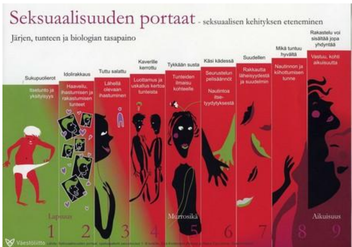
Kuva 1. Seksuaalisuuden portaat (Väestöliitto 2009c)

Nuoren seksuaalinen kehitys tapahtuu vaiheittain. Seksuaalisuuden portaat -mallin (Kuva 1.) avulla voidaan löytää jokaisen nuoren oma seksuaalisen kehityksen vaihe ja eteneminen. Seksuaalisuuden portaat, seksuaalisen kehityksen vaiheet -mallin ovat luoneet kättilö, terveydenhoitaja Erja Korteniemi-Poikela ja lastenpsykiatri Raisa Cacciatore. Seksuaalisuuden portaat -mallin avulla vahvistetaan nuoren oman seksuaalisuuden ymmärtämistä ja hallintaa. (Aho ym. 2008, 18.)