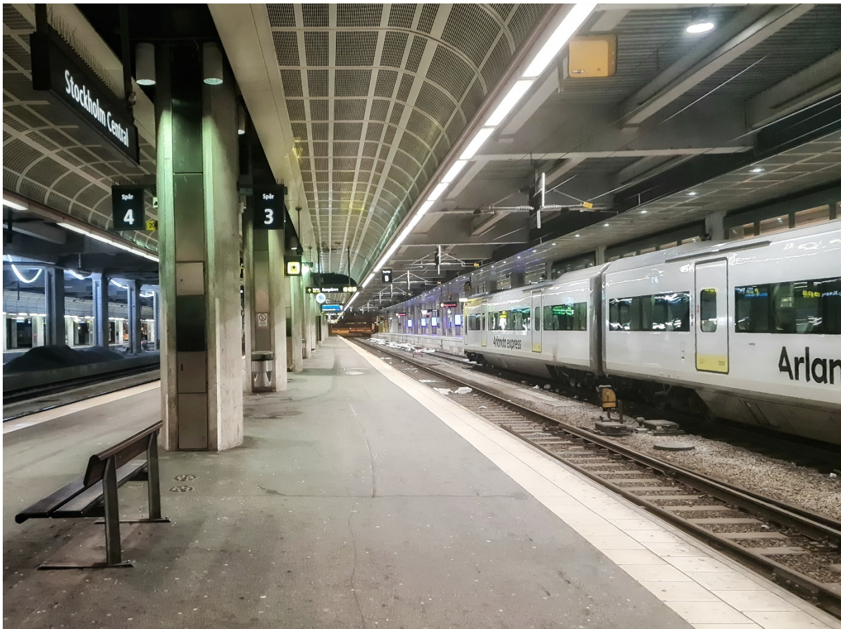
Kuva 3. Tukholman päärautatieasemalle on junayhteys Haaparannalta (Keränen 2022.)

Haaparannan ja Luulajan välisen rautatieyhteyden avautuminen henkilöliikenteelle vuonna 2021 (P4 Norrbotten 2021) mahdollistaa jo nyt merilappilaisille helpomman ja vähähiilisemmän tavan vieraillla Ruotsin puolen lähikaupungeissa tai vaikka Tukholmassa saakka (Kuva 3). Laurila-Tornio-Haaparanta -radan sähköistyksen ja muutostöiden myötä rataverkosto täydentyy ja avaa maat yhdistävän raideyhteyden. Raideyhteyden myötä Suomen huoltovarmuus paranee ja uusia mahdollisuuksia tarjoutuu niin teollisuuden kuljetuksille kuin henkilöliikenteellekin – erityisesti ilmastoahdistusta poteville, mutta matkustuksesta nauttiville yksilöille. (Rantamartti 2021.)