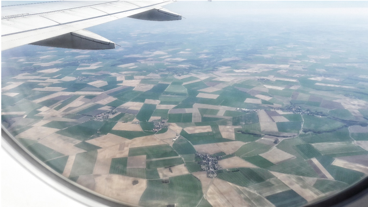
Kuva 2. Lintuperspektiivistä kuvattuja kuvia ei salaa lentävän some-tililtä löydy (Keränen 2015.)

Länsinaapurin ylpeily junamatkailullaan ole täysin perusteetonta myöskään silloin, kun tarkastellaan Ruotsin ainutlaatuista ja resurssiviisasta mallia joukkoliikenteen järjestämisessä. Ruotsissa toimiva Samtrafiken on kaikkien alueellisten joukkoliikenneviranomaisten sekä useimpien kaupallista liikennettä harjoittavien yhteisöomistama yhtiö, jonka tavoitteena on kehittää ja tarjota palveluita joukkoliikenteen tieto- ja lippuratkaisuissa hyödyttäen samalla niin liikenteenharjoittajia kuin matkustajiaakin (Samtrafiken 2020a). Joukkoliikenneoperaattorien yhteistyö näyttäytyy matkustajille matkustamisen sujuvuutena ja turvallisuutena erityisesti Resplus -lippujen avulla. Resplus-lippu sisältää kaikki matkakohteeseen pääsemiseen tarvittavat matkat ja kulkuvälineet, oli kyseessä sitten kauko- tai lähijuna, bussi tai lautta, riippumatta operaattorista. Miltei kaikki ruotsalaiset kuljetusyrietykset ovat mukana Resplus-kumppanuudessa, jolloin matkustajan ei tarvitse käyttää aikaansa ostaakseen erillisiä lippuja eri kuljetusyhtiöiden kautta. Yrietykset myös takaavat yhdessä, että matkustaja pääsee perille kohteeseen, vaikka liikenteessä esiintyisi häiriöitä. (Samtrafiken 2020b.) Yhteistyössä alan toimijoiden kesken toteutettu julkinen liikenne on loistava esimerkki resurssiviisaudesta ja myös hyväksi ympäristölle jo resurssitehokkuutensa ansiosta.