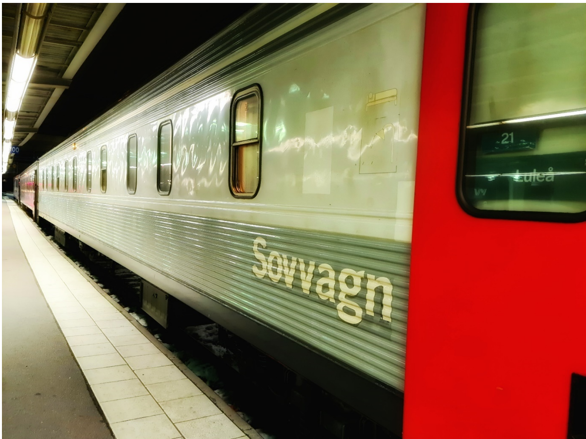
Kuva 1. Makuuvaunussa matka taittuu nukkuessa (Keränen 2022.)

Kaikilla matkustusmuodoilla on hyvät ja huonot puolensa ja kenties huomattavin erottava tekijä matkustusmuotojen välillä on matkustukseen kuluva aika. Henkilöautolla kuljettaessa reittinsä ja aikataulunsa saa valita vapaammin, mutta vähintään kuljettajan on pysyttävä hereillä ja keskittymiskykyisenä koko matkan ajan. Linja-autolla kohteeseen pääsee usein yhtä nopeasti kuin henkilöautolla ilman ajamisen vaivaa, mutta matkalla ei todennäköisesti voi pysähtyä syömään suosikkiruokaansa matkan varrelle sattuvaan ravintolaan. Lentokoneella matka taittuu nopeimmin, mutta jo kentälle pääsy edellyttää usein jonkin verran matkustamista ja lentokentällä on oltava hyvissä ajoin odottamassa. Junalla matkustettaessa matkalla on usein tilaa ja mahdollisuuksia tehdä muita asioita (Kuva 1), mutta matka-aika on huomattavasti pidempi kuin lentokoneella matkustettaessa.