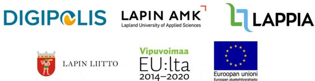
Kuva 4. LTKT2.0-hankkeen toteuttajat ja rahoittajat

Artikkeli on laadittu osana LTKT2.0 – Lapin teollinen kiertotalous 2.0 – Lapin kiertotaloustoiminnan vahvistaminen -hanketta, jonka tavoitteena on vahvistaa Lapin alueen bio- ja kiertotaloustoimintaa määrällisesti sekä laadullisesti. Hanketta toteutetaan yhteistyössä Lapin ammattikorkeakoulun, Kemin Digipolis Oy:n sekä Kemi-Tornionlaakson koulutuskuntayhtymä Lappian kanssa. LTKT2.0 on saanut rahoituksen Lapin Liitolta, Vipuvoimaa EU:lta ja Euroopan aluekehitysrahastolta (Kuva 4). Hanke on käynnistynyt 1.6.2020 ja jatkuu 31.8.2023 saakka. (Lapin ammattikorkeakoulu 2022.)