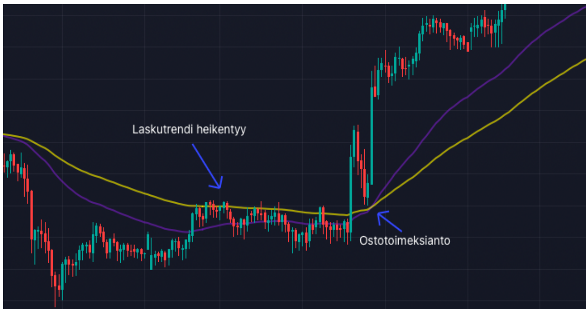
Kuva 19 Kulta 15 min Kynttilägraafi (Tradingview)

Kuvassa 19 on Kullan 15 min kurssigraafi. Graafille olen asettanut kaksi liukuvaa keskiarvoa EMA 50 ja EMA 100. Treidit tehdään aina isomman kuvan trendin suuntaan. Kuvasta nähdään hinnan ollessa pienessä laskutrendissä, joka heikentyy ja vähitellen kääntyy nousuun. Toimeksiannon voi toteuttaa, kun lyhyempi EMA 50 leikkaa ja ylittää pidemmän EMA 100:sen. Sama voidaan toteuttaa short-toimeksiannona, mikäli hinta pidemmän aikavälin mukaan laskutrendissä ja kuoleman risti kuvio muodostuu 5 tai 15 min kynttilägraafilla.