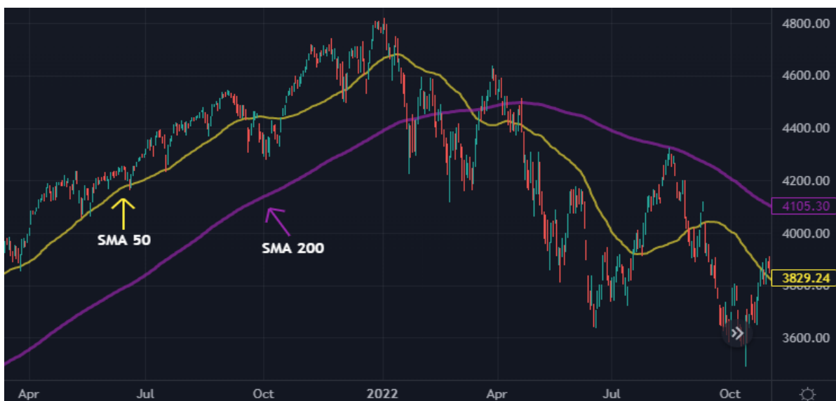
Kuva 16 S&P500 ja SMA 50&200 (Tradingview)

Yksinkertainen liukuva keskiarvo eli SMA- indikaattori kuvaa arvopaperin keskiarvoa sen valitulta ajalta, kuten esimerkiksi 50 päivältä. Keskiarvo lasketaan edellisiltä 50 päivältä sekä siirretään päivittäin aina eteenpäin ja keskiarvo lasketaan uudestaan. Yksinkertaista liukuvaa keskiarvoa käytetään yleensä pidempien aikavälien tarkasteluun ja yleisimpiä aikavälejä on 50, 100 ja 200. (Nordnet Suomi 2018b, 3:30–4.30 min.)