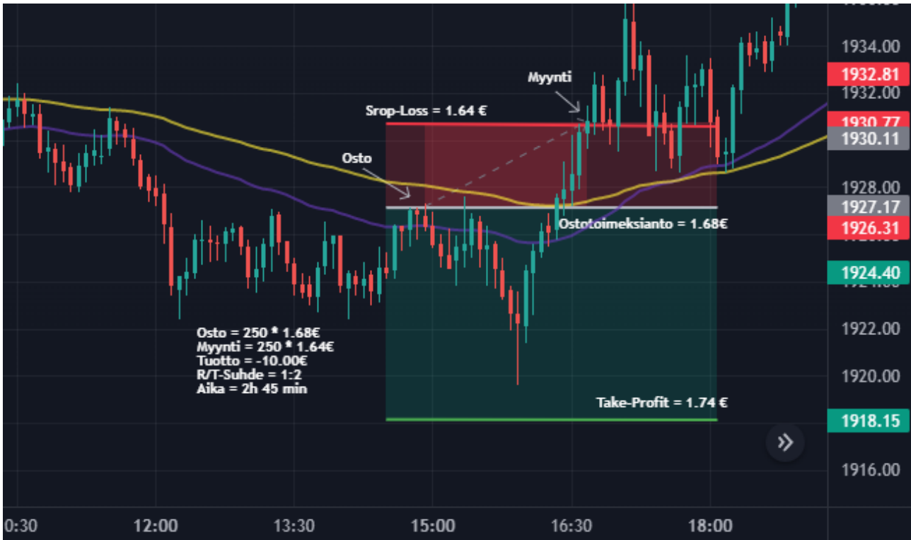
Kuva 30 Kulta 5 min Kynttilägraafi (Tradingview)

Kuvassa 29 on öljyn 15 minuutin kynttilägraafi. Öljyn muutaman viikon nousutrendi kääntyi takaisin laskuun ja näkemys oli shorttina. Graafilta nähdään, että hinta on muutaman kerran käynyt lähellä lyhyempää EMA 50:stä ja suunnittelin ostotoimeksiannon toteutuvan hieman ennen EMA 50:sta. Ajoitus onnistui loistavasti ja toimeksianto toteutui ennen kello 10. Ei mennyt kuin 45 minuuttia ja hinta olikin jo saavuttanut asettamani take-profit tason. tuottoa kertyi 20 € ja treidin riski/tuotto-suhde oli 1:2. Toimeksiannon suunnittelu onnistui loistavasti ja treidi itsessään meni juuri niin kuin ajattelinkin.