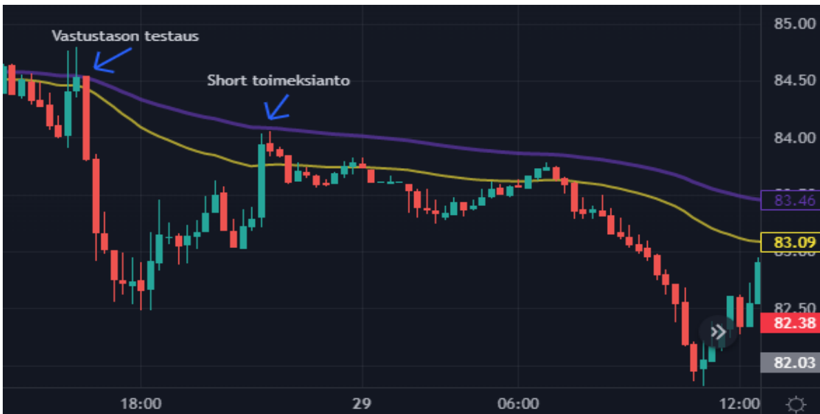
Kuva 18 Öljy 15 min kynttilägraafi (Tradingview)

Kuvassa 18 on öljyn 15 min kurssigraafi. Graafille olen asettanut kaksi liukuvaa keskiarvoa EMA 50 ja EMA 100. Päivän alussa selvitan trendin suunnan ja toimeksiannot tehdään trendin mukaisesti. Toimeksiannon voin toteuttaa, kun tuki- tai vastustason on testattu toimivaksi. Kuvasta nähdään, että ensimmäinen kosketus saadaan EMA 100, josta hinta lähtee vahvaan laskuun. Tämä on signaali siitä, että vastustaso toimii ja seuraavalla kerralla mikäli hinta lähestyy vastustasoa voin short toimeksiannon toteuttaa. Sama voidaan toteuttaa päinvastoin Long positiona, mikäli ollaan nousutrendissä ja vastaavasti tukitaso sääntö toteutuu. Toimeksiannot ajoitan ja toteutan 5 tai 15 minuutin kynttilägraafilta.