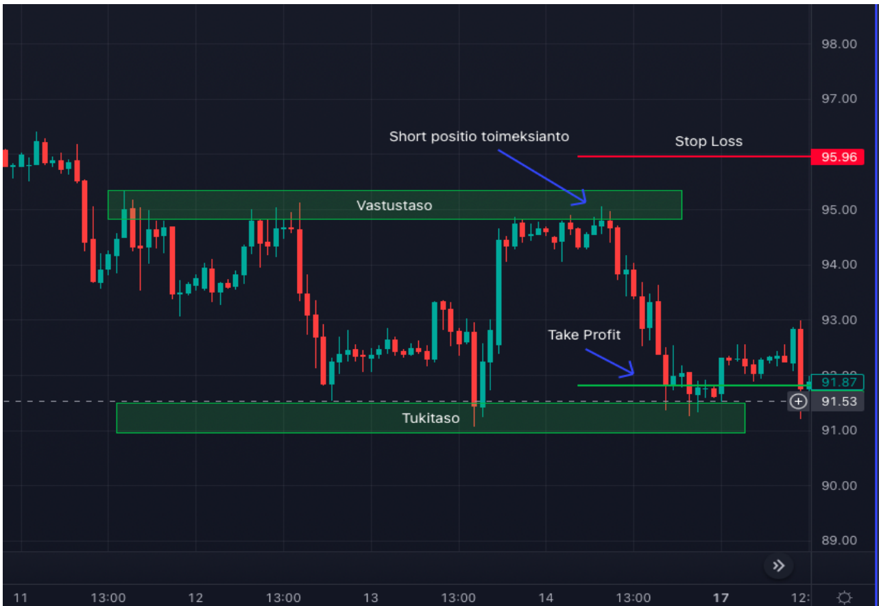
Kuva 11 Öljyn 4h kynttilägraafi tuki- ja vastustasoilla (Tradingview)

Tuki- ja vastustasot ei ole tarkkaa tiedettä ja hinta ei aina pysähdy asetetulle tuki- tai vastustaso viivalle. On ymmärrettävä, että näiden tasojen tulkinnessa tarvitaan hieman joustavuutta ja siksi niitä kutsutaankin joskus vyöhykkeiksi. Kuva 11 on hyvä esimerkki siitä, että tuki- ja vastustason määritelmä voi olla jokin vyöhyke. (Murphy 2021)