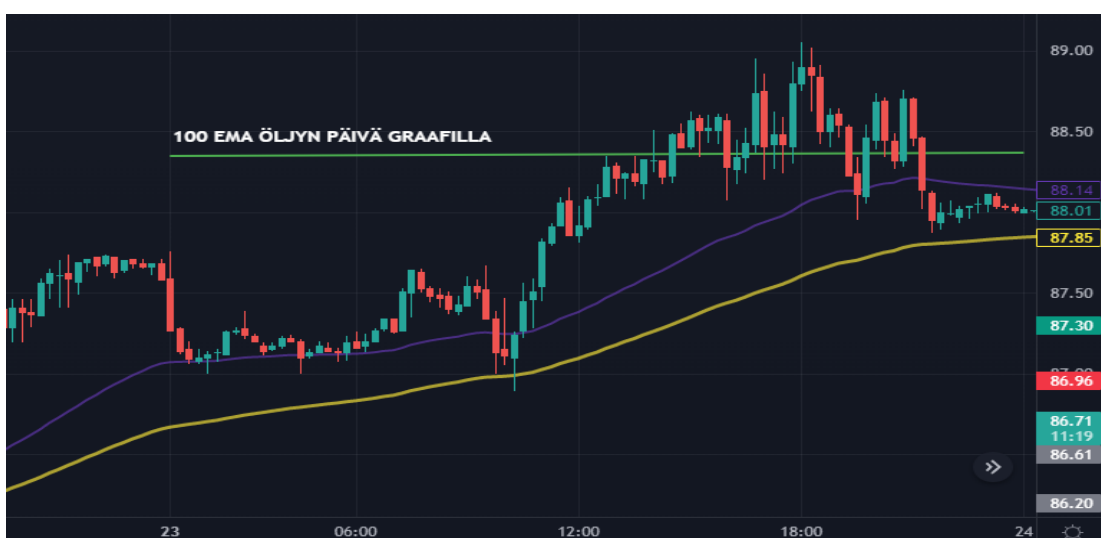
Kuva 25 Öljyn 15 min Kynttilägraafi (Tradingview)

markkinan avauduttua. Mahdollisuus olisi ollut kultainen risti kuvion avulla tehdä toimeksianto kello 12 aikaan, mutta hinnan liikuttua liukuvien keskiarvojen molemmin puolin en halunnut toimeksiantoa tehdä. Samasta kuvasta nähdään myös oikealla puolella öljyn 15 min kynttilägraafi, jonka hinta liikkeet olivat myös USA:n markkinan avaukseen asti hieman vaisuja. 1 treidauspäivän onnistuneen treidin jälkeen hinta lähti jyrkkään laskuun ja torstain aikana se nousi hiljalleen takaisin nousutrendiin liukuvien keskiarvojen päälle. Mahdollisuus oli myös tehdä öljyn kanssa kultainen risti kuvion avulla toimeksianto noin klo 19 aikaan, mutta koska Nordnet Markets tuotteiden aukioloaika on 9.15–21.00, niin koin ettei aikaa ollut enää tarpeeksi ja tämän takia jättyädyin treidistä pois. Maanantai 23.1 oli kullan osalta hyvin samanlainen kuin torstaina ja hinta liikkui sivuttain eikä hyviä ostopaikkoja löytynyt.