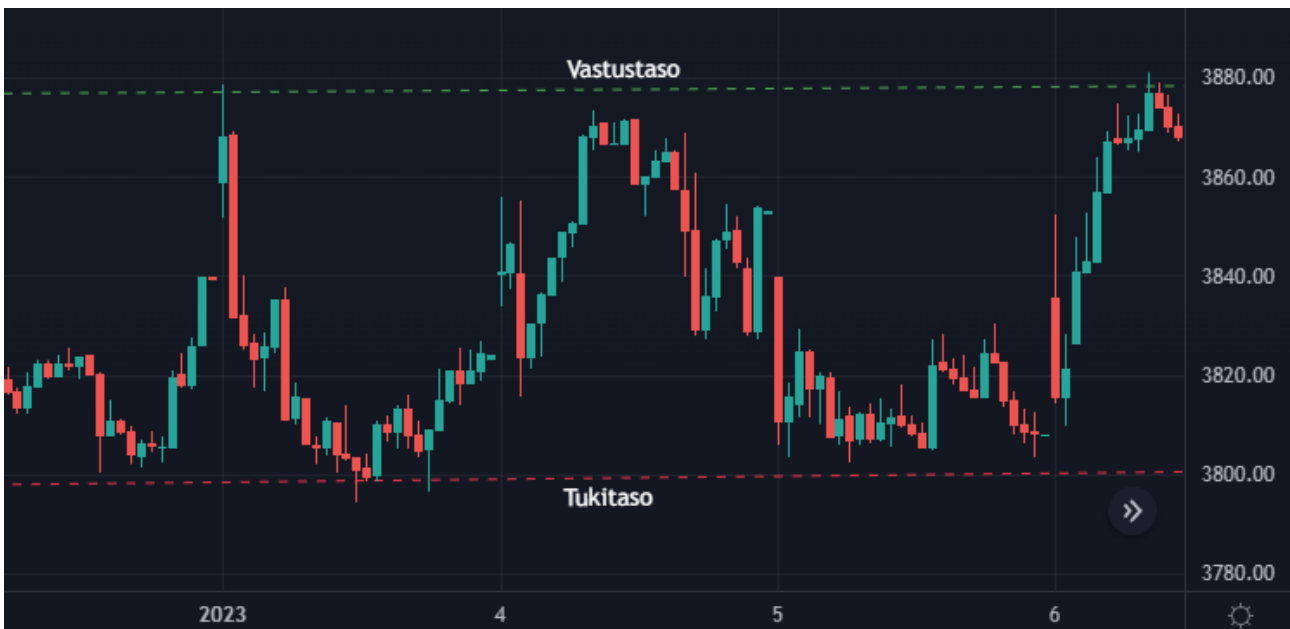
Kuva 10 S&P 500 15 min kynttilägraafi sekä tuki- ja vastustasot (Tradingview)

Tuki- ja vastustasot ovat yksi teknisen analyysin työkaluista, millä voidaan antaa treidaajille tietoa hinnan suunnan muutoksista. Tasoilla tarkoitetaan hintavyöhykkeitä, mitkä perustuvat osakkeen aiempaan hinnan kehitykseen. Kun hinta nousee ja saavuttaa kyseisen vyöhykkeen eli vastustason, niin tämä voi olla merkki siitä, että hinta lähtee laskuun. Sama pätee päinvastoin eli, kun hinta laskee ja osakkeen hinta saavuttaa tukitason odotus on, että hinta lähtee nousuun. On mahdollista, että osakkeen hinta jatkaa kuitenkin nousuaan määritetyn vastustason läpi, jonka jälkeen vastustasosta voi muodostua hinnalle uusi tukitaso. Sama pätee myös toisinpäin eli, kun hinta laskeekin tukitason läpi, niin tällöin tukitasosta voi muodostua hinnan uusi vastustaso. Kuvasta 10 nähdään miten tuki- ja vastustasot näkyvät graafilla. (Cleaver 2021)