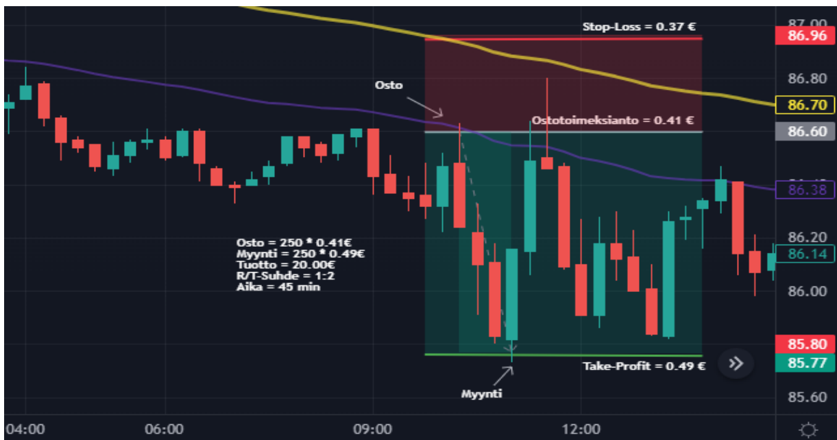
Kuva 29 Öljy 15 min kynttilägraafi (Tradingview)

Treidauspäivänä 5 sain tehtyä kaksi treidiä, joista toinen voitollinen ja toinen tappiollinen. Kuvasta 28 nähdään yhteenveto 25.1 keskiiviikosta. Tuottoa päivän aikana kertyi 10 € ja koko salkku on kasvanut tähän mennessä 37 € ja 1,85 %. Trendit oli molemmissa kohde-etuuksissa kääntynyt ja päivän treidit tein short positioina. Käyn seuraavaksi läpi tarkemmin molemmat treidit.