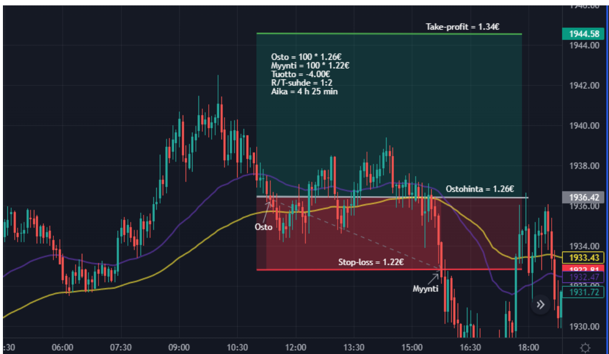
Kuva 27 Kulta 5 min kynttilägraafi (Tradingview)

Treidauspäivä 4 ja ensimmäinen tappiollinen treidi sekä päivä. Päivä oli tiistai 24.1 ja päivän aikana sain tehtyä vain yhden treidin kullalla. Öljyn hinta liikkui sivuittaisliikkeessä koko päivän, joten sieltä en löytänyt hyviä ostopaikkoja. Kuvasta 26 nähdään päivän yhteenveto ja tappiota päivälle kertyi 4 €. Käyn seuraavaksi tarkemmin läpi kuvasta 27, kuinka toimeksiantoon päädyttiin ja miten treidi epäonnistui.