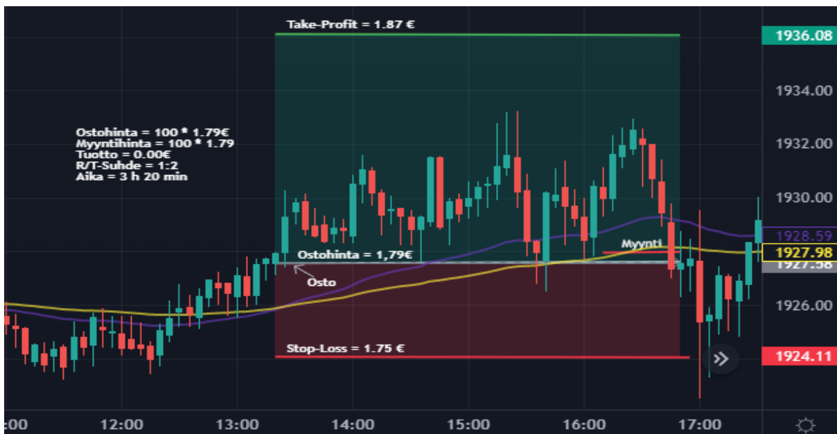
Kuva 37 Kulta 5 min kynttilägraafi

pienemmällä positiolla, koska hinta oli aiemmin liikkunut sivuttain liukuvien keskiarvojen välissä ja pientä epävarmuutta itselläni oli hinnan liikkeistä. Toimeksianto toteutui noin kello 13.30 ja saman tien hinta rikkoi liukuvat keskiarvot. Näin ollen stop-loss taso saavutettiin hyvin nopeasti ja päivälle sain ensimmäisen tappion 4 €. Luottoa itselläni oli kuitenkin laskuun vielä ja päivän toinen short toimeksianto saatiin kello 17.30 aikoihin. Samalla kaavalla, kuin aikaisemmin päivällä eli ensimmäinen kosketus varmisti vastustason toimivuuden ja toisella kerralla sain toimeksiannon tehtyä. Halusin toimeksiannon toteutuvan hieman alle EMA 50:n, että ajoituksessa onnistuisin. Ajoitus olikin loistava ja hinta kävi vain koskettamassa EMA 50:sta, jonka jälkeen lähti laskuun. Tuntia myöhemmin pääsin asetettuun tavoitteeseen ja toinen öljyn treidi oli voitollinen. Suunnittelussa sekä treidissä onnistuin ja onneakin oli mukana ajoituksen kanssa. Toisen treidin riski/tuottosuhde oli 2:2.25 ja tuottoa kertyi 9 €.