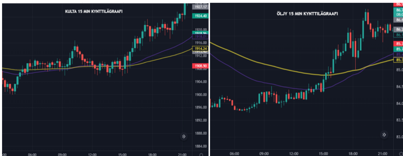
Kuva 24 Kulta ja Öljy kynttilägraafit 19.1 (Tradingview)

Treidauspäivät 2 ja 3 oli hintojen liikkeiden osalta heikompia sekä haluttuja systeemejä ei kynttilägraafille muodostunut. Yhtäkään toimeksiantoa en siis tehnyt näinä päivinä. Treidauspäivät olivat 19.1 torstai sekä 23.1 maanantai. Tarkastelen kynttilägraafeja tarkemmin läpi ja pohdin minkä takia toimeksiantoja ei näinä päivinä tehty.