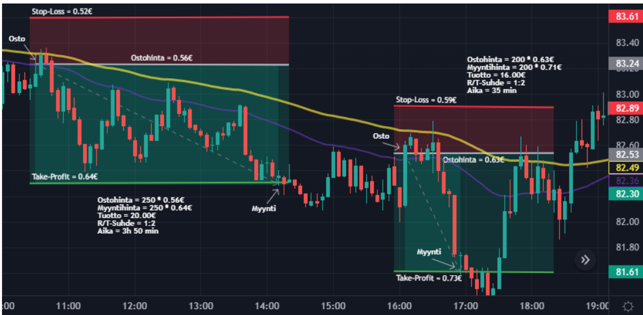
Kuva 39 Öljy 5 min kynttilägraafi (Tradingview)

Treidauspäivä 9 ja koko päiväkirjan tuottoisin päivä tähän mennessä. Kyseessä oli torstai 2.2 ja treidejä päivän aikana sain tehtyä kaksi molemmat öljyllä. Kuvassa 38 on yhteenveto päivästä. Päivän tuotto oli 36 € sekä salkku kasvoi edellisestä päivästä 1,74 %. Molemmat treidit tehtiin short-tina ja systeeminä toimi vastustaso. Koko kassan tuotto on saatu 5 %, mikä oli tavoitteena treidauspäiväkirjalle. Kullan osalta hyviä ostopaikkoja ei löytynyt ja hinta liikkui sivuttain lähes koko päivän. Analysoin seuraavaksi molemmat öljyn treidit vielä tarkemmin kuvasta 39.