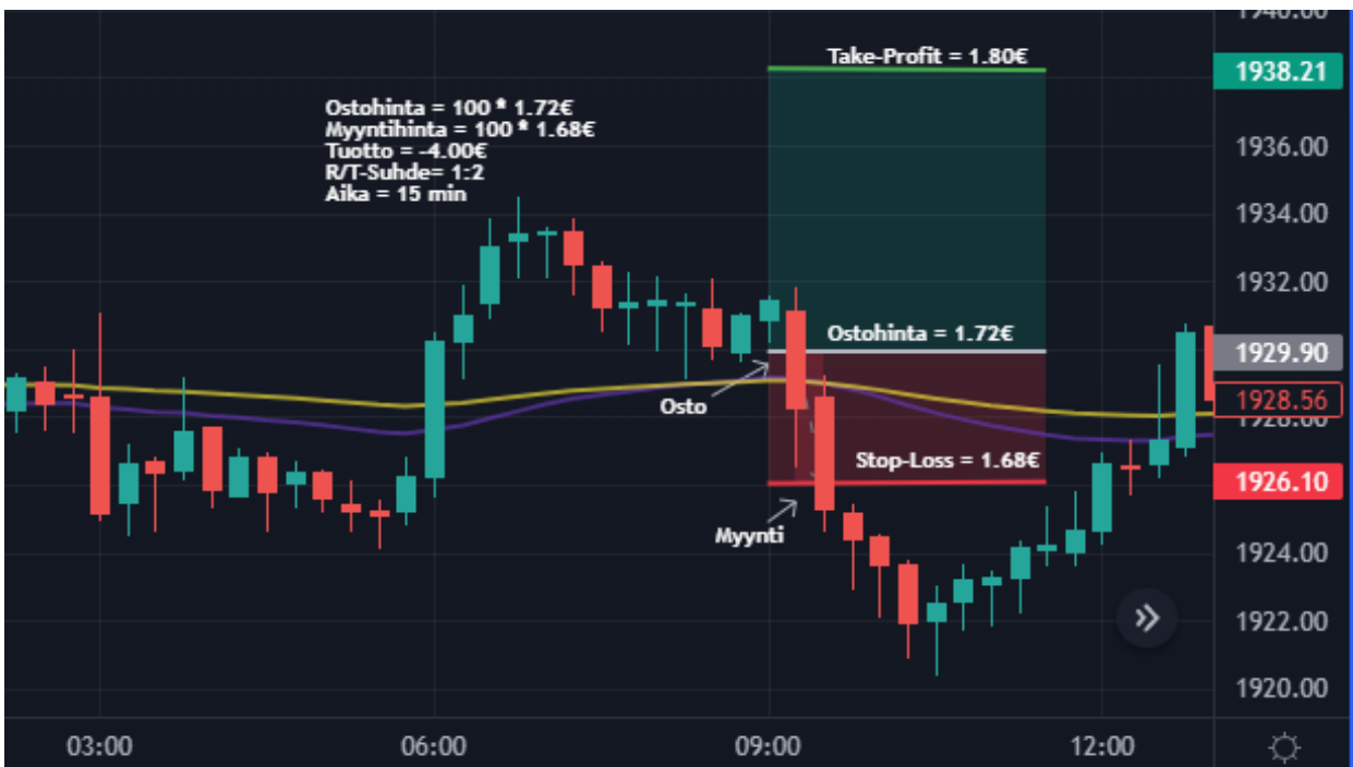
Kuva 32 Kulta 15 min kynttilägraafi

Maanantai 30.1 oli treidauspäiväkirjan kuudes päivä. Päivänä tehtiin kolme treidiä, josta kaksi oli tappiollista ja yksi voitollinen. Treidauspäivän pituudeksi tuli noin 9 tuntia. Päivä päättyi kuten kuvasta 31 nähdään, niin voitollisena ja päivän tuotto oli 22 € ja 1,08 %. Öljyllä sain tehtyä loistavan short positio treidin loistavalla 1:3 riski/tuottosuhteella. Kullan kanssa yritin heti aamusta sekä ilta-päivällä uudestaan long toimeksiantoa kultainen risti kuviolla, mutta kuitenkin tuloksetta. Pääasiassa päivä oli onnistunut ja salkun kokonaistuotto on tähän mennessä kasvanut 59 € ja 2,95 %. Katson tarkemmin onnistuneen öljyn treidin sekä toisen tappiollisista kullan treideistä.