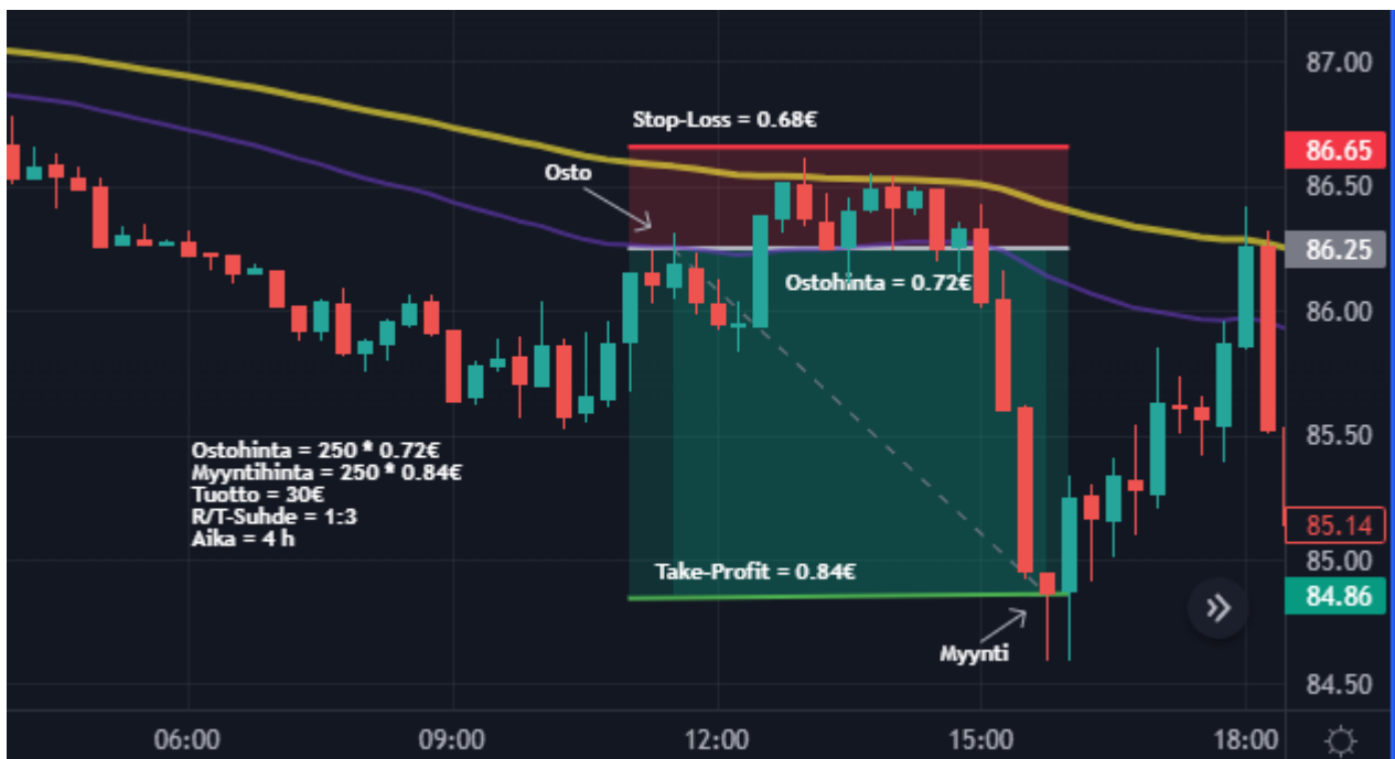
Kuva 33 Öljy 15 min kynttilägraafi (Tradingview)

Kulta jatkoj edelleen isossa kuvassa nousutrendiä ja ensimmäistä treidiä lähdin suunnittelemaan jo hyvissä ajoin aamulla ennen markkinapaikan avautumista. Kuten kuvasta 32 nähdään, niin hinta tehnyt aamusta hyvän nousun liukuvien keskiarvojen päälle ja toimeksiantoa lähdin toteuttamaan kultainen risti systeemillä. Lähdin treidiin kuitenkin hieman pienemmällä positiolla, koska hinta oli aiemmin pomppinut liukuvien keskiarvojen välissä, joten epävarmuutta hinnan nousuun oli. Toimeksiannon toteutin lähes heti markkinapaikan avauduttua klo 9.15. Toimeksiannon tehtyä tuli lähes heti huomattua, että näkemys hinnan kääntymisestä nousuun oli väärä. Noin 15 minuutin kulluttua hinta päätyi asettamaani stop-loss tasoon, ja päivän ensimmäinen treidin myin tappiolla. Ilta-päivällä klo 16 aikaan tein vielä samantyyllisen toimeksiannon 5 minuutin kynttilägraafilla, mutta lopputulos oli samanlainen kuin tässä. Molemmat treidit tein pienemmällä positiolla hinnan liikkeen epävarmuuden johdosta, joten tappiot eivät rasittaneet salkkua paljon.