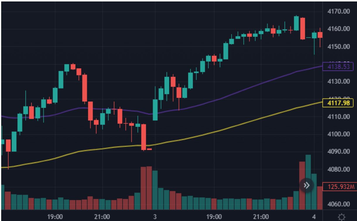
Kuva 7 S&P 500 15 min kynttilägraafi ja volyyymi