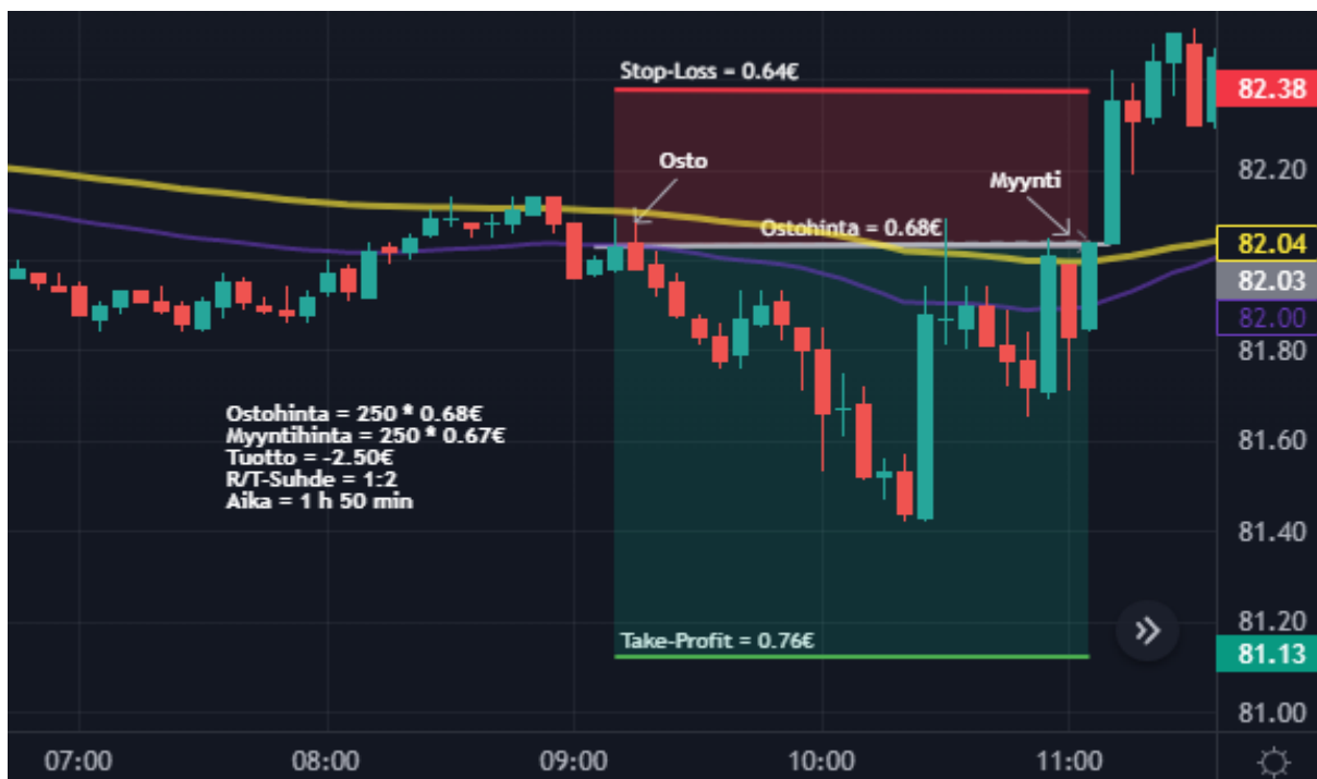
Kuva 41 Öljy 5 min kynttilägraafi