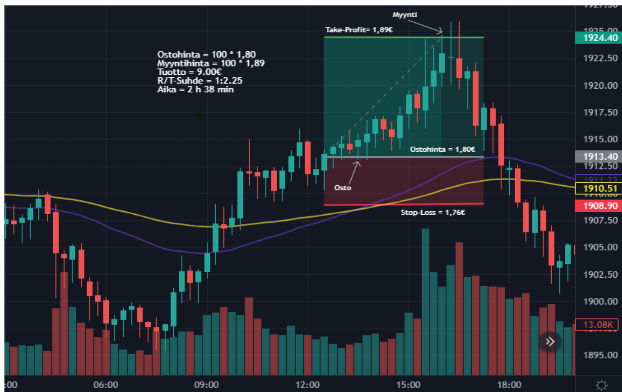
Kuva 23 Kulta 15 min kynttilägraafi (Tradingview)