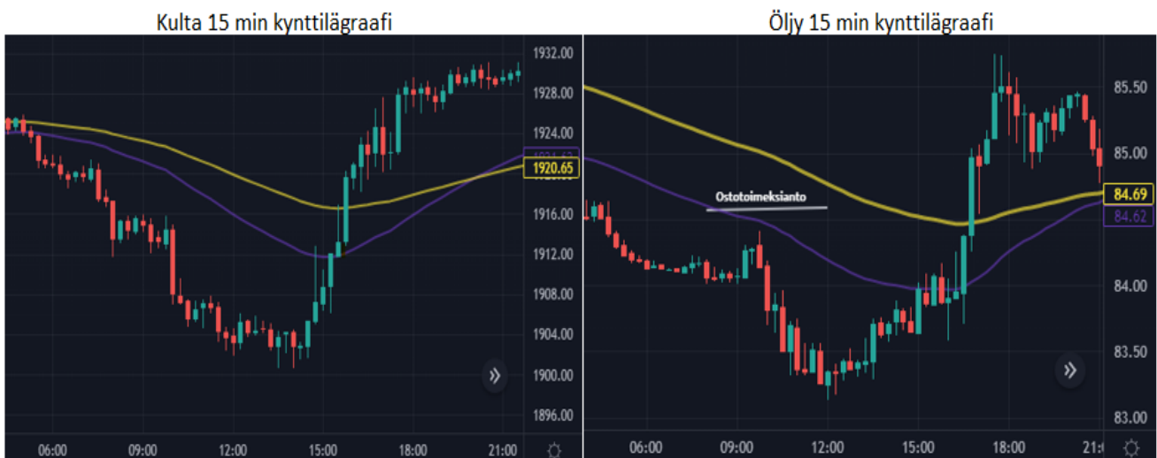
Kuva 34 Kullan ja öljyn kynttilägraafit 31.1

Treidauspäivä 7 ja kyseessä tiistai 31.1. Päivän aikana en valitettavasti saanut tehtyä yhtään treidiä. Kullan graafilta ei löytynyt ollenkaan hyviä ostopaikkoja, kun taas öljyllä suunnittelin tekeväni treidin, mutta ajoituksessa en onnistunut. Tarkastelen vielä tarkemmin kuvasta 34 päivän graafeja sekä hintaliikkeitä ja miksi en toimeksiantoja tehnyt.