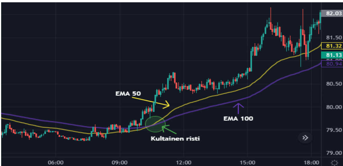
Kuva 17 Öljy kynttilägraafi ja EMA 50&100 (Tradingview)

Exponentiaalinen liukuva keskiarvo eli EMA tarkastelee samoin kuin SMA- indikaattorikin arvopaperin trendiä halutulta ajanjaksolta. Indikaattoreiden ero muodostuu siitä, että EMA- indikaattori painottaa uusimpien päivien hinnanmuutoksia vanhempia enemmän ja tästä syystä se reagoi hinnanmuutoksiin SMA- indikaattoriin verrattuna herkemmin. Monet treidaajat suosivat EMA- indikaattorin käyttöä, kun hinnan ja trendin tarkastelujakso on lyhyempi. (Nordnet Suomi 2018b, 3:30–4.30 min; Sijoittaja 2022)