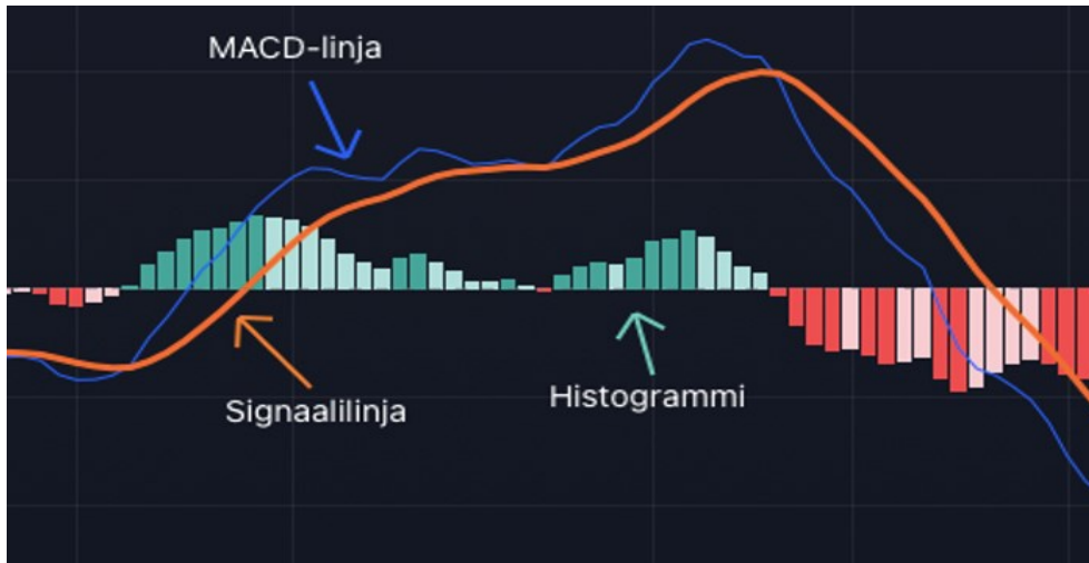
Kuva 14 MACD indikaattori (Tradingview)

Sininen viiva on nopeampi MACD-linja ja oranssi hitaammin muuttuva signaalilinja. Osto- ja myyntisignaaleja saadaan, kun nopeampi MACD-linja ylittää tai alittaa signaalilinjan. Linjojen välissä näkyvä pylväsdiagrammi eli histogrammi kertoo MACD-linjan ja signaalilinjan erotuksesta. Kun MACD-linja on signaalilinjan yläpuolella, se näkyy positiivisina ylöspäin näkyvinä pylväinä ja, kun MACD-linja on signaalilinjan alapuolella, se näkyy negatiivisina alaspäin näkyvinä pylväinä. Pylvään korkeus vaihtelee linjojen erotuksen mukaan, ja mitä kauempana MACD-linja on signaalilinjasta, sitä korkeampi pylväs on. (Nordnet Suomi 2018a. 2:30-3:30 min)