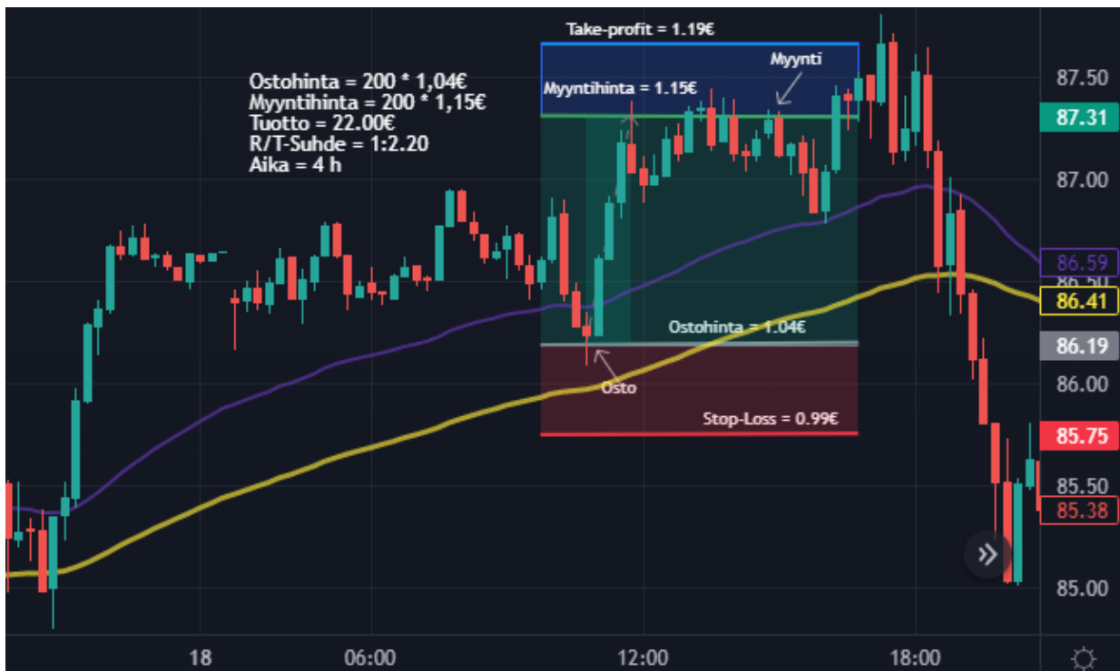
Kuva 22 Öljy 15 min kynttilägraafi

Treidauspäiväkirjan ensimmäisenä päivänä tein kaksi treidiä, joista molemmat voitollisia. Kuvassa 21 nähdään, että molemmat treidit on tehty long positiona. Salkku kasvoi päivän aikana 31 € ja 1,55 %. Päivä onnistui kokonaisuudessaan mielestäni loistavasti ja sain treidauspäiväkirjalle parhaan mahdollisen alun. Päivän pituudeksi tuli noin 8 tuntia, aloitin päivän noin klo 10 aikaan aamulla ja lopetin päivän klo 18. Analysoin seuraavaksi molemmat kaupat sekä pohdin, miten toimeksiantoihin päädyttiin ja olisiko jotain voinut ehkä tehdä vielä paremmin.