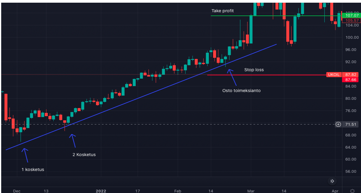
Kuva 9 Öljyn kynttilägraafi ja trendilinja (Tradingview)

Trendilinjat ovat yksi tärkeimmistä teknisten analyttikoiden käyttämistä työkaluista. Trendilinjat auttavat treidaajia määrittämään nykyisen suunnan markkinahinnoissa. Trendilinjat näyttävät visuaalisesti tuki- ja vastustason millä tahansa aikajaksolla sekä, siten voivat muodostaa hyviä ostopaikoja treidaajille. Tekniset analyttikot uskovatkin, että trendi on ystäväsi ja hyvän treidin tekemisen ensimmäinen askel on tunnistaa trendin suunta. (Chen 2022)