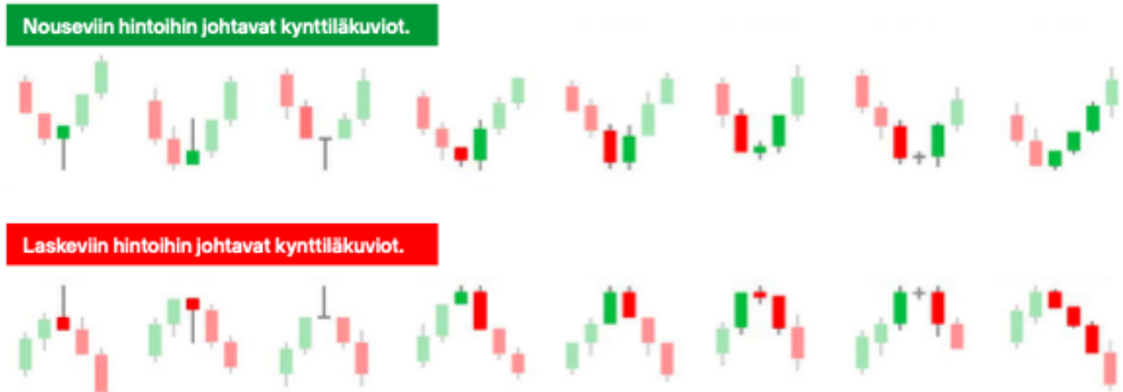
Kuva 6 Trendin käännöksestä kertovia kynttiläkuvioita (Lepikkö 2020, 74)

Kynttilät voivat muodostaa erilaisia kynttiläkuvioita. Kuvioiden muodostumiseen tarvitaan vähintään kaksi kynttilää. Erilaisille kynttiläkuvioille on keksitty paljon nimiä, kuten esimerkiksi hammer, three black crows, bullish harami tai hanging man. Lepikön mielestä näiden yksittäisten kuvioiden nimien opetteluun ei kannattaisi käyttää aikaa, vaan opeteltaisiin näkemään erilaisia heikkoja ja vahvoja kynttilöitä sekä niiden muodostamia kuvioita. Kuvassa 6 nähdään erilaisia kynttiläkuvioita, mitkä voisivat johtaa nouseviin tai laskeviin hintoihin. Kynttiläkuvioilla voidaan esimerkiksi indikoida trendin suunnan muutoksesta. (Lepikkö 2020, 74)