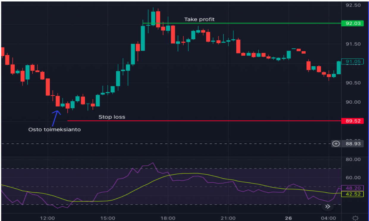
Kuva 13 Öljyn 15 min kynttilägraafi ja RSI (Tradingview)

Kuvassa 13 on öljyn kynttilägraafi ja yksi kynttilä edustaa 15 minuutin aikaa. Lisäsin graafille RSI indikaattorin ja isossa kuvassa markkinan trendi oli nousussa. Kuten kuvasta nähdään, RSI:n eli liilan viivan laskiessa alle 30 saadaan ylimyyty signaali. Tämän signaalin avulla voidaan harkita toimeksiantoa long positiona. Stop-loss taso asetus oman strategian mukaan toimeksiantoa suunniteltaessa ja myynti voitaisiin toteuttaa esimerkiksi, kun RSI nousee yli luvun 70 yliostetulle alueelle tai asettamalla take-profit taso oman strategian mukaan. Tällä tavoin RSI:tä olisi mahdollista hyödyntää omassa strategiassa.