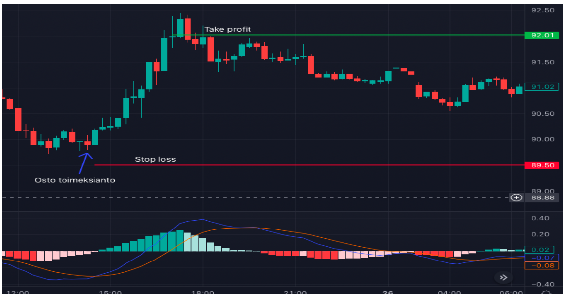
Kuva 15 Öljyn 15 min kynttilägraafi ja MACD (Tradingview)

Sininen viiva on nopeampi MACD-linja ja oranssi hitaammin muuttuva signaalilinja. Osto- ja myyntisignaaleja saadaan, kun nopeampi MACD-linja ylittää tai alittaa signaalilinjan. Linjojen välissä näkyvä pylväsdiagrammi eli histogrammi kertoo MACD-linjan ja signaalilinjan erotuksesta. Kun MACD-linja on signaalilinjan yläpuolella, se näkyy positiivisina ylöspäin näkyvinä pylväinä ja, kun MACD-linja on signaalilinjan alapuolella, se näkyy negatiivisina alaspäin näkyvinä pylväinä. Pylvään korkeus vaihtelee linjojen erotuksen mukaan, ja mitä kauempana MACD-linja on signaalilinjasta, sitä korkeampi pylväs on. (Nordnet Suomi 2018a. 2:30-3:30 min)