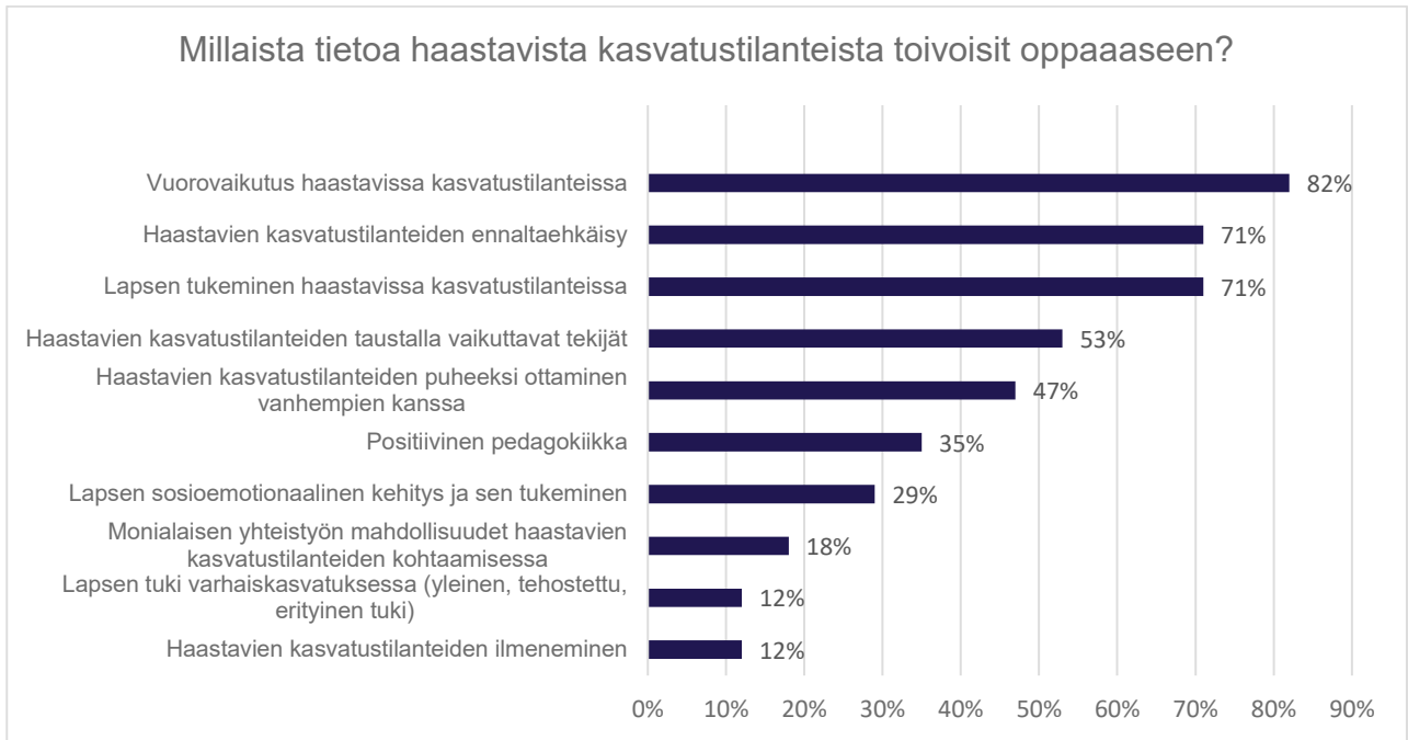
Kuvio 6. Varhaiskasvattajien toiveet oppaan sisällöstä.

Vastaajien toiveista oppaan sisältöön nousi vuorovaikutus, ennaltaehkäisy, lapsen tukeminen ja haastavien kasvatustilanteiden taustalla vaikuttavat tekijät. Kaikki nämä vaihtoehdot valittiin selkeästi suurimman osan vastaajista kesken.