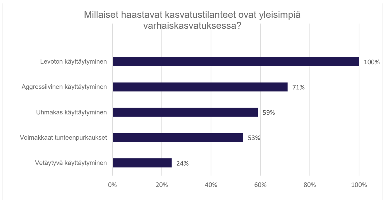
Kuvio 1. Haastavien kasvatustilanteiden ilmenemismuodot.

Haastavien kasvatustilanteiden ilmenemistä selvitin ensin kysymällä, millaiset haastavat kasvatustilanteet ovat vastaajien mielestä yleisimpiä varhaiskasvatuksessa (kuvio 1). Monivalintakysymyksessä vastaaja sai valita useamman vastausvaihtoehdon. Valittujen vastausten lukumäärä oli 52. Vastausvaihtoehtoina oli aggressiivinen käyttäytyminen, uhmakas käyttäytyminen, levoton käyttäytyminen, vetäytyvä käyttäytyminen ja voimakkaat tunteenpurkaukset. Jokaisen vastaajan mielestä levoton käyttäytyminen oli yksi yleisimmistä haastavien kasvatustilanteiden ilmenemismuodoista varhaiskasvatuksessa. Suurimman osan vastaajista mielestä aggressiivinen käyttäytyminen on yksi yleisimmistä ilmenemismuodoista. Vähän yli puolet vastaajista kokivat myös uhmakkaan käyttäytymisen sekä voimakkaat tunteenpurkaukset näyttävän yleisimpänä varhaiskasvatuksessa. Vetäytyvää käyttäytymistä yhtenä yleisimmistä ilmenemismuodoista piti vain neljä vastaajista.