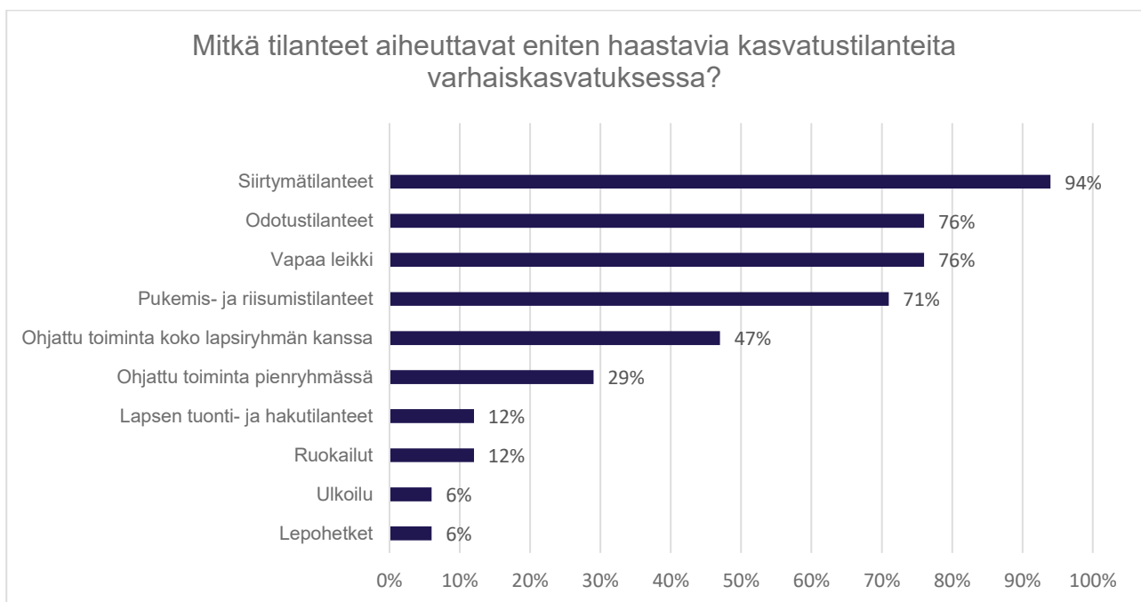
Kuvio 3. Haastavia kasvatustilanteita aiheuttavat tilanteet päiväkodissa.

Haastavien kasvatustilanteiden ilmenemistä selvitin vielä kysymällä, mitkä tilanteet aiheuttavat vastaajien mielestä eniten haastavia kasvatustilanteita varhaiskasvatuksessa (kuvio 3). Monivalintakysymyksessä oli kymmenen vastausvaihtoehtoa ja muu, mikä valinta. Monivalintakysymyksessä vastaaja sai valita useamman vastausvaihtoehdon. Valittujen vastausten lukumäärä oli 73. Yhtä vastaajaa lukuun ottamatta jokaisen vastaajan mielestä siirtymätilanteet aiheuttavat eniten haastavia kasvatustilanteita. Suurin osa vastaajista koki myös odotustilanteiden, vapaan leikin sekä pukemis- ja riisumistilanteiden aiheuttavan haastavia kasvatustilanteita. Ohjatun toiminnan koko lapsiryhmän kanssa haastavia kasvatustilanteita aiheuttavaksi koki melkein puolet vastaajista ja ohjatun toiminnan pienryhmässä koki kolmas osa vastaajista. Muutama vastaajista koki lapsen tuonti- ja hakutilanteet ja ruokailut haastavia kasvatustilanteita aiheuttaviksi. Vähiten haastavia kasvatustilanteita aiheuttaviksi vastaajat kokivat lepoaikat ja ulkoilut.