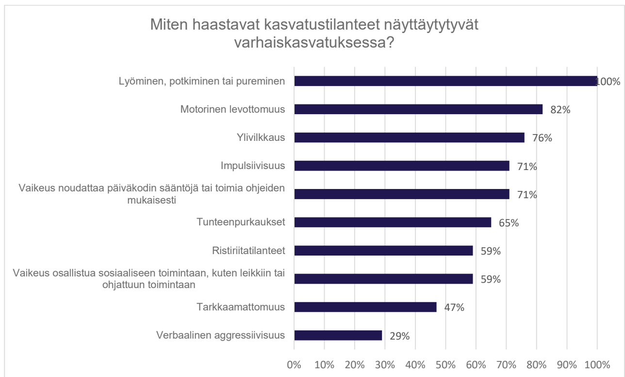
Kuvio 2. Haastavien kasvatustilanteiden näyttäytyminen päiväkodissa.

Haastavien kasvatustilanteiden ilmenemistä selvitin myös kysymällä, miten haastavat kasvatustilanteet vastaajien mielestä näyttäytyvät varhaiskasvatuksessa (kuvio 2). Monivalintakysymyksessä oli kymmenen vastausvaihtoehtoa ja muu, mikä valinta. Monivalintakysymyksessä vastaaja sai valita useamman vastausvaihtoehdon. Valittujen vastausten lukumäärä oli 113. Jokaisen vastaajan mielestä haastavat kasvatustilanteet näyttäytyvät lyömisenä, potkimisena tai puremisena. Suurimman osan vastaajista mielestä haastavat kasvatustilanteet näyttäytyvät motorisena levottomuutena, ylivilkkautena, impulsiivisuutena ja vaikeutena noudattaa päiväkodin sääntöjä tai toimia ohjeiden mukaisesti. Vähän yli puolet vastaajista kokivat haastavien kasvatustilanteiden näyttäytyvän tunteenpurkauksina, ristiriitatilanteina ja vaikeutena osallistua sosiaaliseen toimintaan, kuten leikkiin tai ohjattuun toimintaan. Pienempi osa vastaajista kertoi haastavien kasvatustilanteiden näyttäytyvän tarkkaamattomuutena tai verbaalisena aggressiivisuutena. Muu, mikä vastausvaihtoehdossa tuotiin esille haastavien kasvatustilanteiden näyttäytyminen lapsen jumittamisena ja siirtymätilanteiden haastavuutena.