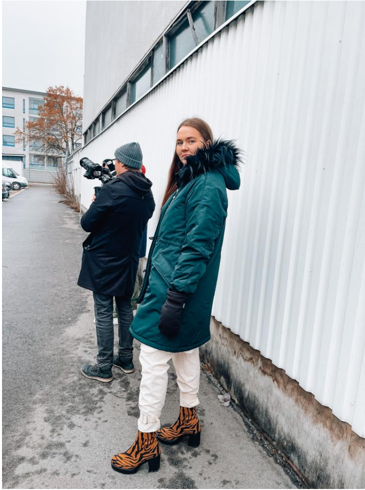
Kuva 2. Lämmittelemässä kuvauksien välissä. (Idahosa 2022).