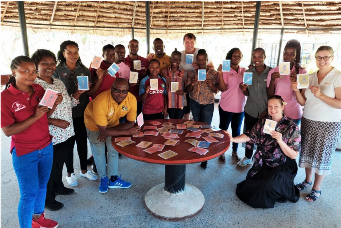
ScaLED-hankkeen erityispedagogiikan tuotteen työpaja Mtwarassa, Tansaniassa syksyllä 2022.

Koulutuspalveluiden ja tuotteiden kysyntä kansainvälisillä markkinoilla on luonut liiketoimintamahdollisuuksia Suomen rajojen ulkopuolella. COVID-19-pandemia korosti erityisesti laadukkaiden digitaalisten koulutusratkaisuiden tarvetta sekä nosti näkyvästi esiin tarpeet kehittää koulutuksen vaikuttavuutta kehittyvissä maissa myös kansainvälisten kehitysrahoittajien verkostojen avulla. Yhdistämällä suomalaisen koulutusjärjestelmän laatu ja Oulun alueen ICT-osaaminen voi koulutusvientiin syntyä huippuosaamista. Selvitys sisältää havaintoja sekä kehitysideoita ja on toteutettu osana Pohjois-Pohjanmaan liiton rahoittamaa ScaLED – Digitaaliset koulutusratkaisut koulutusviennissä -hanketta.