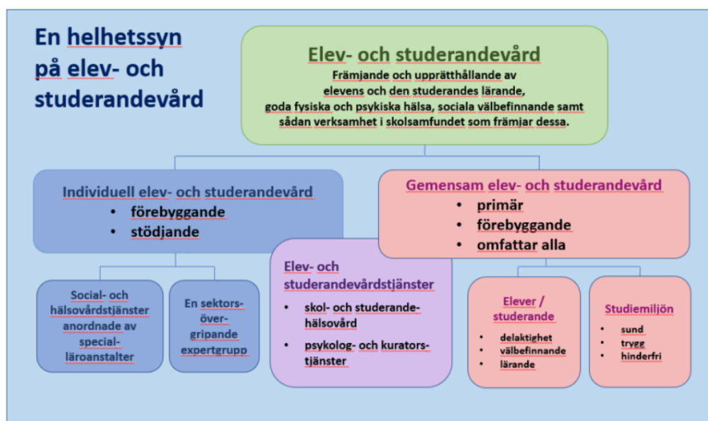
Figur 1. En helhetssyn på elev- och studerandevård (Utbildningsstyrelsen 2022)

I presenteras en helhetssyn på det övergripande elev- och studerandevårdsarbetet (Utbildningsstyrelsen 2022).