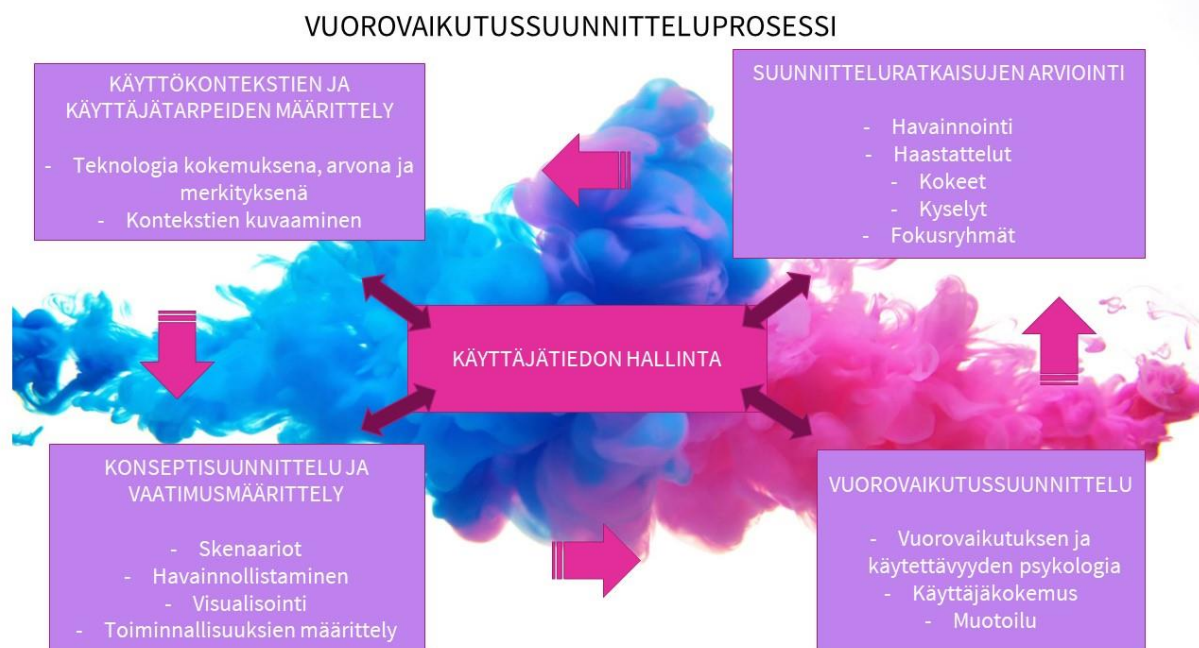
Kuva 1. Vuorovaikutussuunnitteluprosessi (mukailtu Saariluoma ym. 2010, 118)

Käyttäjätiedon tehokkaan hallinnan tulisi olla keskeinen osa prosessia. Käyttäjätietoa erilaisissa muodoissa voivat sisältää esimerkiksi tutkimukset, käytettävyydestausraportit, ihmisen ja teknologian vuorovaikutusta käsittelevät artikkelit, asiakaspalauteraportit tai markkinatutkimusraportit. Lopulta riippuu tietenkin aina kehitettävästä tuotteesta tai palvelusta, millainen käyttäjätieto missäkin tapauksessa on suunnittelun kannalta oleellista. Yksittäistä tuotekehitysprosessia laajemmin ajateltuna olisi hyvä, että prosessin aikana tuotettu käyttäjätieto tallentuisi organisaation hyödynnettäväksi myös seuraavissa projekteissa. Tällainen käyttäjätietopääoman kasvattaminen mahdollistaisi tehokkaan suunnitteluprosessin myös suunnittelutyöryhmien vaihtuessa. (Saariluoma ym. 2010, 117–119.)