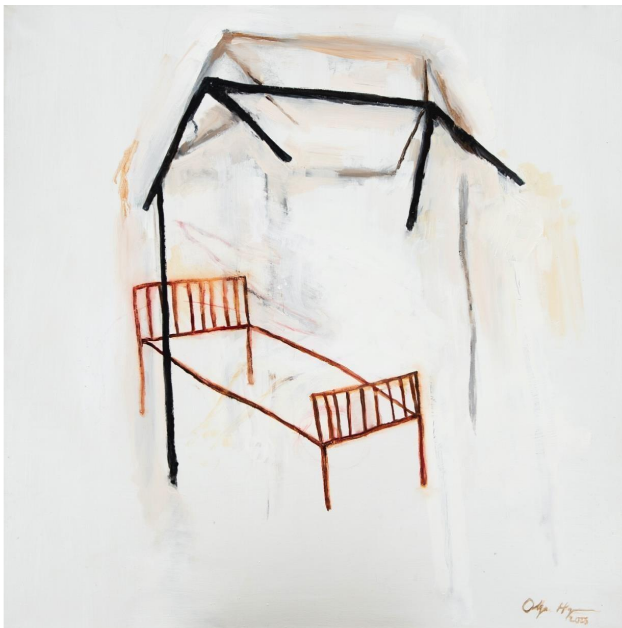
Kuva 13, musta valo , 2023, öljy kankaalle, 60 x 80 cm