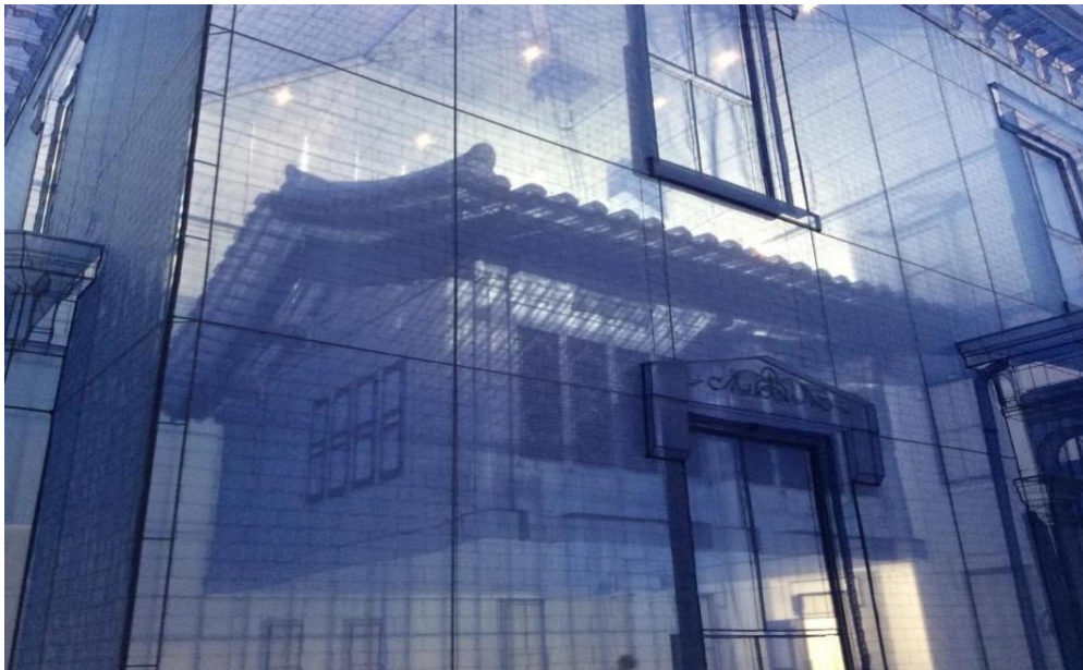
Kuva 6, Do Ho Suh, Home Within Home Within Home Within Home Within Home , 2013-2014, kangas ja ruostumaton teräs, 12 m x 15 m (Suh 2013-2014c)