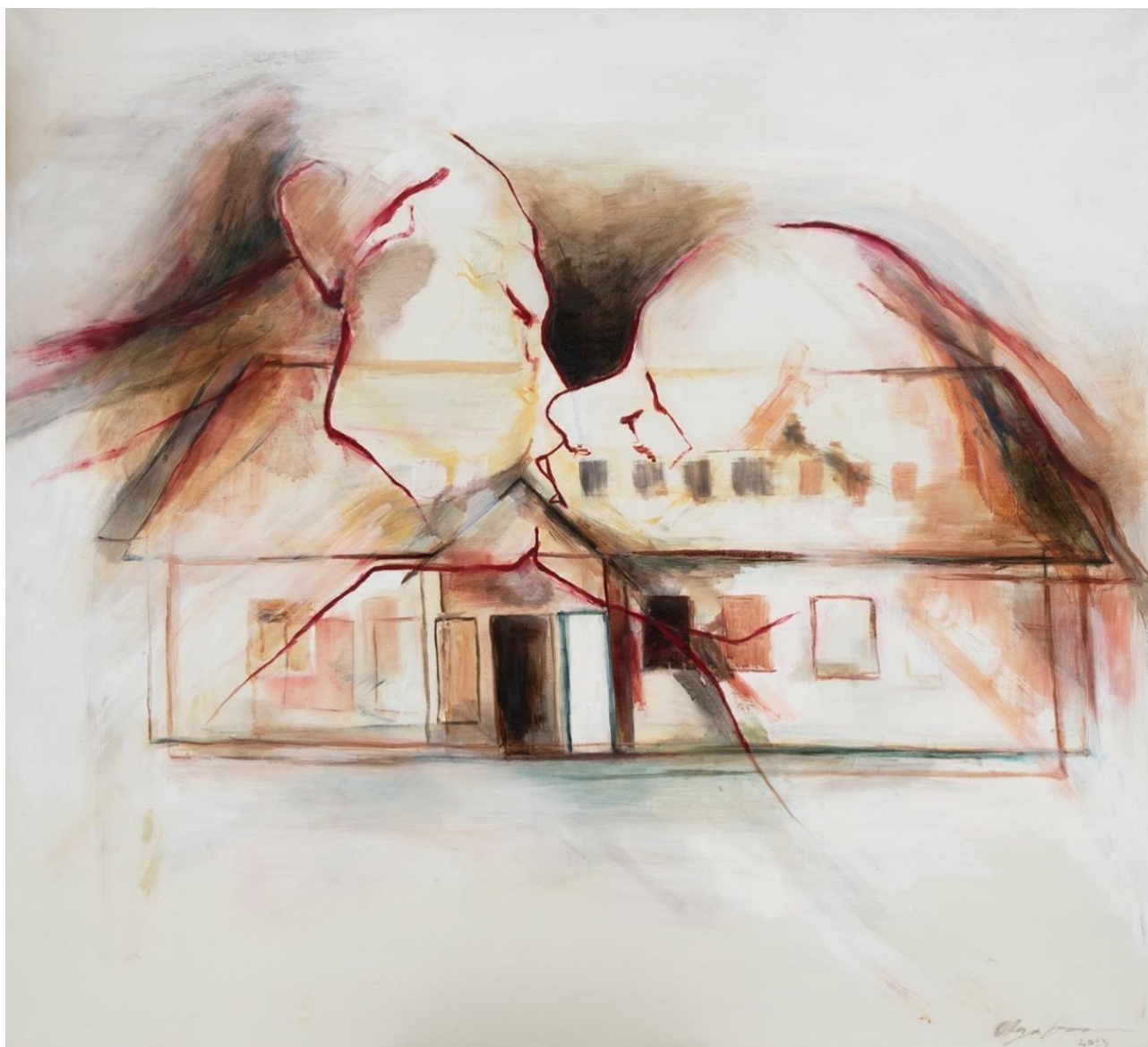
Kuva 11, etkö näe kun pelkään , 2023, öljy kankaalle, 110 x 100 cm