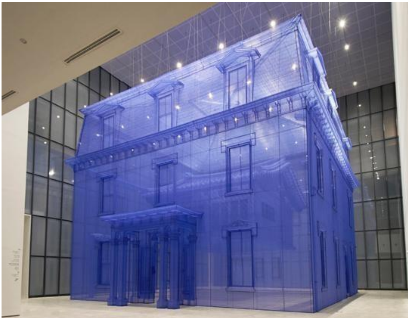
Kuva 4, Do Ho Suh, Home Within Home Within Home Within Home Within Home , 2013-2014, kangas ja ruostumaton teräs, 12 m x 15 m (Suh 2013-2014a)