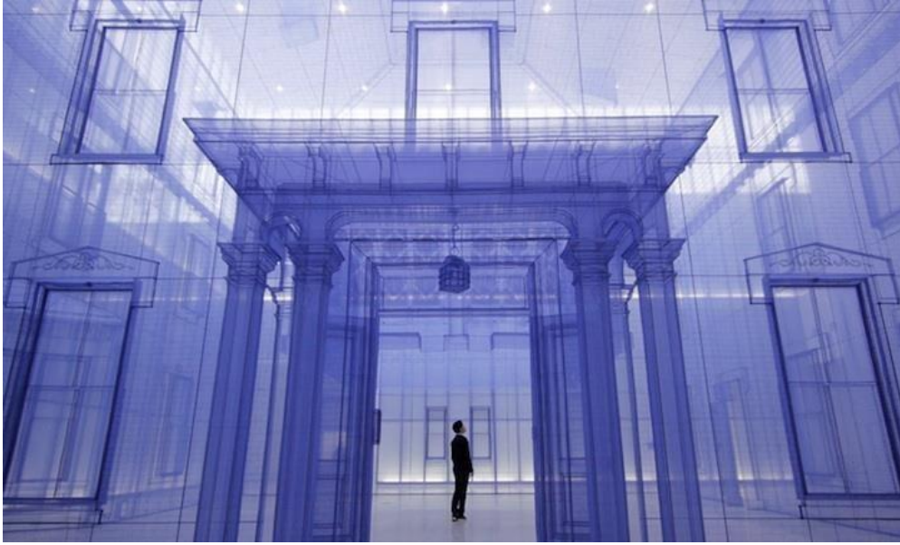
Kuva 5, Do Ho Suh, Home Within Home Within Home Within Home Within Home , 2013-2014, kangas ja ruostumaton teräs, 12 m x 15 m (Suh 2013-2014b)