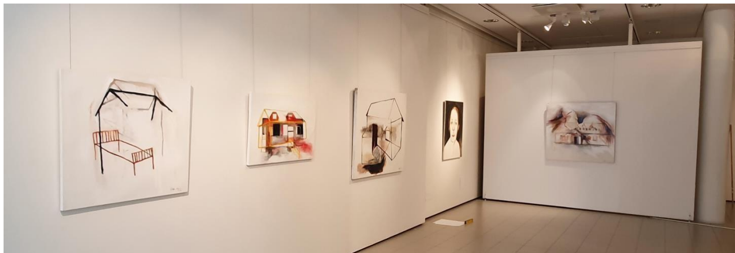
Kuva 14, ripustus Imatran taidemuseolla