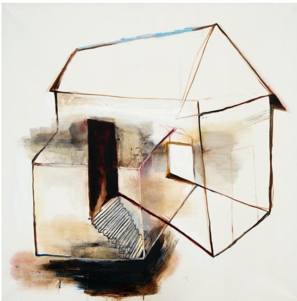
Kuva 10, kaksi kotia , 2022, öljy kankaalle, 110 x 100 cm

Maalauksen tummanpuhuvat värivalinnat ääriivamaisessa talossa, sekä läpikuultavat hajoavat elementit maalauksessa, yhdistettynä maalaus pohjan valkoisuuteen tukevat kolkkoa, kylmää ja vaikeaa tunnelmaa kodista.