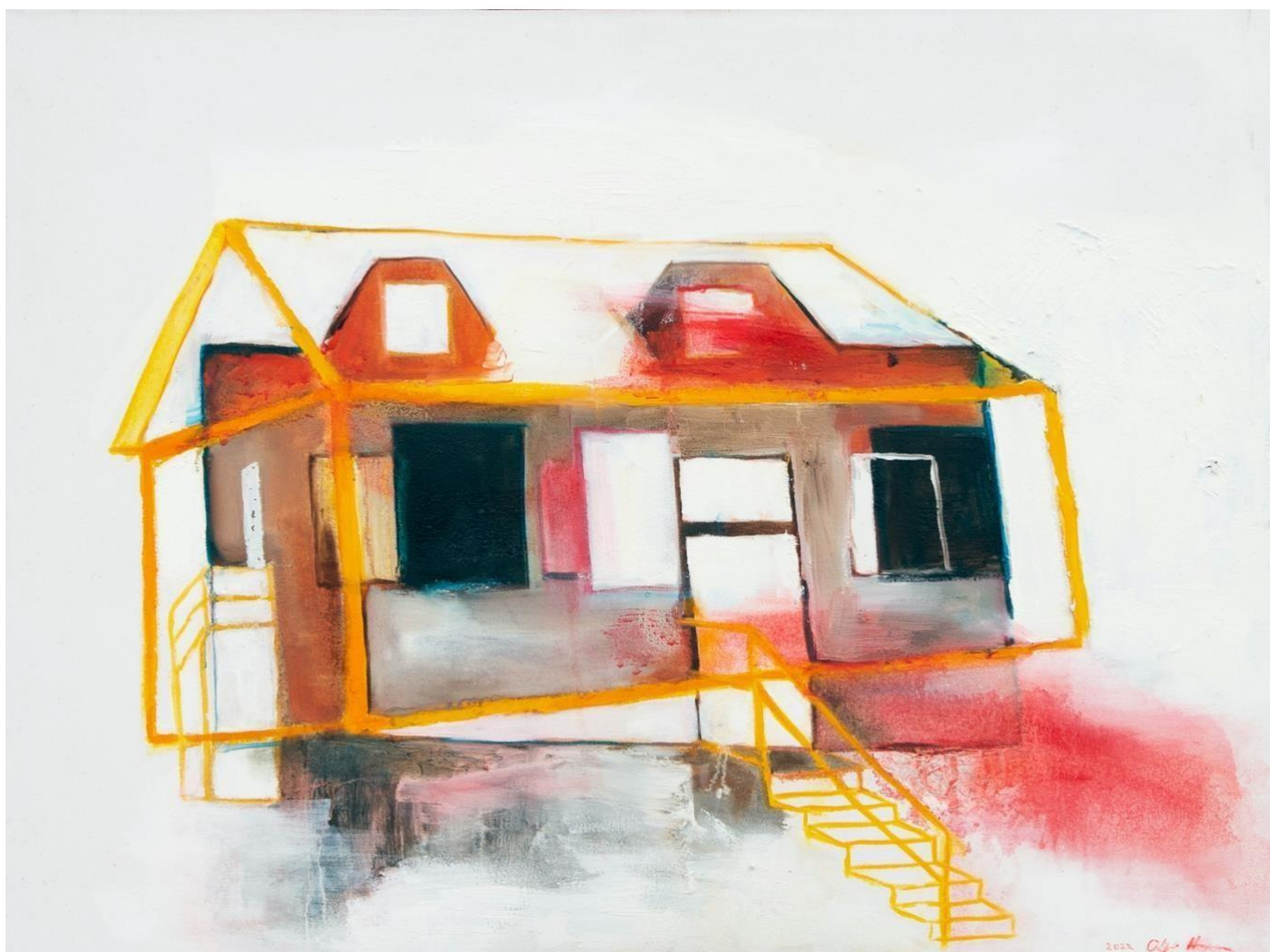
kuva 9, olin rakastunut , 2022, öljy kankaalle, 60 x 48 cm

Maalaus olin rakastunut (kuva 9), on ensimmäinen kotiaiheinen maalaus ja ensimmäinen teos, jonka olen tehnyt kyseiseen sarjaan opinnäytetyössäni. Lähtökohtana on toiminut tunne kodista, jossa olen asunut nuorena. Maalauksen olin rakastunut nimi viittaa ensirakkauteen, jonka koin talossa, sekä rakkauteen, joka nuorella ihmisellä on elämää kohtaan.