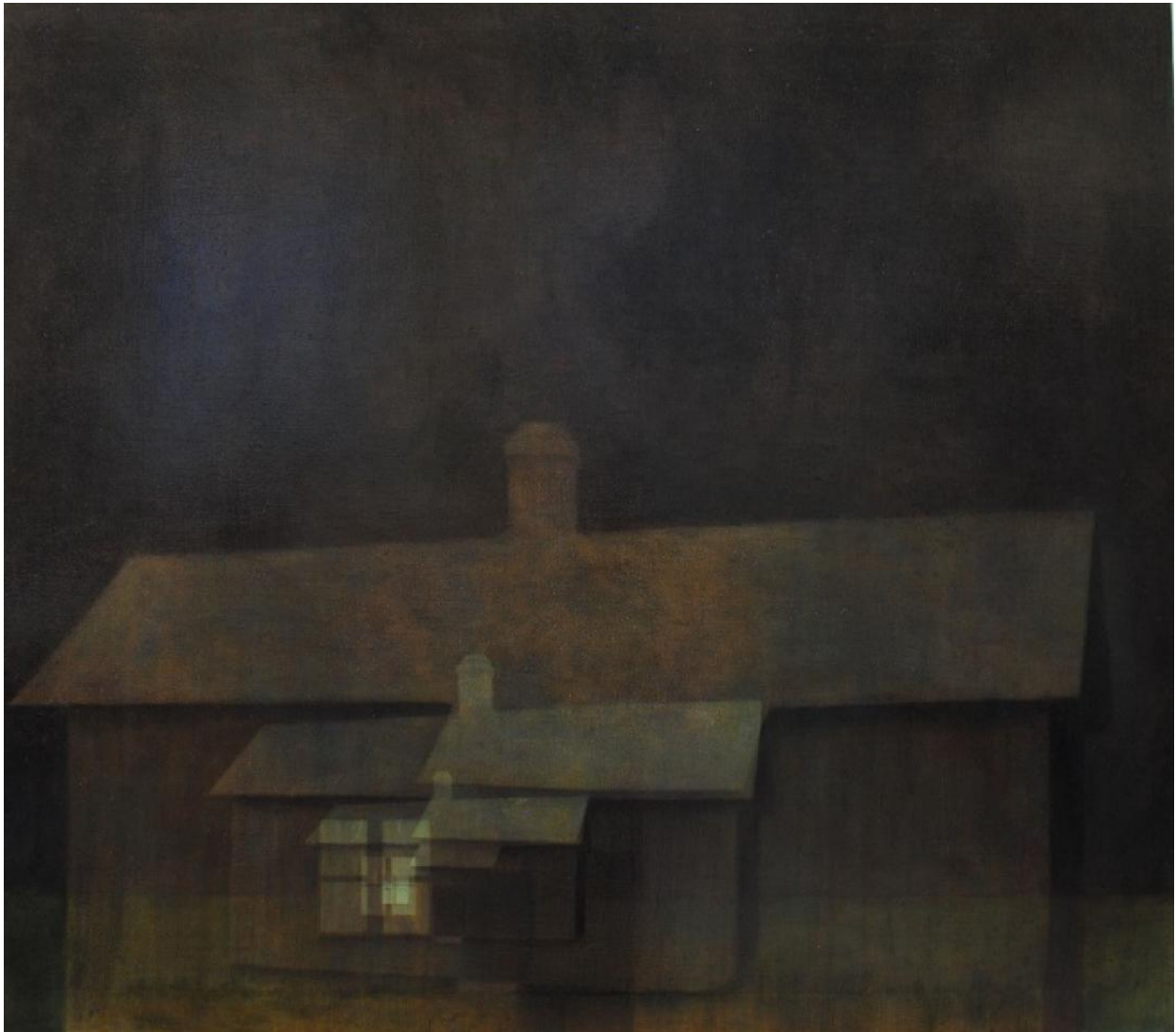
Kuva 1, Susanne Gottberg, Genomfart , 1998, öljy kankaalle, 146 x 166 cm (Gottberg 1998)

esiin ulkoisen maailman tarkkailun tilalle. Nämä kaksoiskuvat antavat mahdollisuuden nähdä todellisuutta pidemmälle, syvemmälle. (Ruohonen 2005.) Kaksoiskuvia Gottberg on käyttänyt maalauksissaan Genomfart, 1998 (kuva 1) ja Hemresa, 1993 (Kuva 2) . Nieminen toteaa (1999, 2) Gottbergin luovan maalauksissa kaksoiskuvien avulla muistoja alitajunnastamme. Maalaukset luovat siltoja muistojen välille muistin eri kerroksista.