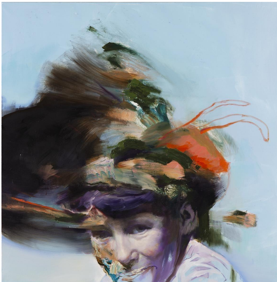
Kuva 8, Ville Löppönen, Hat, 2019, akryyli ja öljy kankaalle, 68 x 84 cm (Löppönen 2018)