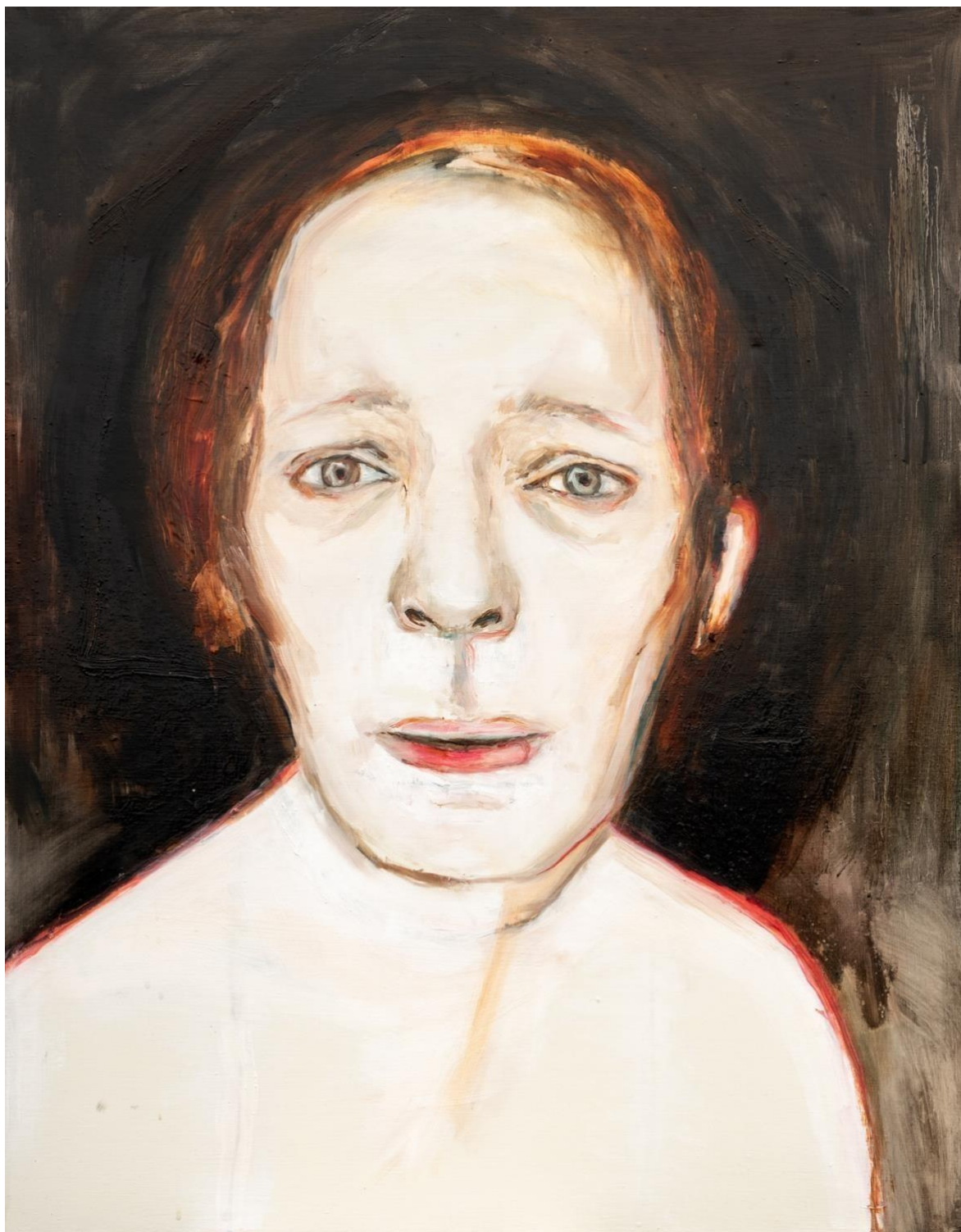
Kuva 12, where is, home , 2023, öljy ja tempera kankaalle, 90 x 110 cm