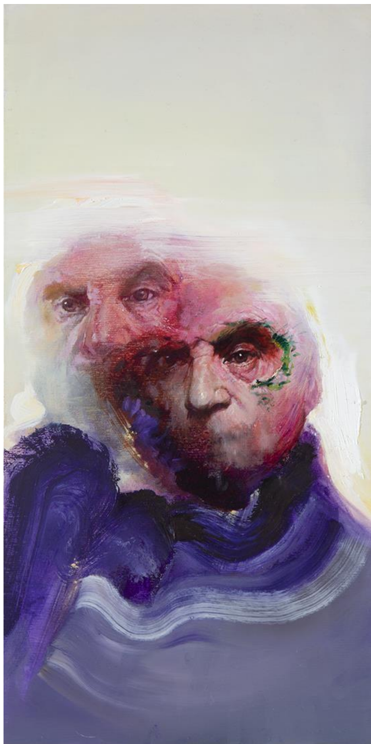
Kuva 7, Ville Löppönen, Francis Bacon , 2018, öljy puulevyllä, 40 x 20 cm (Löppönen 2018)