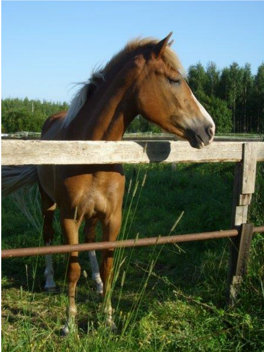
KUVA 1. Hevosilla tulee olla turvalliset ulkoiluolosuhteet.

Hevosalan kasvaessa nousevat hevostallien ympäristöasiat yhä enemmän huomioon, koska ihmisten kiinnostus ja tiukentunut lainsäädäntö sitä yrittäjiltä velvoittaa. Kun tallien ympäristöasioista ja siisteydestä on huolehdittu asiallisesti, luo se yritykselle positiivista imagoa, jota asiakkaat arvostavat. Ympäristönsuojelu on luonnon ja ympäristön suojelua sekä toimivan ja turvallisen työympäristön luomista. Käytännöllinen ja ympäristöystävällinen talli antaa mahdollisuuden työskennellä turvallisesti ja tehokkaasti ja siten sekä hevoset että työntekijät voivat paremmin.