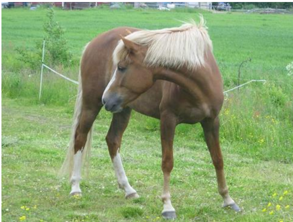
Kuva 1. Suomenhevostamma Wiiman Siiri.

Suomenhevosesta maksettava ympäristökorvaus eläinyksikköä kohden voi olla 300 € vuodessa.