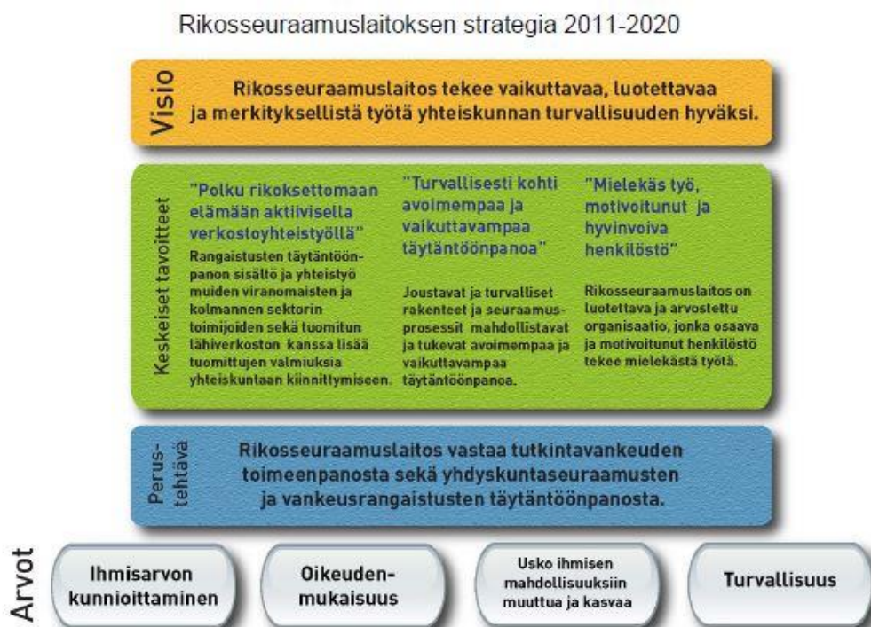
Kuva 1: Rikosseuraamuslaitoksen strategia 2011-2020 (Rikosseuraamuslaitos 2011)

Rikosseuraamuslaitoksen tärkeimpiä tavoitteita ovat yhteiskunnan turvallisuuden parantaminen vaikuttavalla ja oikeudenmukaisella työllä sekä uusintarikollisuuden vähentämisellä. Tavoitteena on pyrkiä kohti avoimempaa täytäntöönpanoa, joka tarkoittaa yhdyskuntaseuraamusten sekä koevapauden lisäämistä. (Rikosseuraamuslaitos 2011.)