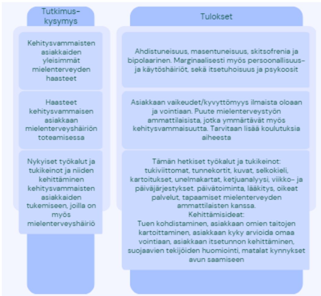
Kuvio 3, Tulokset tutkimuskysymyksiin