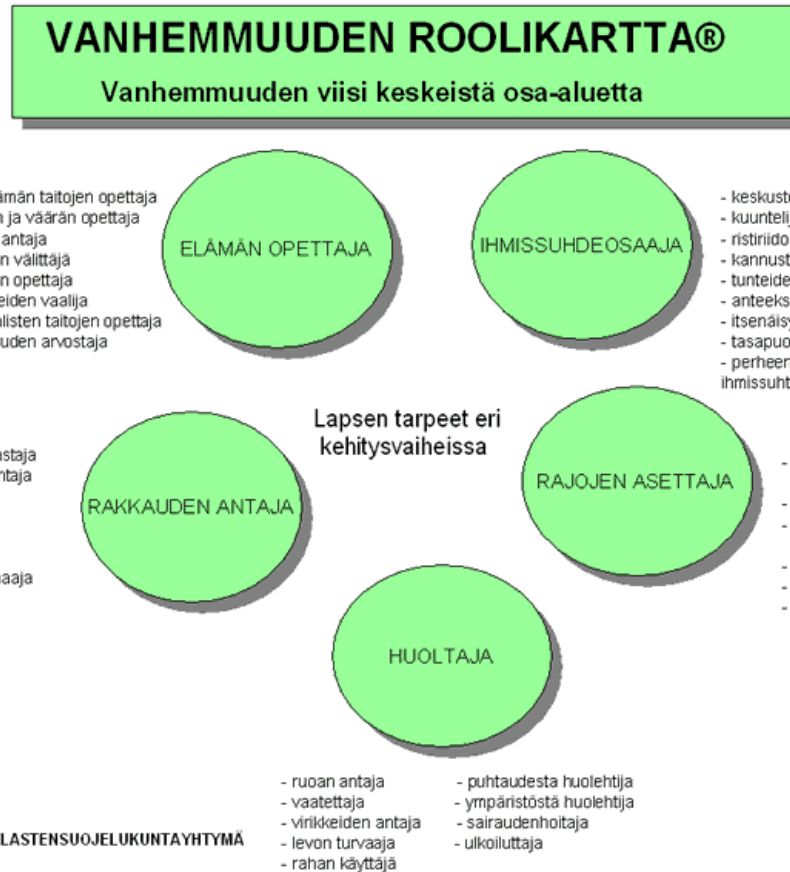
Kuva 1. Vanhemmuuden roolikartta

Vanhemmalla on samaan aikaan erilaisia rooleja, joista huoltajuus on tärkein perusta. Lapsi tarvitsee puhtaudesta, levosta, terveydestä sekä sairaudesta huolehtijaa. Rakkauden antajana vanhempi kasvaa usein vähitellen. Aina rakkaus ei syty tuoreella vanhemmalla heti lapsen synnyttyä. Kiintymyssuhde kasvaa vähitellen hoitamalla ja koskettamalla. Elämän opettajana vanhempi siirtää lapselleen malleja ja arvoja sekä monenlaisia taitoja toisen kunnioittamisesta vaatteistaan huolehtimiseen. Ihmissuhdeosaajan rooli korostaa toisesta välittämistä. Vanhempi neuvoo lapselleen, miten ottaa vastaan myös negatiivisia tunteita ja riiteilyä. Rajojen asettajana vanhempi huolehtii lapsen turvallisuuteen liittyvistä asioista. Turvaa lapselle tuovat säännöt, rutiinit ja toisto. Rajat estävät kielteisiä asioita, kuten kipua tai uhkaa, tulemasta lapsen elämään. (Hermanson 2012.) Vanhemmuuden roolikarttaa pystytään hyödyntämään apuvälineenä keskusteluissa esimerkiksi vanhempainilloissa koulussa ja päivähoidossa sekä neuvoloiden vanhempainryhmissä. (Terveysten ja hyvinvoinnin laitos 2014a.)