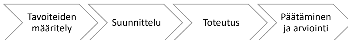
Kuvio 2: Salosen lineaarinen malli (Salonen, 2013)

Opinnäytetyö etenee lineaarisen mallin mukaan (kuvio 2). Salosen mukaan työssä edetään loogisessa järjestyksessä (Salonen ym 2017, 52). Toiminnallisessa opinnäytetyössä lineaarinen malli on useasti käytetty. (Salonen 2013, 15.)