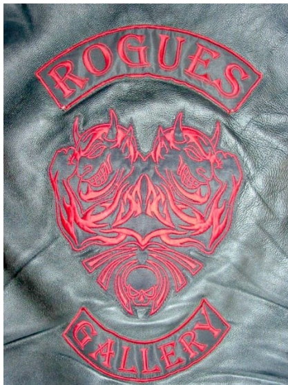
Kuva 5. Poliisin kuva Rogues Galleryn jäsenen takin selkäpuolelta. (Julkaissut Turun Sanomat 22.11.2010)

Rogues Galleryn jäsenet ampuivat vuonna 2000 Lahden keskustassa sijainneessa pizzeriassa kolme miestä hengiltä, joista kaksi kuului Bandidos-moottoripyöräjengiin sekä yksi Black rhinos – jengiin. Tapahtumahetkellä ravintolassa oli yhteensä 23 ihmistä, joista seitsemän sai osumia. Tapauksessa tuomittiin kaksi Rogues Galleryn jäsentä kolmesta murhasta ja yhdestä murhan yrityksestä, yksi jäsen murhan yrityksestä ja vaaran aiheuttamisesta sekä yksi avunannosta kolmeen murhaan. MTV uutisten mukaan murhasta tuomitut miehet olivat kuuluneet aikaisemmin Cannonball- moottoripyöräjengiin. (Lahden pizzeriamurhasta elinkautiset, MTV Uutiset, 12.04.2001.)