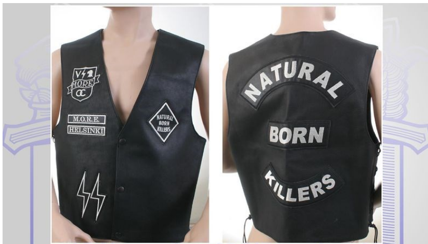
Kuva 4. Natural Born Killersin tunnuksellinen liivi. (Julkaissut MTV Uutiset 27.01.2020.)