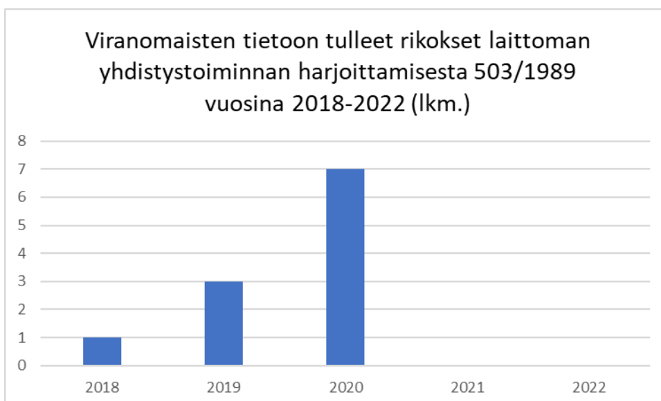
Kaavio 1: Laittoman yhdistystoiminnan harjoittamisen (YhdL 62 §) tilasto.

Kyseinen laittoman yhdistystoiminnan harjoittaminen on harvinaislaatuinen rikos niin tuomioistuimissa kuin esitutkinnassakin. Alla olevasta kaaviosta on nähtävissä kyseisten rikosten määrä vuodesta 2018 vuoteen 2022. Tilasto on rakennettu tilastokeskuksen tietojen perusteella.