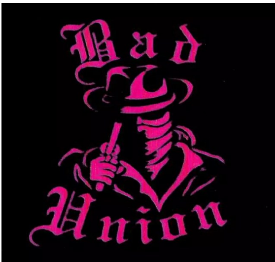
Kuva 3. Bad Unionin tunnus. (Julkaissut Ilta-Sanomat 11.09.2019)

Bad Unionilla oli käytössään oma tunnus, joka oli ulkoisesti värityksensä sekä kirjoitustyyliinsä osalta identtinen United Brotherhoodin tunnuksen kanssa. BU:lla ei ole ollut käytössään omia liivejä, vaan tunnukset esiintyivät muussa vaatetuksessa. Vaatetus on ollut väriltään punamustaa. BU:lla on puolestaan ollut käytössään ”221” tunnus, joka niin ikään muodostuu kirjainten järjestyksestä aakkosissa. (KO 21/11145, 4–5.)