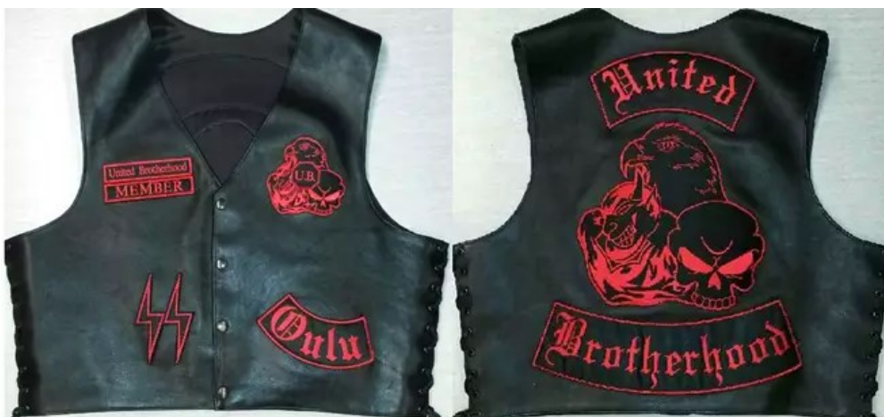
Kuva 1. United Brotherhoodin täysjäsenen liivi. (Julkaissut Helsingin Sanomat 19.05.2016.)

Järjestön keskeisenä tunnusmerkkinä on liivien lisäksi pidetty myös ”212” tunnusta, joka tarkoittaa ”UB” kirjaimien järjestystä aakkosissa. U on aakkosissa 21. kirjain, B taas kirjaimissa toinen. (KO 21/11145, 5.)