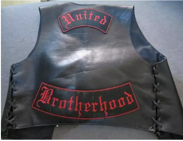
Kuva 2. United Brotherhoodin puolikasjäsenen liivi kuvattuna selkäpuolelta. (Julkaissut Helsingin sanomat 24.01.2020.)

BAD UNION. Bad Union – niminen yhdistys on puolestaan perustettu vuonna 2016 toimimaan UB:n alayhdistyksenä sekä rekrytointikanavana. UB on rekrytoinut rikoksista tuomittuja henkilöitä vankiloista, joka on osoittanut sen halukkuutta saada yhdistyksensä toimintaan mukaan rikoksen tekemiseen kykeneviä henkilöitä ja siten turvata rikollisen toimintansa jatkuvuutta. BU:lla ei ollut omia kokoontumistiloja vaan se toimi samoissa tiloissa UB:n kanssa yksittäisten osastojen sisällä, eikä täten ole ollut oma organisaationsa. (KO 21/11145, 3.)