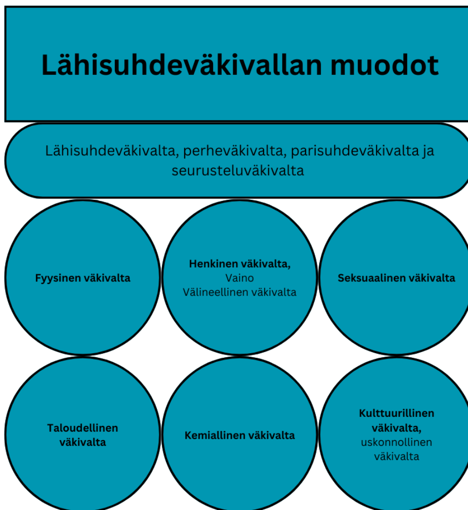
Kuva 1. Lähisuhdeväkivallan muodot. (Koskela & Mäenpää 2023).

Yläkäsitteenä on lähisuhdeväkivallan eri lähisuhdeväkivallan ilmenemismuodot ja lähisuhdeväkivallan muodot. Lähisuhdeväkivallan voisi sanoa olevan yläkäsite sille väkivallan muodolle, joka kohdistetaan läheisessä suhteessa olevaan ihmiseen. Väkivallan kohteena voi siis olla lapsi, entinen tai nykyinen puoliso ja jopa lähisukulainen. Perheväkivalta taas on osa lähisuhdeväkivaltaa, silloin kun väkivalta kohdistetaan kaikkiin perheeseen kuuluviin joko suoraan tai väkivallan seurauksien kautta. (Bildjuschkin ym. 2020, 7.)