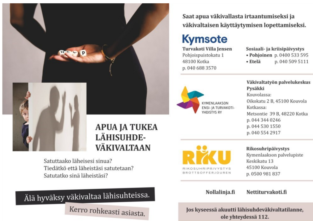
Kuva 2. Apua ja tukea lähisuhdeväkivaltaan toimintakortti. (Lähisuhde ja seksuaaliväkivalta s.a)

Kotkassa sijaitseva Villa Jensen turvakoti on avoinna ympärivuorokautisesti. Villa Jensen tarjoaa asiakkaalleen maksuttoman suojan ja ammattilaisen avun lähisuhdeväkivallan loppumisen. Villa Jensen antaa äkilliseen tilanteeseen kriisiapua, sekä tarjoaa ohjausta, neuvontaa ja tukea käytännön asioiden järjestämisestä. (Turvakoti Villa Jensen s.a.)