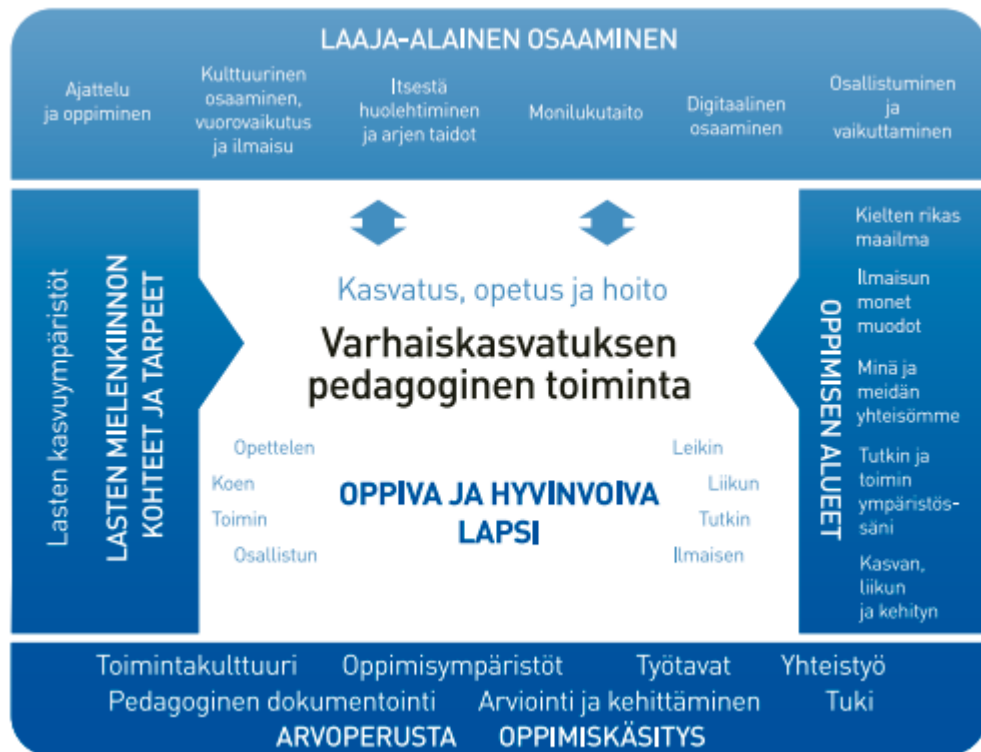
Kuvio 1. Varhaiskasvatuksen pedagogisen toiminnan viitekehys (Opetushallitus 2022, 38).

kokonaisuudessa sekä toimintakulttuurin ja oppimisympäristöjen kehittämisessä. Laaja-alaisen osaamisen kehittyminen on varhaislapsuudessa alkava elämänmittainen prosessi, joka edistää lasten kasvua yksilö- ja yhteisötasolla. (Opetushallitus 2022, 23–24.)