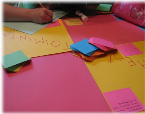
Kuva 7. Hevostoiminnasta tehty ajatustaulu.