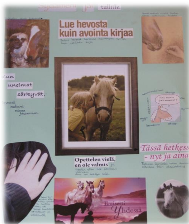
Kuva 10. Nuoren tekemä posterit hevostoiminnasta.

Myös seuraavasta havainnollistamiseen käytetystä kuvasta voidaan löytää näitä elementtejä. Alla oleva kuva (kuva 10.) on nuoren tekemästä posterista, johon hän on koonnut omia ajatuksiaan hevostoiminnasta. Aivan posterin yläotsikkona lukee ”Sydämeni jäi tallille”.