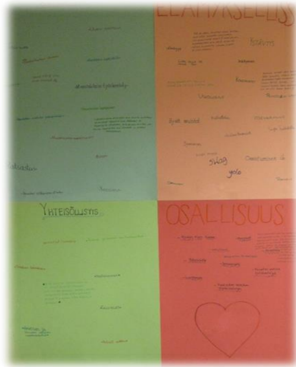
Kuva 4. Neljä keskeistä teemaa -posterit.