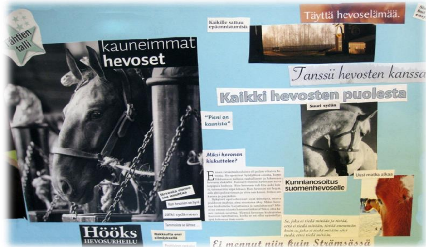
Kuva 11. Erään nuoren posterin.

Nuoret puhuvat siis paljon siitä, mitä he hevosten kanssa ja hevosilta ovat oppineet. Seuraava nuori on oppinut paremmin tuntemaan itseään lempi hevosensa avulla. Oppimisen nuoret liittyvät herkästi kuvailemaan hyvinvointia ja onnistumisen kokemuksia.