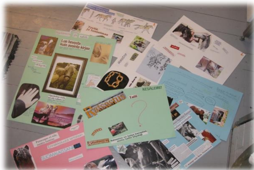
Kuva 3. Nuorten tekemät posterit.

Jokainen sai valita, missä työskenteli oman kartonkinsa parissa, ja osa nuorista haki itselleen oman rauhallisen nurkan. Nuorilla oli lupa keskustella, mutta lähes kaikki nuorista keskittyivät suhteellisen intensiivisesti omaan tuotokseensa. Jokainen nuori työskenteli oman kiinnostuksensa ja sen hetkisen aktiivisuutensa kantamalla energialla. Osa nuorista pyysi lisää kartonkia, ja he keskittyivät töihinsä jopa 1,5 tuntia. Kaikkien tuotokset olivat sen mukaisia, että niihin oli nähty vaivaa ja käytetty aikaa. Nuoret saivat itse pitää tekemänsä posterit, mutta niiden dokumentoimiseksi niistä otettiin kuvia tätä kirjallista prosessia varten, erityisesti tutkimuksen analysointia varten. Ne toimivat myös hyvänä välineenä havainnollistaa toteutettua toimintaa.