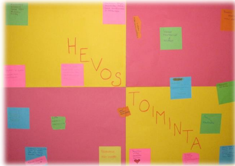
Kuva 1. Hevostoiminta -ajatustaulu.

Hevostoiminta ajatustaulun jälkeen työskentelyä jatkettiin yksilötehtävän parissa. Jokainen nuori sai valita, minkä värisen kartongin halusi. Valitsemaansa kartonkiin he saivat joko piirtää, kirjoittaa tai leikata lehdistä kuvia ja koota posterin siitä, millaisena he näkevät hevostoiminnan. Lehdistä leikkaaminen ja kartongille liimaaminen valikoitui lähes jokaisen suosiioon. Lopputuloksena syntyi seuraavissa kuvissa esiintyvät posterit (kuvat 2. ja 3.).