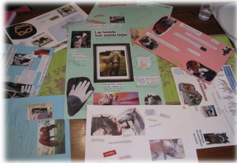
Kuva 2. Nuorten tekemät posterit.

Hevostoiminta ajatustaulun jälkeen työskentelyä jatkettiin yksilötehtävän parissa. Jokainen nuori sai valita, minkä värisen kartongin halusi. Valitsemaansa kartonkiin he saivat joko piirtää, kirjoittaa tai leikata lehdistä kuvia ja koota posterin siitä, millaisena he näkevät hevostoiminnan. Lehdistä leikkaaminen ja kartongille liimaaminen valikoitui lähes jokaisen suosiioon. Lopputuloksena syntyi seuraavissa kuvissa esiintyvät posterit (kuvat 2. ja 3.).