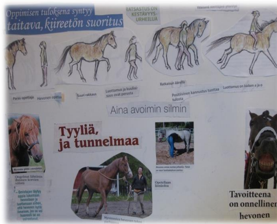
Kuva 8. Erään nuoren posteri.