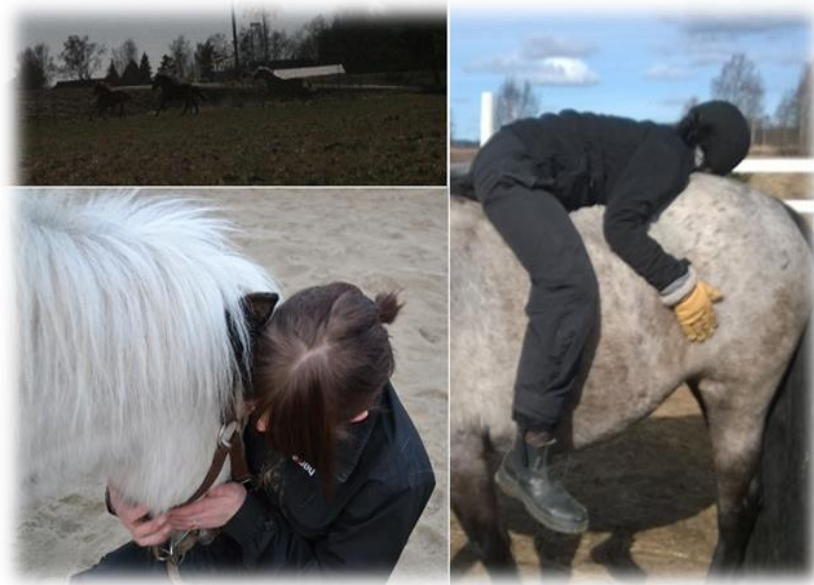
Kuva 6. Nuorten ottamia kuvia.

Siitä syystä, että videoita ja niihin otettuja kuvia ei ole tarkoitettu kolmansien osapuolten nähtäville, ei niitä voida käyttää toteutetun toiminnan havainnollistamiseen tässä kirjallisessa raportissa. Siitä huolimatta opinnäytetyön tekijällä on kirjallinen lupa esittää havainnollistamisen tueksi seuraava kolmen kuvan kuvakollaasi (kuva 6.), josta tunnistettavuus on häivytetty kuvanmuokkausohjelmalla.