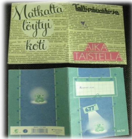
Kuva 5. Nuorten päiväkirjoja.

Sekä nuorten päiväkirjojen että heidän hevostoiminnasta tuottamien kertomusten avulla on pyritty ymmärtämään nuoria heidän itsensä tuottamien kirjallisten tuotosten avulla. Hirsjärven, Remeksen ja Sajavaaran mukaan kirjoittaminen tekee nuorten ajatukset näkyviksi ja toisaalta se myös mahdollistaa vuorovaikutuksen ajatustemme kanssa sekä niiden jatkuvan muokkaamisen. Tutkijan näin toimiessa voidaan puhua elämäkerrallisista lähestymistavoista sekä persoonallisiin dokumentteihin perustavasta tutkimuksesta. Edellä mainitut menetelmät kuuluvat narratiivisen tutkimuksen piiriin. (Hirsjärvi ym. 2007, 213–214.)