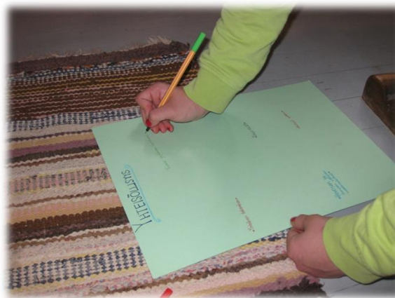
Kuva 9. Yhteisöllisyys yhtenä teemanä.

Viides käytetty menetelmä oli opinnäytetyön tekijän itse tekemä dokumentointi toiminnan havainnoinnista ja tarkkailusta. Toiminnan havainnoimisessa on käytetty avuksi toiminnan havainnointirunkoa (liite 2.), joka perustuu neljään sosiaalipedagogista hevostoimintaa ohjaavaan perustekijään, jotka ovat toiminnallisuus, elämyksellisyys, osallisuus ja yhteisöllisyys. Havainnoiminen on kvalitatiivisessa tutkimuksessa niin sanotusti pe-