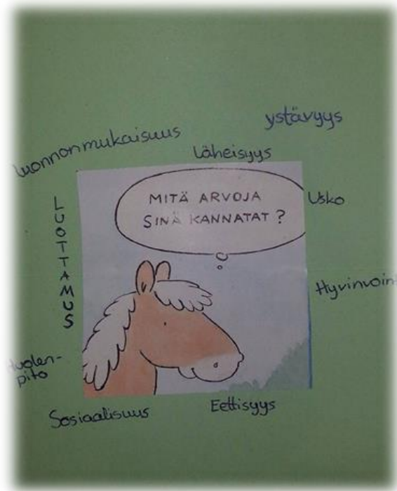
Kuva 12. Yhden nuoren arvomaailma.

Nuorten puheista, kirjoituksista sekä videoista nousee esille useasti siis asioita, jotka ovat tärkeitä heidän elämässään. Edellisessä kappaleessa mainittu nuori, joka oli hahmotellut oman arvokarttansa posteriinsa (kuva 12.), oli siis valinnut kartongin keskelle piirroskuvan hevosesta, joka kysyy ”Mitä arvoja sinä kannatat?” Tähän kysymykseen nuori oli vastannut kirjaten ajatuksiaan kuvan ympärille. Tämän mukaan kyseisen nuoren arvot koostuvat luonnonmukaisuudesta, läheisyydestä, uskosta, hyvinvoinnista, eettisyydestä, sosiaalisuudesta, huolenpidosta sekä luottamuksesta. Erityisesti luottamusta on korostettu kirjoittamalla sana isoilla tikkukirjaimilla.