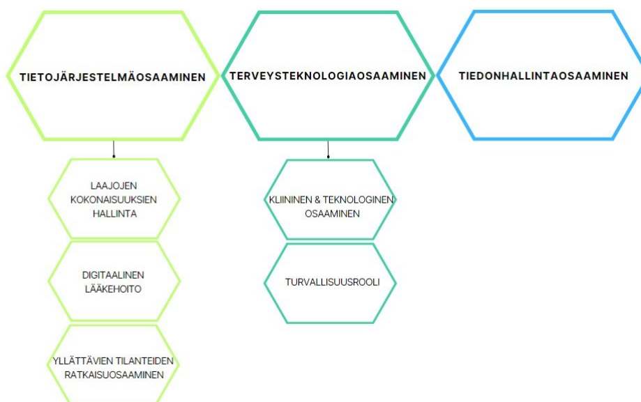
Kuva 2. Digitaalisen asiakas-/potilasturvallisuusosaamisen teemat

Aineistosta löydettiin kolme tutkimuskysymykseen vastaavaa pääteemaa. Teemat ovat tietojärjestelmäosaaminen, terveysteknologiaosaaminen ja tiedonhallintaosaaminen. Lisäksi kaksi ensimmäistä teemaa jaettiin aineistosta tunnistettuihin alateemoihin. Tietojärjestelmäosaaminen jaettiin alateemoihin, joita olivat laajojen kokonaisuuksien hallinta, digitaalinen lääkehoito ja yllättävien tilanteiden ratkaisuosaaaminen. Pääteema terveysteknologiaosaaminen jaettiin kahteen alateemaan, kliininen ja teknologinen osaaminen ja turvallisuusrooli. Ensimmäisen tutkimuskysymyksen teemat alateemoinen on esitetty kuvassa 2.