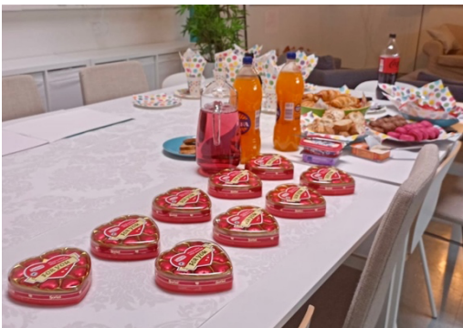
Kuvio 4: Ranskalainen kahvila

Viimeisellä tapaamisella pidimme yhdessä etukäteen sovitun ranskalaisen kahvilan, jossa oli tarjolla erilaisia herkkuja (kuvio 4). Teimme seinälle taidenäyttelyn ryhmän aikana ryhmäläisten tekemistä teoksista (kuvio 5). Kaikki ryhmäläiset saivat tuoda viimeisellä kertaa ryhmään mukaan haluamansa biisin, jotka soitettiin anonyymisti.