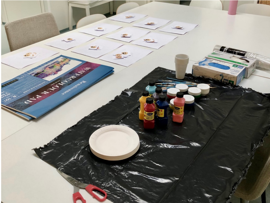
Kuvio 3: Maalaamista

Ryhmässä käytiin läpi eri tunteiden tuntumista kehossa, pohdittiin miltä eri tunteet näyttävät, kuinka pahasta tunteesta voi saada hyvän tunteen, miten musiikki vaikuttaa tunteeseen sekä kuinka erilaisen musiikin kuunteleminen ohjaa maalaamista (kuvio 3). Ryhmässä hyödynnettiin mielikuvaharjoituksia muun muassa tunteiden tunnistamisen apuna. Työmenetelminä ja -välineinä musiikin, maalaamisen, tarvekorttien ja mielikuvaharjoitusten lisäksi käytettiin saven muotoilemista, piirtämistä sekä kirjoittamista.