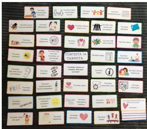
Kuvio 1: Tarvekortit

Työskentelyn kannalta on tärkeää, että osallistujat uskaltavat osallistua ryhmässä, joten turvallisuuden luominen heti ryhmätyöskentelyn alussa oli tärkeää. Tunnetaitoryhmässä käytiin läpi tunnesäätelyn vaiheita, kuten tunteiden tunnistamista ja käsittelyä. Ryhmä toteutettiin kevään 2023 aikana. Tapaamisia oli kerran viikossa ja kukin tapaaminen kesti kokonaisuudessaan noin kaksi tuntia. Ryhmä tapasi yhteensä kahdeksan kertaa. Ryhmän suunnittelijana ja ohjaajana toimi tunnetaito-ohjaajakoulutuksen (LTTO) käynyt ohjaaja.