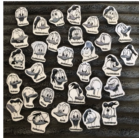
Kuvio 2: Fiiliskuvia

Ensimmäisellä kerralla tunnetaitoryhmässä tutustuttiin osallistujiin ja orientoiduttiin ryhmään ja aiheeseen sekä sovittiin yhteisistä pelisäännöistä. Pelisäännöiksi muodostui 1. ilmapiiri ja sen, että kaikki saavat olla omana itsenään ryhmässä, 2. luottamuksellisuus, 3. saa jättää väliin, 4. pidä huolta omista rajoistasi, 5. kaikki ovat yhtä tärkeitä / samanarvoisia ja -vertaisia, 6. oppiminen on prosessi sekä kaikkein tärkeimpänä pelisääntönä nousi esiin se, että 7. kaikki tunteet ovat sallittuja.