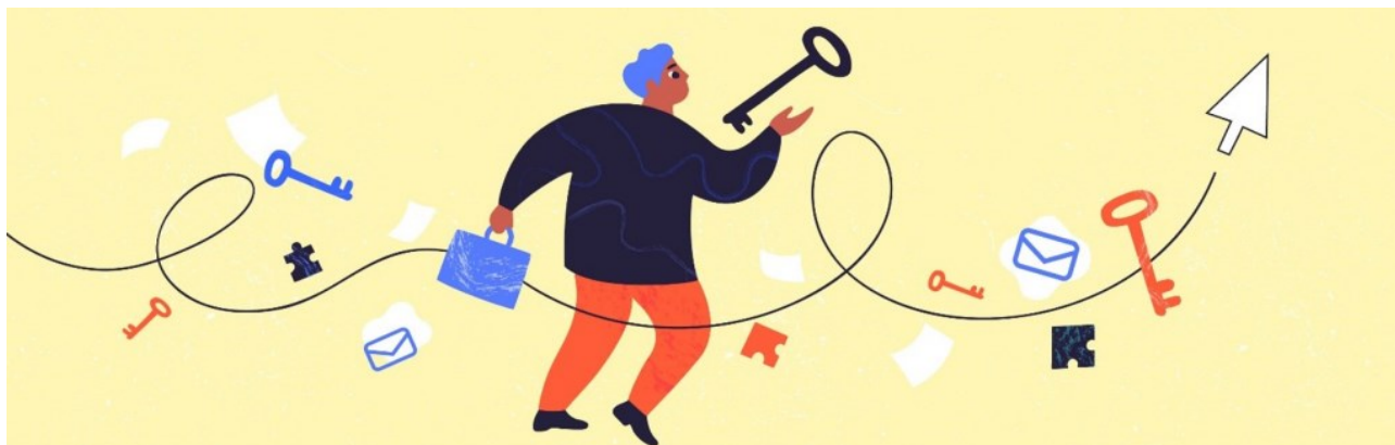
KUVA 1. Opettajatuutori on opiskelijan lähiohjaaja.

Ohjauksella hyvinvointia (OHJY) -hankkeen Oamkin osaprojektissa kehitettiin Study Group -tuutorointia. Alkuperäinen idea oli syntynyt jo ennen hanketta, kun tietojenkäsittelyn tutkinto-ohjelmassa mietittiin verkkoryhmien tuutoroinnin kehittämistä . OHJY-hankkeessa Study Group -tuutorointia pilotoitiin yhdeksässä eri tutkinto-ohjelmassa. Mukana piloteissa oli lähes tuhat opiskelijaa ja 25 opettajatuutoria. Study Group -tuutorointikoulutuksiin osallistui yhteensä 56 opettajatuutoria. (Kuva 1.)