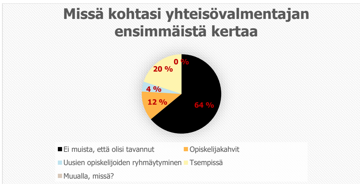
Kaavio 2: Missä kohtasi yhteisövalmentajan ensimmäistä kertaa

Kyselyyn vastasi 25 opiskelijaa. Kysely oli kuitenkin avattu 89 kertaa vastaajien puolelta. Opiskelijoista 54% ei muista tavanneensa yhteisövalmentajaa koululla, 33% Tiesi tavanneensa yhteisövalmentajan ja 13% opiskelijoista ei ollut varma.