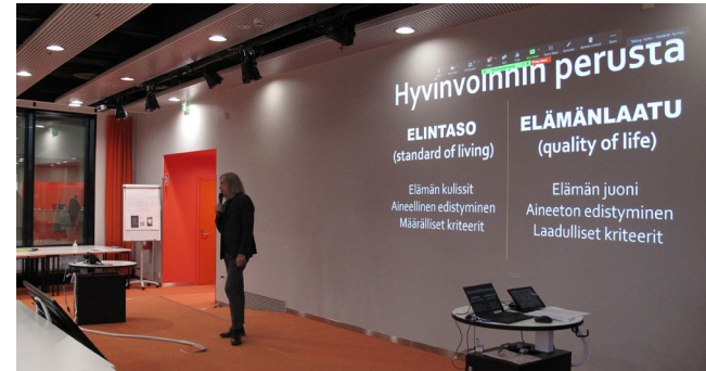
Kuva 1. Arto O. Salonen pitämässä päivän ensimmäistä alustuspuheenvuoroa.

Kestävä hyvinvointi edustaa kokonaisvaltaista, integroitua ja systeemistä lähestymistä elintasoon, elämänlaatuun ja kestävyteen. Siinä yhdistyvät hyvän elämän tavoittelun tavat ja kestävyyspyrkimykset yksilön, yhteiskunnan ja planeetan tasolla.