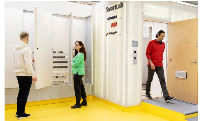
Kuva 7. SmartLab.

Kestävän hyvinvoinnin tulevaisuustyöpajassa kutsuimme osallistujia yhteiskehittämään digitalustaa. Työpajan aluksi tutustuttiin Metropolian Myllypuron kampuksella sijaitsevaan SmartLab-livinglabiin, joka on Metropolian, ABB:n ja Skanskan yhteistyöstä syntynyt älykkään asumisen