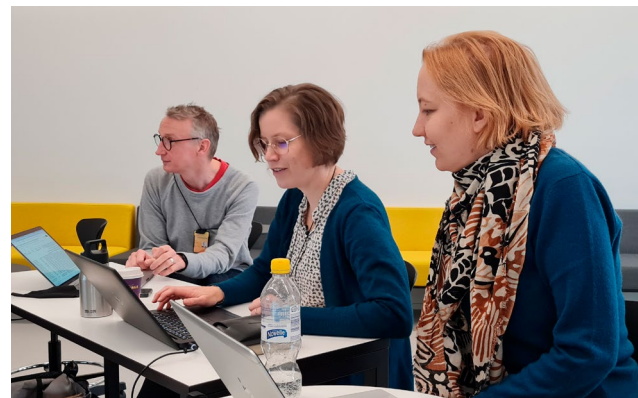
Kuva 5. Yhteistä keskustelua osallistuvan TKI-kumppanuuden äärellä.

Heti tämän mikrokirjan alkumetreillä on esitetty tärkeä kysymys siitä, miten yhdenvertainen osallistuminen ja yhteistoiminta mahdollistetaan. Lisäksi aiemmissa puheenvuoroissa aiheesta on pohdittu myös yksilön ja yhteisön hyvinvointia rakentavasta näkökulmasta. Minua kiehtoo erityisesti näkökulma siitä, mitä hyvinvointivaikutuksia yhdenvertainen osallistuminen ja yhteistoiminta voivat aikaansaada. Mitä kaikkea mahdollistuu, kun kukaan ei ole kohde vaan kanssakehittäjä, kanssa-ajattelija, ehkä jopa rohkea kanssa-muuttuja? Kun kukaan ei yritä hallita kenenkään ajatuksia tai kukaan ei ole kenenkään muutoskohteena, annetaan tilaa hyvin erilaisille hyvinvointia rakentaville ajatuskokeiluille ja yhdessä tutkimiselle.