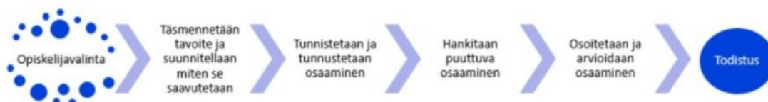
Kuva 3 Henkilökohtaistamisprosessi (oph).

omaan opiskeluunsa siten, että opintojen edetessä työpaikalla tapahtuvan oppimisen painoarvo ja määrä lisääntyvät. Suunnitelmassa määritetään opiskelijan tarvitsemaa ohjausta ja tukea opintoihin. HOKS-suunnitelmaa päivitetään opintojen edetessä ja suunnitelmien tarkentuessa tai muuttuessa koko opiskelun ajan. (Henkilökohtaistaminen 2023.) Kuvassa 3 esitetään henkilökohtaistamisprosessi kaaviokuvana