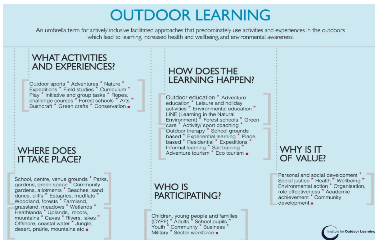
Figure 2: About Outdoor Learning. Outdoor learning described by the Institute for Outdoor Learning (2023).

To explore regenerative practices within Outdoor Educational practices it is useful to first understand what the term ‘Outdoor Education’ means. Where outdoor educational practices have always and in all places been part of, if not a baseline to, human life on Earth, ‘Outdoor Education’ (OE) is a relatively ‘modern’ term and concept. Grown strong in the 20th century, the term serves as an umbrella for a wide, yet specific, variety of approaches, activities, target groups, locations, and outcomes (Brookes 2015, 3, 11–17, UIGSE-FSE 2023). The institute for Outdoor Learning (2023) has provided the following figure (Figure 2) portraying all that falls under the concept of outdoor learning today and gives an idea of this wide-ranging scope that